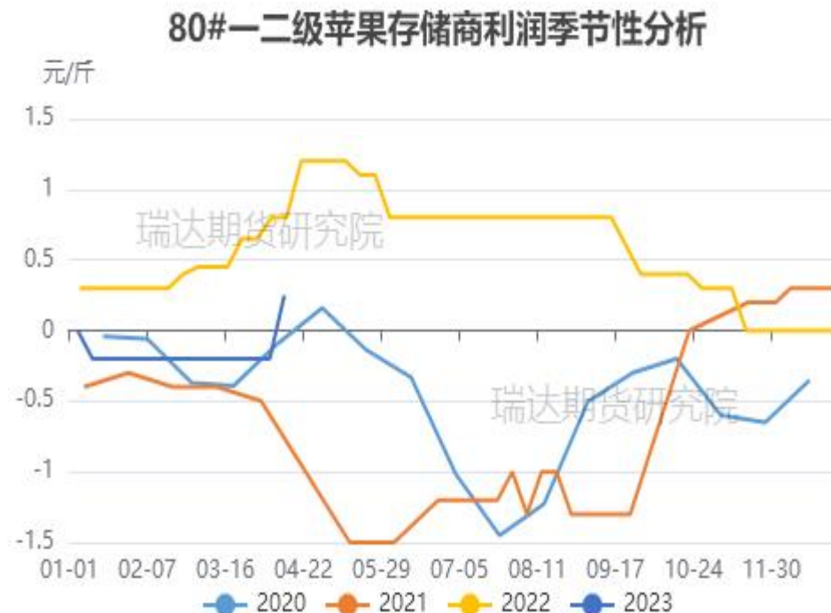
图、80#一二级富士存储商利润走势