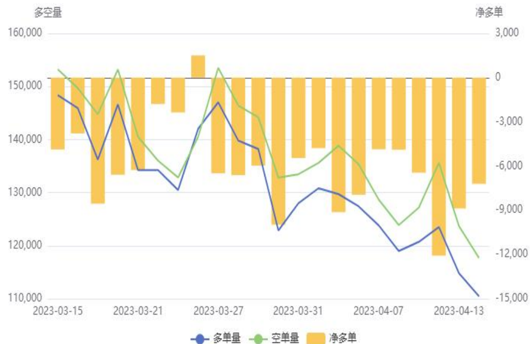
苹果(AP)前20持仓量变化