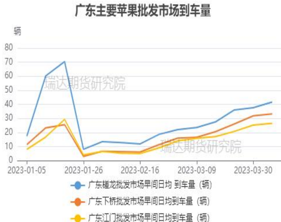
图、苹果批发市场-广东主要批发市场到车量