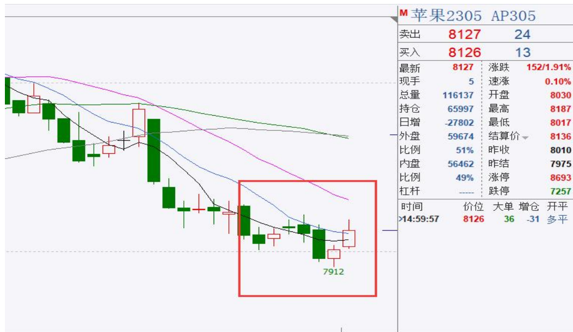
图、苹果主力合约价格走势