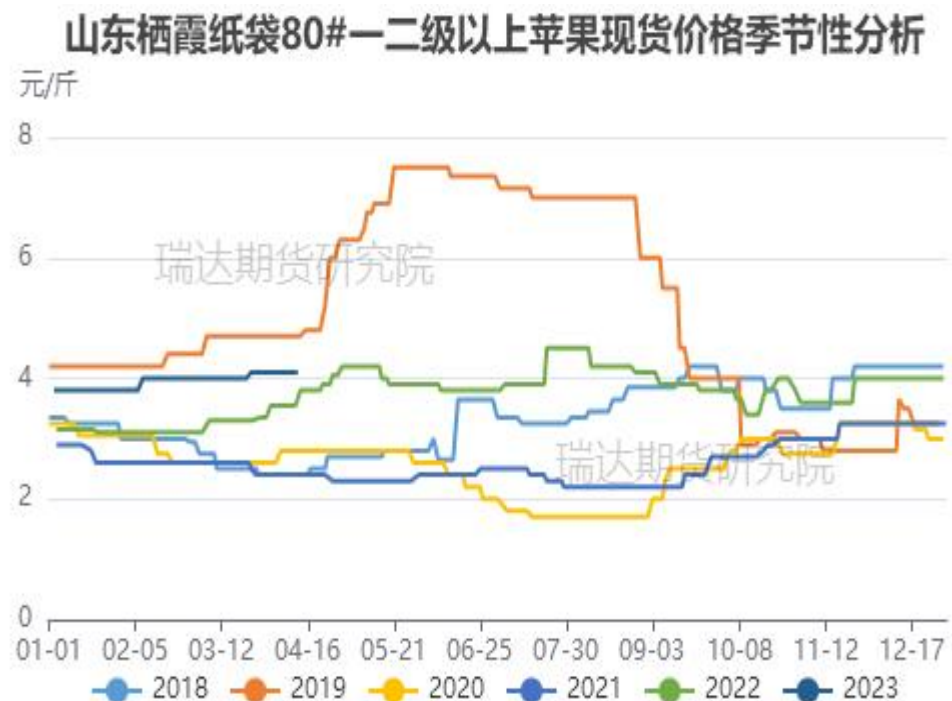
图、山东栖霞80#一二级苹果现货价格季节性走势