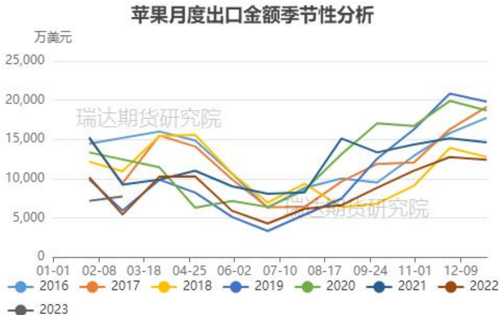
图、苹果出口金额季节性走势