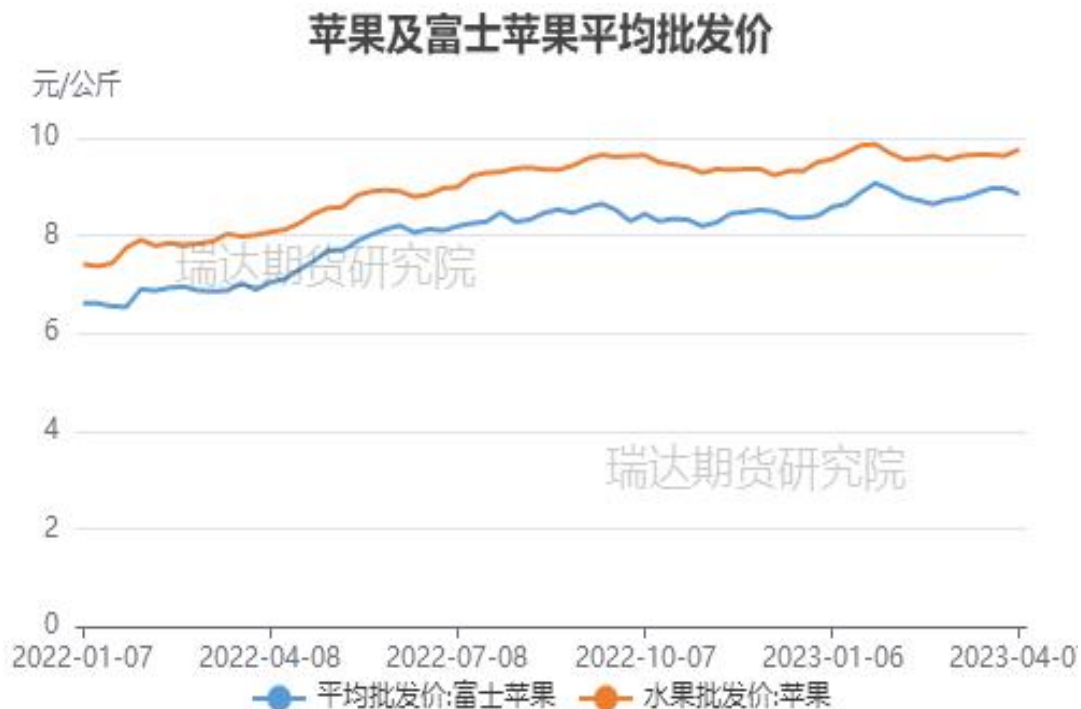
图、全品种苹果及富士苹果批发价格