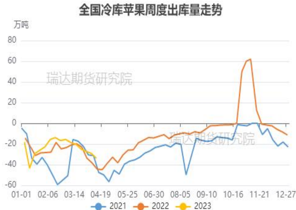
图、全国苹果冷库出库走势