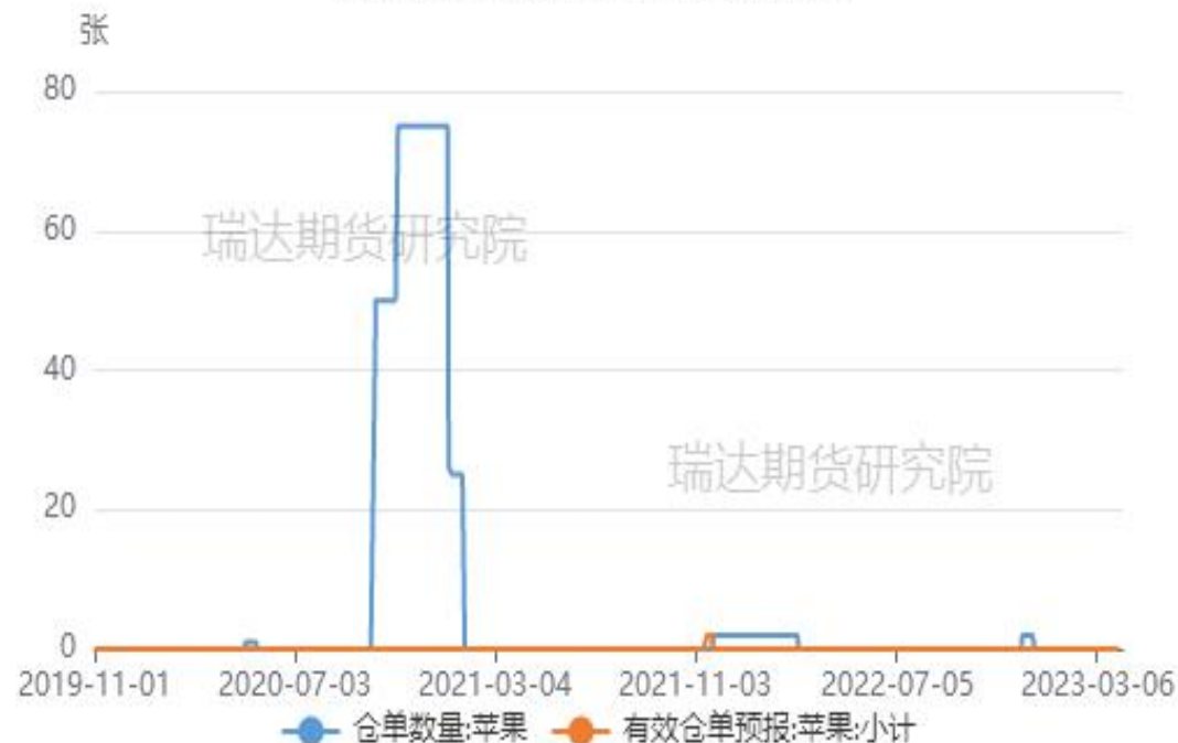
郑商所苹果仓单及有效预报