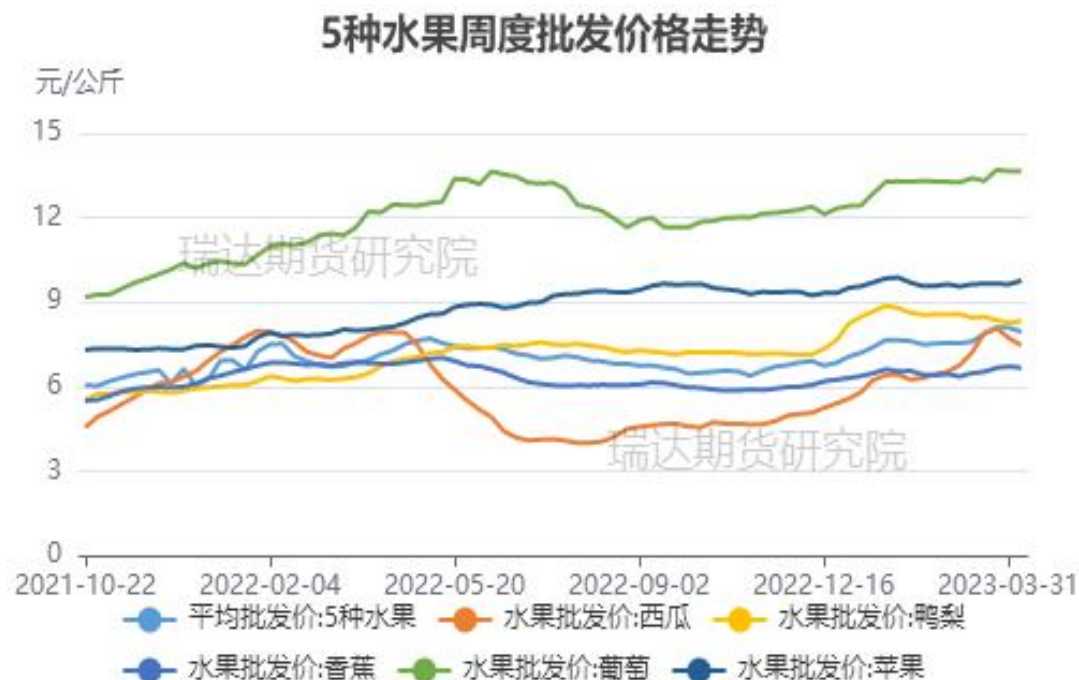
图、5种水果批发价格走势（富士、香蕉、葡萄、鸭梨和西瓜）