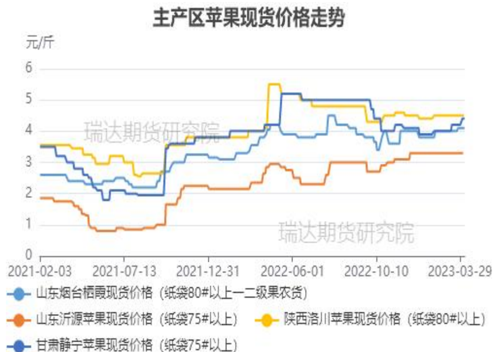
图、主产区苹果现货价格走势