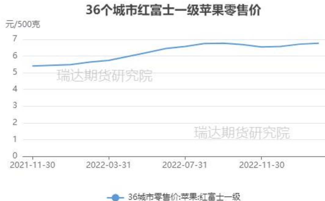
图、36个城市富士苹果零售价格走势