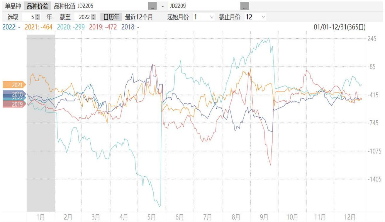
图8：鸡蛋2205合约与2209合约期价价差走势图

8、截至周五，鸡蛋2205合约与2209合约价差报-540元/500千克,处于同期较高水平。