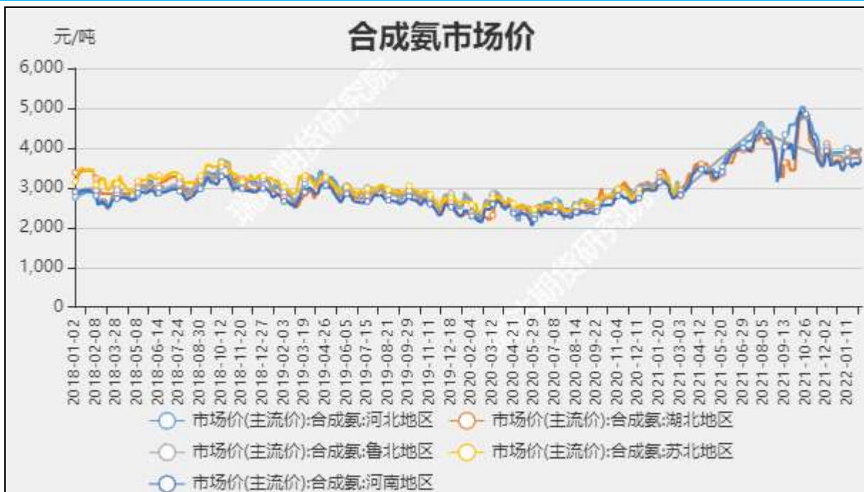
图2: 合成氨市场主流价

截至2月13日, 华东地区原盐市场价600元/吨, +0; 东北地区原盐市场价470元/吨, +0。