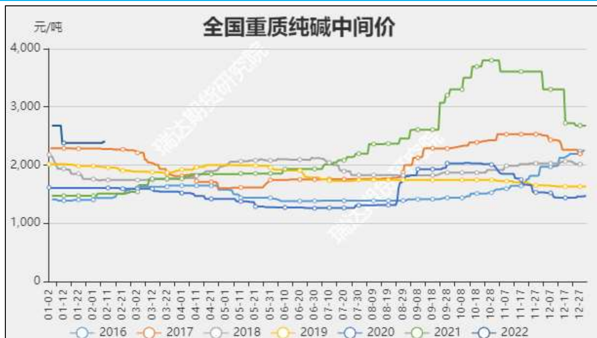
图3：全国重质纯碱中间价