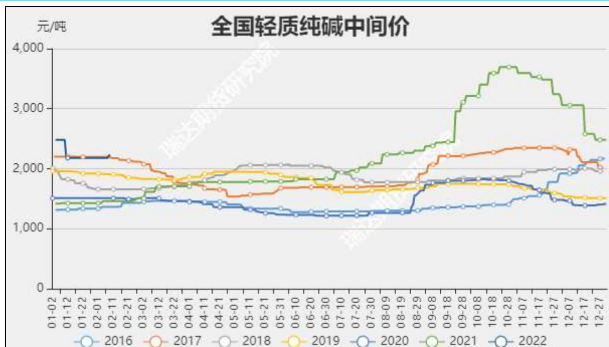
图4：全国轻质纯碱中间价