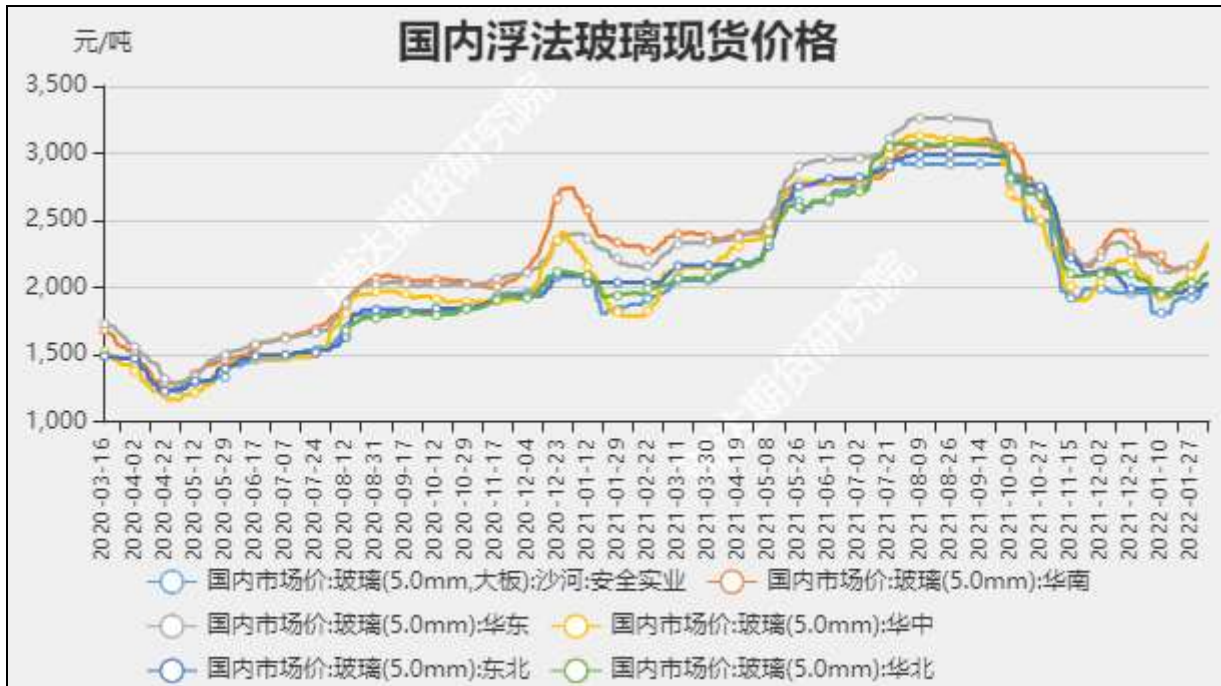
图5：国内玻璃现货价