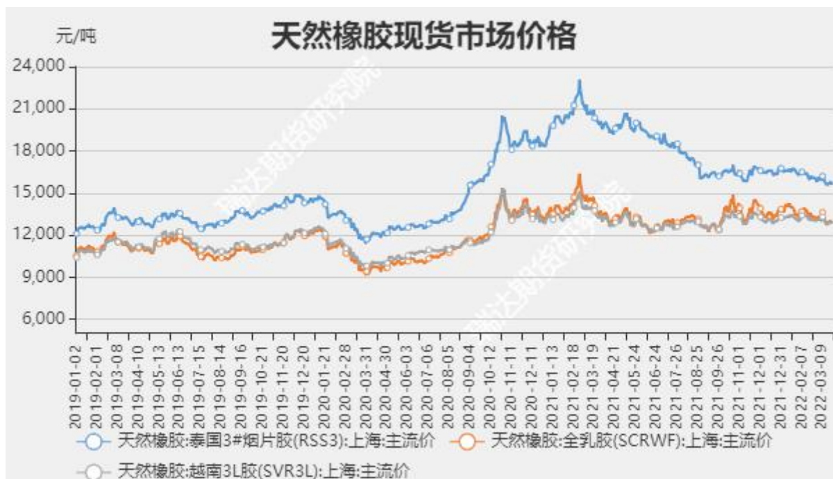
图2 国内天然橡胶市场价