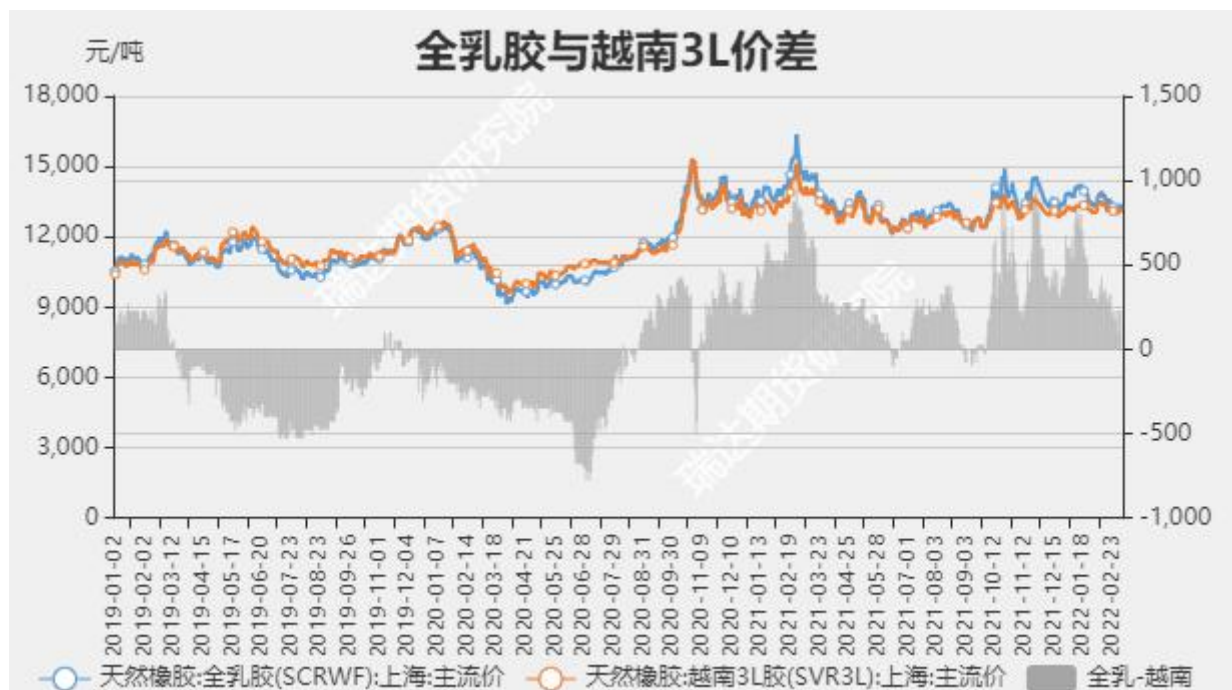
图6 全乳胶与越南3L价差