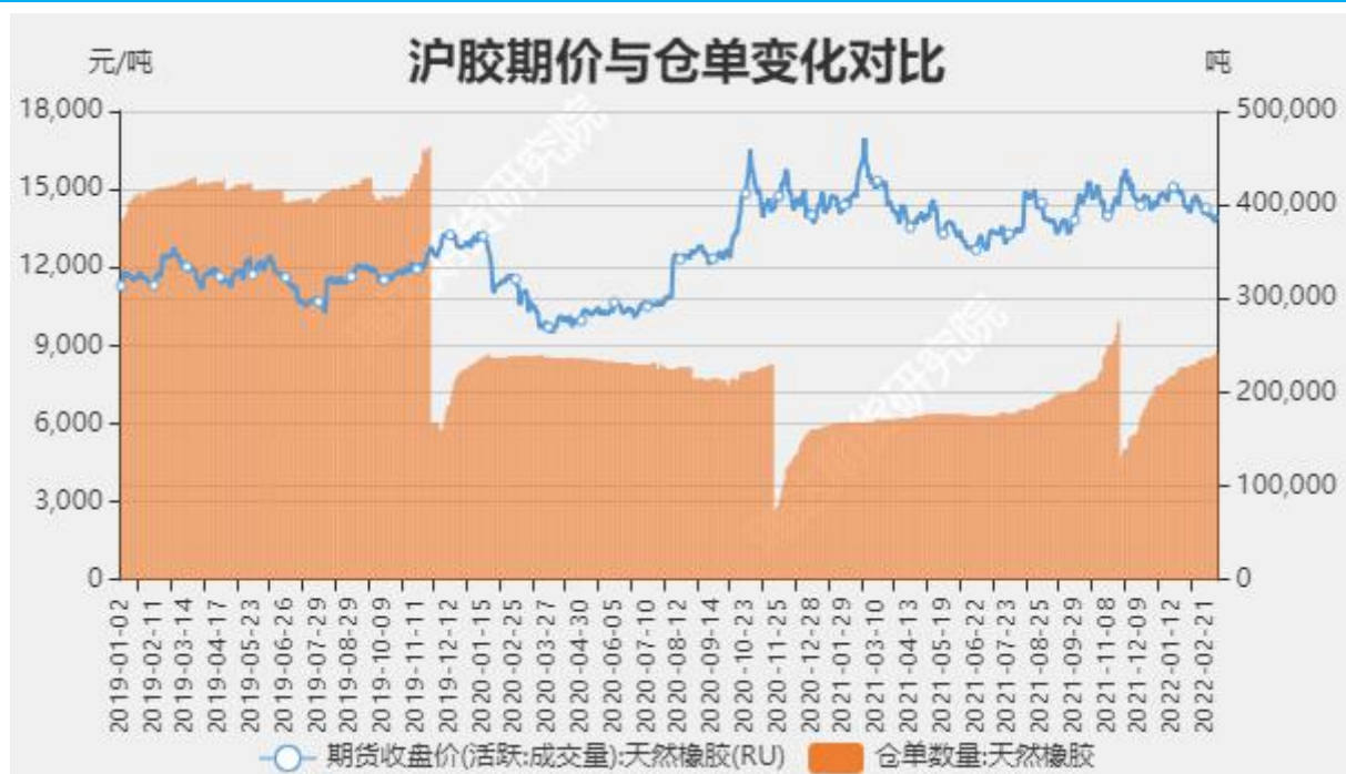
图10 沪胶期价与仓单走势对比