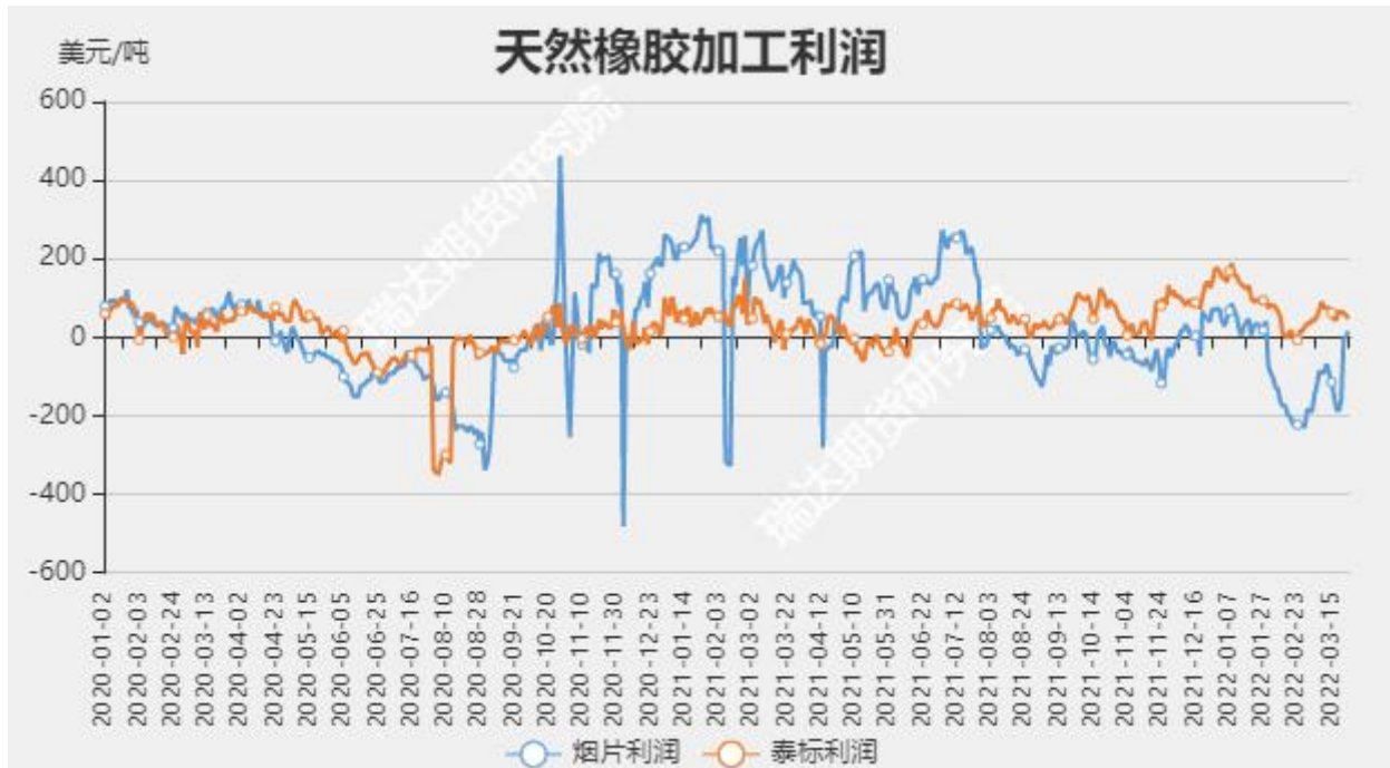
图12 标胶和烟片加工利润

截至3月25日，全钢胎厂家开工率56.55%，环比+4.51%；国内半钢胎厂家开工率为72.15%，环比+2.95%。