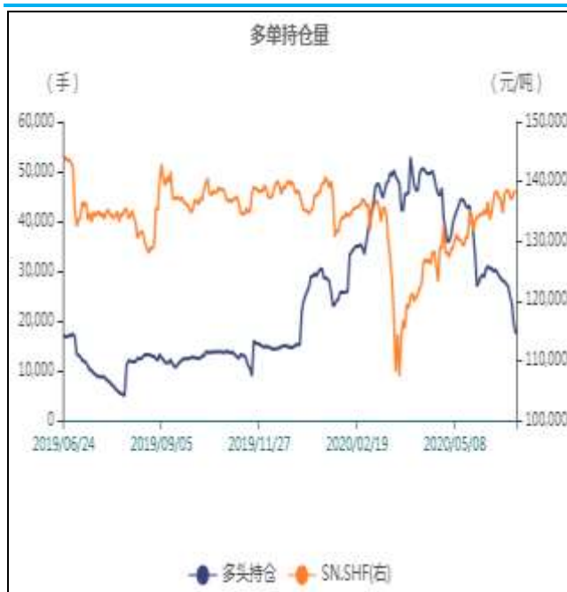
图7：SHF锡前十名多单持仓量