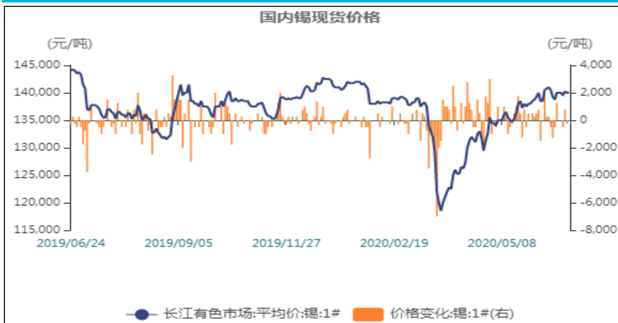
图1：国内锡现货价格

截止至2020年06月24日，长江有色市场1#锡平均价为140,000元/吨，较上一交易日无变化元/吨。从季节性角度来分析，当前长江有色市场1#精炼锡现货平均价格较近5年相比维持在较高水平。