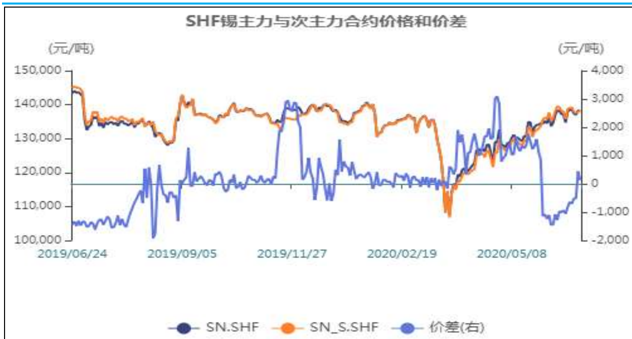
图9：沪锡主力与次主力合约价格和价差

截止至2020年06月24日，沪锡主力合约SN2008收盘价为138,220元/吨，次主力合约SN2009收盘价为138,090元/吨，两者收盘价价差为130元/吨，较上一日减少310元/吨。从季节性角度分析，当前价差较近五年相比维持在较高水平。