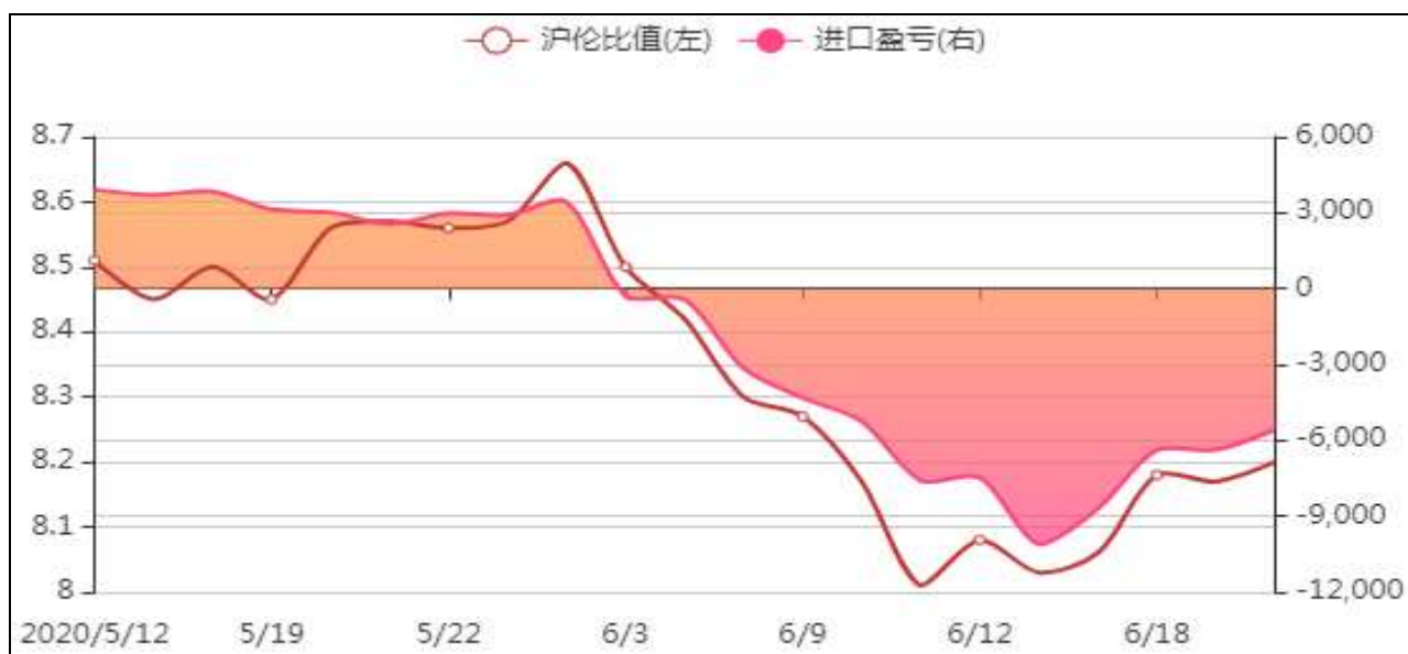
图11：锡进口盈亏分析

截止至2020年06月23日，进口到岸价格145579.9元/吨，进口盈利为-5579.9元/吨，沪伦比值为8.20。