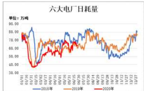
图10：六大电厂日均耗煤量

截止6月24日，六大电厂日均耗煤量 63.59 万吨，较前一周减少 3.41 万吨。