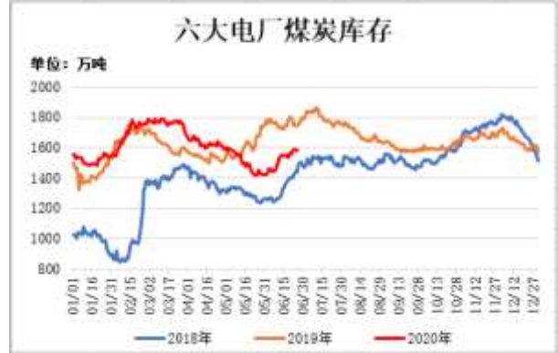
图8：六大电厂煤炭库存

截止6月24日，六大电厂煤炭库存为 1580.53 万吨，较前一周增加 17.81 万吨。