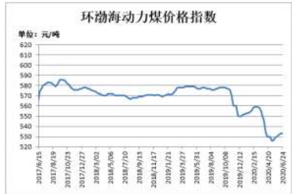
图4：环渤海动力煤价格指数

截止 6 月 24 日，郑煤期货主力合约收盘价 542.4 元/吨，较前一周跌 3.6 元/吨；郑煤期货主力合约持仓量 134172 手，较前一周减 7405 手。