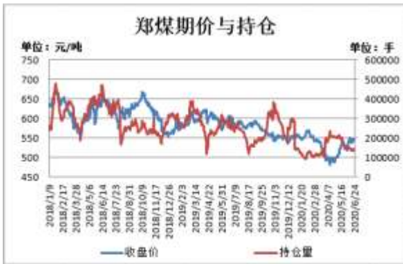
图3：郑煤期货价格与持仓量

截止 6 月 24 日，郑煤期货主力合约收盘价 542.4 元/吨，较前一周跌 3.6 元/吨；郑煤期货主力合约持仓量 134172 手，较前一周减 7405 手。