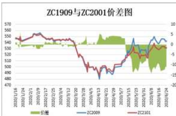
图5：郑煤期货跨期价差

截止 6 月 24 日，期货 ZC2009 与 ZC2101（远月-近月）价差为-10.6 元/吨，较前一周涨 2.2 元/吨。