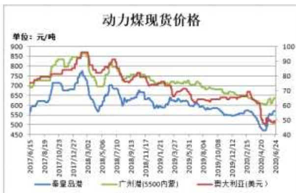
图1：动力煤现货价格

截止 6 月 24 日，秦皇岛港山西优混（Q5500V28S0.5）平仓含税价报 570 元/吨，较上周持平；广州港内蒙优混 Q5500，V24，S0.5 港提含税价 635 元/吨，较上周持平；澳大利亚动力煤（Q5500,A<22,V>25,S<1,MT10）CFR（不含税）报 48 美元/吨，较前一周跌 1 美元/吨。