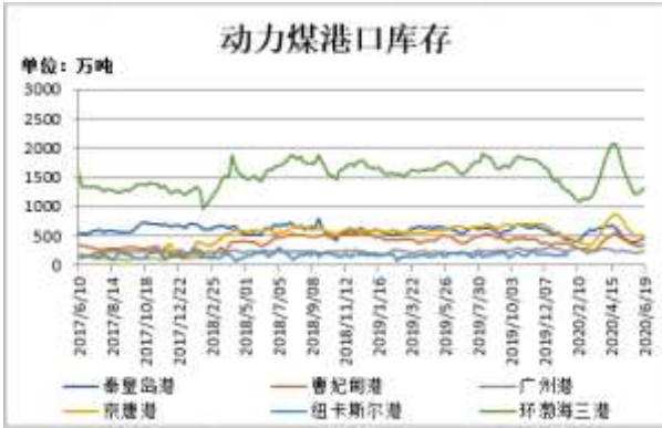
图7：动力煤港口库存

截至6月19日，动力煤港口库存：环渤海三港(秦皇岛港、曹妃甸港、京唐港)港口库存 1305.7 万吨，环比前一周增 45.3 吨；其中秦皇岛港库存 477 万吨，比前一周增 42 万吨；曹妃甸港库存 342 万吨，比前一周增 27.9 万吨；京唐港库存 486.7 万吨，比前一周减 24.6 万吨。广州港库存 235 万吨，比前一周减 4.7 万吨。