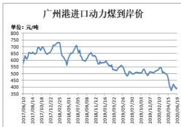
图14: 广州港进口动力煤到岸价

截止 6 月 19 日, CCTD 广州港进口动力煤 (Q5500) 到岸价 394 元/吨, 较前一周涨 6 元/吨。