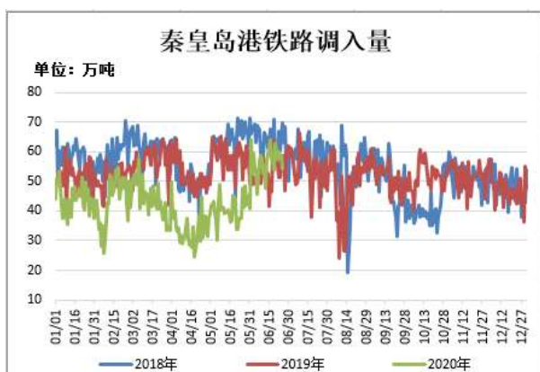
图11: 秦皇岛港铁路调入量

截止 6 月 24 日, 秦皇岛港铁路调入量为 54.4 万吨, 较前一周减 8.2 万吨。