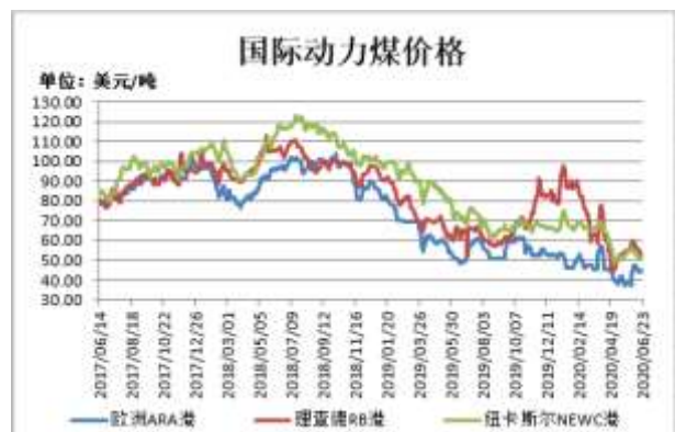
图2：国际动力煤现货价格

截止 6 月 23 日，欧洲 ARA 港动力煤现货价格报 44.75 美元/吨，较前一周涨 0.37 美元/吨；理查德 RB 动力煤现货价格报 52.5 美元/吨，较前一周跌 1.92 美元/吨；纽卡斯尔 NEWC 动力煤现货价格报 51.34 美元/吨，较前一周涨 0.84 美元/吨。