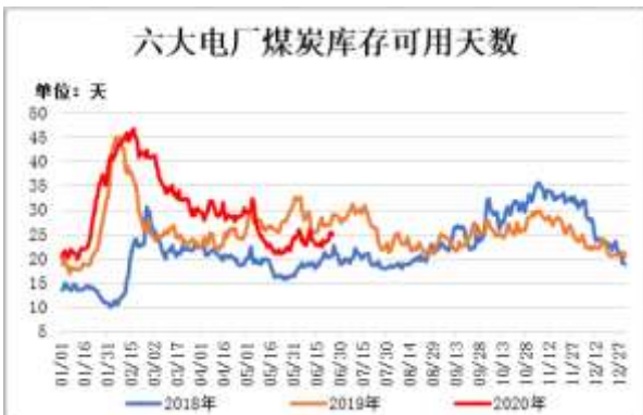
图9：六大电厂煤炭库存可用天数

截止6月24日，六大电厂煤炭库存可用天数 24.86 天，较前一周增加 1.54 天。