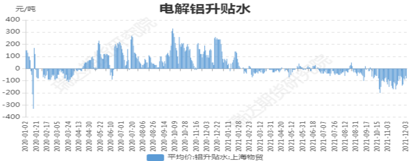
图2：电解铝升贴水走势图

截止至2021年12月3日，长江有色市场1#电解铝平均价为18900元/吨，沪铝期货价格为18975元/吨。