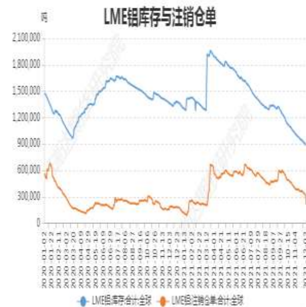
图9：LME铝库存与注销仓单

截止至2021年12月3日，上海期货交易所铝库存334934吨，环比上周增6247吨；截止至2021年12月2日，LME铝库存889575吨，环比上周减26275吨；注销仓单212350吨，环比上周减127175吨。