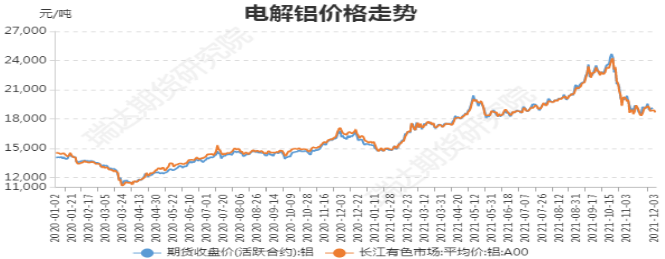
图1：电解铝期现价格

截止至2021年12月3日，长江有色市场1#电解铝平均价为18900元/吨，沪铝期货价格为18975元/吨。