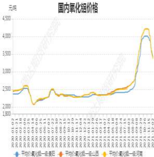
图3：国内氧化铝价格