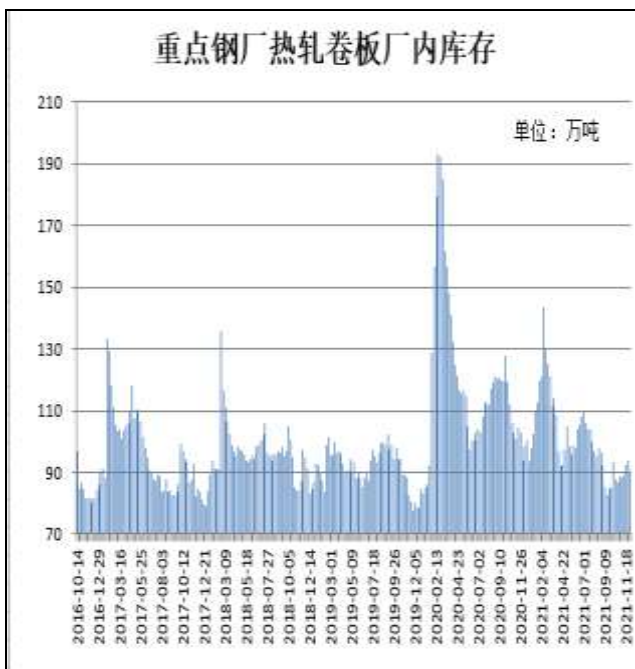
图9：样本钢厂热卷厂内库存

12月2日，据Mysteel监测的全国37家热轧板卷生产企业中热卷厂内库存量为90.2万吨，较上周减少3.32万吨，较去年同期减少3.35万吨。