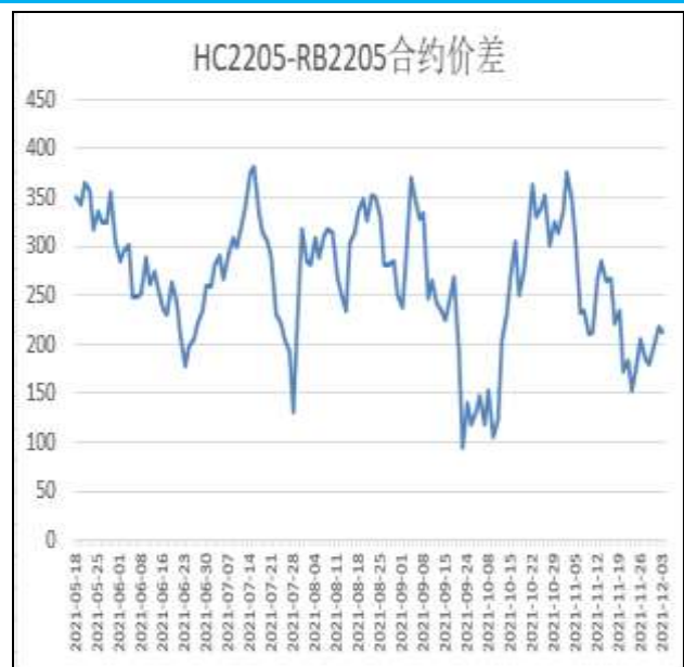
图6：热卷与螺纹跨品种套利

本周，HC2205合约走势强于RB2205合约，3日价差为212元/吨，周环比+7元/吨。当前卷螺5月合约价差或陷入150-300区间波动，可考虑在此区间进行操作。