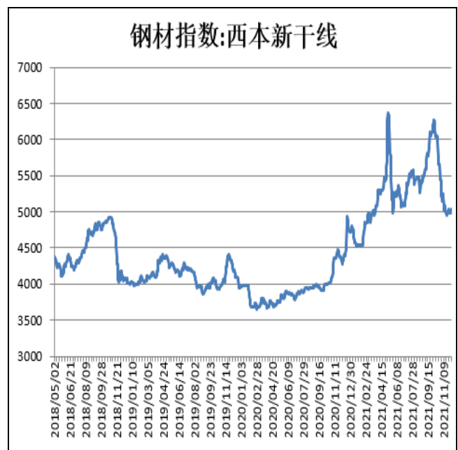
图2：西本新干线钢材价格指数

12月3日，上海热轧卷板5.75mm Q235现货报价为4800元/吨，周环比+20元/吨；全国均价为4806元/吨，周环比+2元/吨。