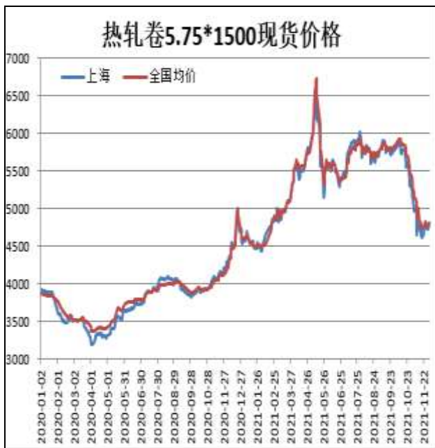
图1：热轧卷板现货价

12月3日，上海热轧卷板5.75mm Q235现货报价为4800元/吨，周环比+20元/吨；全国均价为4806元/吨，周环比+2元/吨。