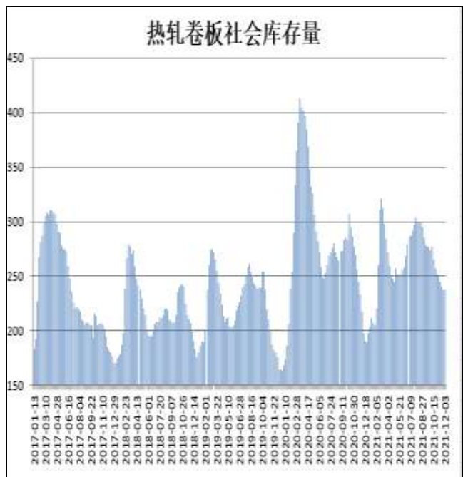
图10：全国33城热卷社会库存

12月2日，据Mysteel监测的全国33个主要城市社会库存为237.09万吨，较上周减少0.21万吨，较去年同期增加19.15万吨。