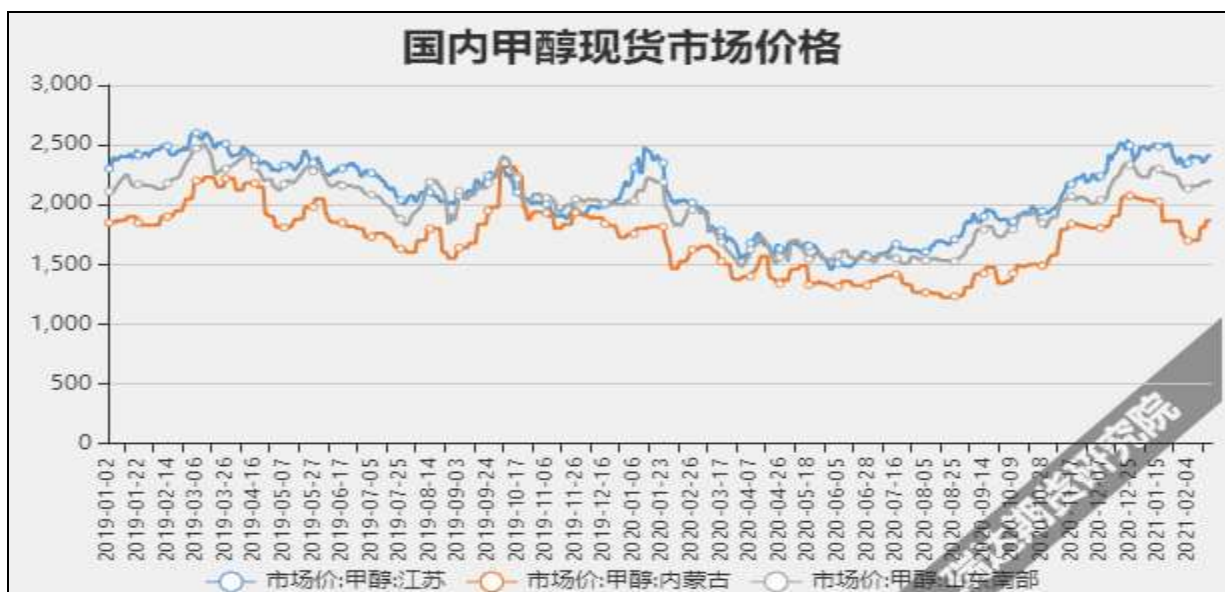
图3 甲醇现货市场主流价

截至3月11日，NYMEX天然气收盘价2.67美元/百万英热单位，较上周-0.07美元/百万英热单位。