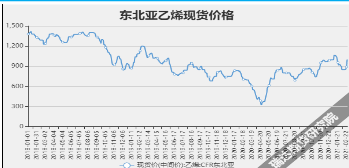
图13 东北亚乙烯现货价

截至3月10日当周, 内陆地区部分甲醇代表性企业库存量46.1万吨, 较上周-5.44万吨。