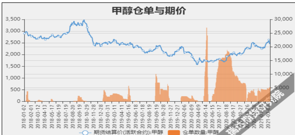
图7 甲醇期价与仓单数量