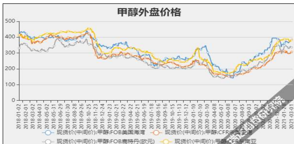
图5 外盘甲醇现货价格