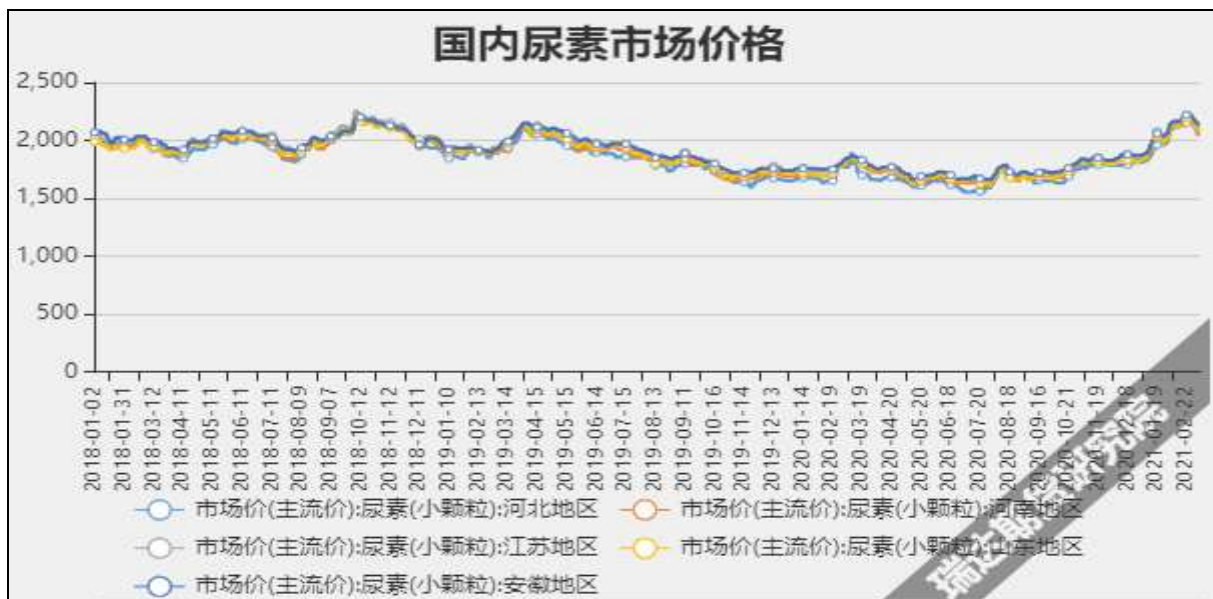
图3 国内尿素市场主流价

截至3月11日，NYMEX天然气收盘价2.67美元/百万英热单位，较上周-0.07美元/百万英热单位。