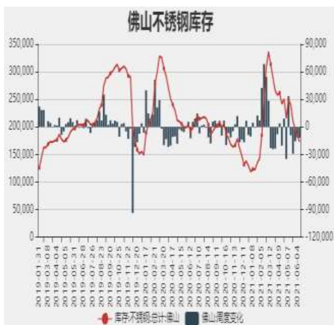
图5：佛山不锈钢月度库存