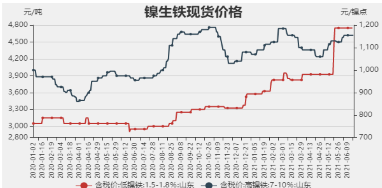
图1：镍生铁现货价格

截止至2021年6月18日，以山东地区为例，低镍铁(FeNi1.5-1.8)价格为4750元/吨，高镍生铁(FeNi7-10)价格为1155元/镍点。