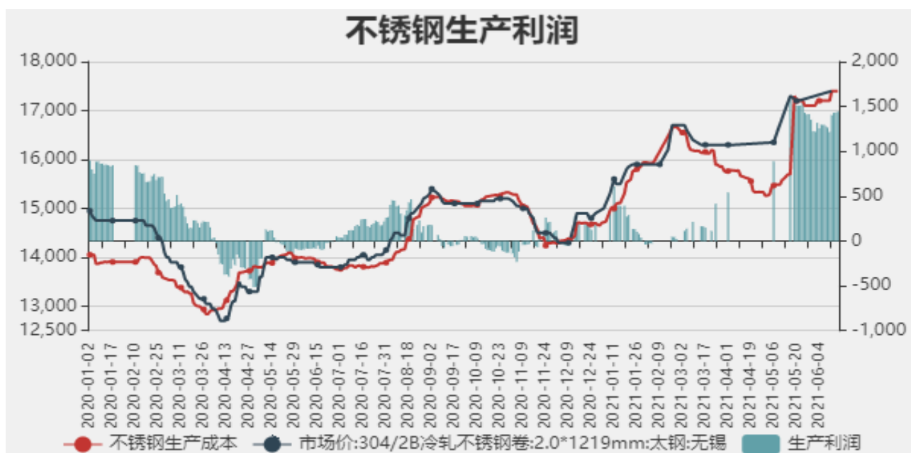
图9：不锈钢生产利润