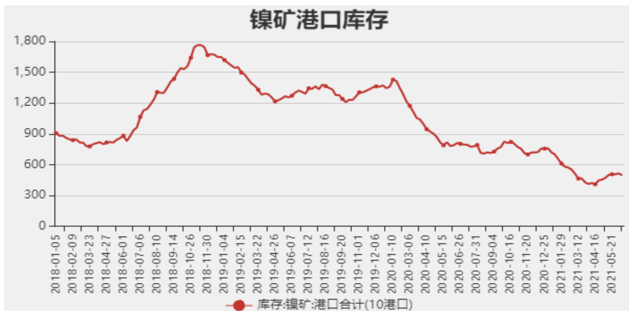
图3：国内镍矿港口库存