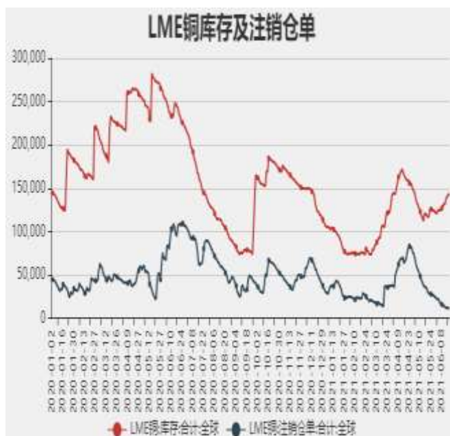
图7: LME铜库存及注销仓单