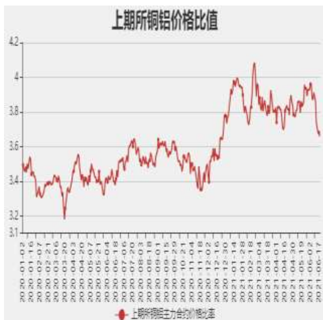
图9: 沪铜和沪铝主力合约价格比率