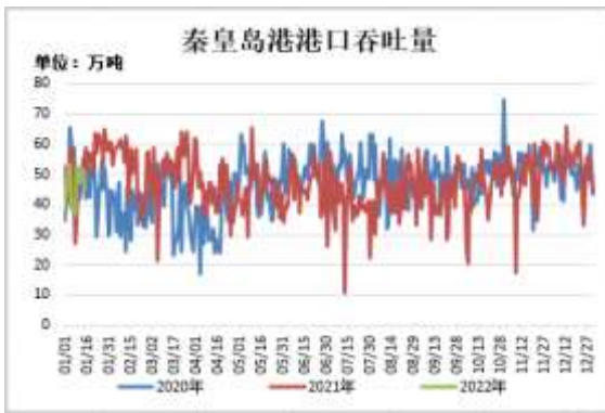
图9：秦皇岛港港口吞吐量

截止 1 月 14 日，秦皇岛港港口吞吐量 45 万吨，较前一周增加 4.2 万吨。