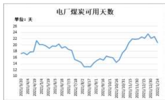
图14：电厂煤炭库存可用天数

截止 1 月 14 日，Mysteel 数据：全国电厂样本区域煤炭可用天数 20.74 天，较前一周减少 1.95 天。