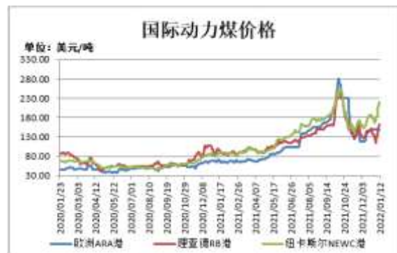
图2: 国际动力煤现货价格

截止 1 月 12 日,欧洲 ARA 港动力煤现货价格报 147.83 美元/吨,较前一周跌 1.5 美元/吨;理查德 RB 动力煤现货价格报 162.72 美元/吨,较前一周涨 31.42 美元/吨;纽卡斯尔 NEWC 动力煤现货价格报 215.43 美元/吨,较前一周涨 31.86 美元/吨。