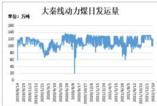
图11：大秦线动力煤日发运量

截止 1 月 10 日，大秦铁路动力煤日发运量 116.23 万吨，较前一周减少 6.03 万吨。