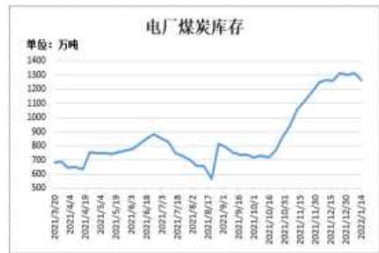
图12：电厂煤炭库存量

截止 1 月 14 日，Mysteel 数据：全国电厂样本区域煤炭库存 1266.85 万吨，较前一周减少 48.2 万吨。