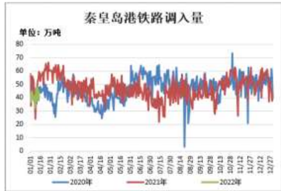
图8：秦皇岛港铁路调入量

截止 1 月 14 日，秦皇岛港铁路调入量为 40 万吨，较前一周减少 0.8 万吨。