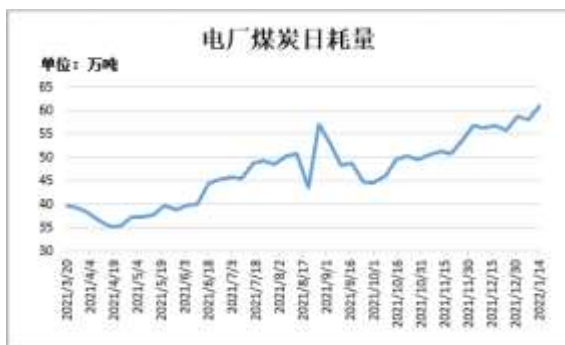
图13：电厂煤炭日耗量

截止 1 月 14 日，Mysteel 数据：全国电厂样本区域煤炭日耗量 61.07 万吨，较前一周增加 3.11 万吨。