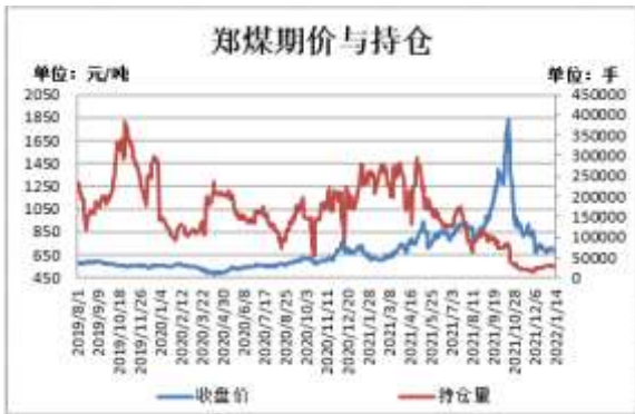
图3：郑煤期货价格与持仓量

截止 1 月 14 日，郑煤期货主力合约收盘价 692.4 元/吨，较前一周跌 20.8 元/吨；郑煤期货主力合约持仓量 27976 手，较前一周减少 398 手。