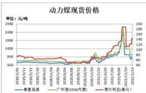
图1: 动力煤现货价格

截止 1 月 14 日,秦皇岛港山西(Q5500,S0.6,MT8)平仓含税价报 950 元/吨,较上周涨 100 元/吨;广州港内蒙混煤 Q5500, V24, S0.5 港提含税价 1090 元/吨,较上周涨 10 元/吨;澳大利亚动力煤(Q5500,A<22,V>25,S<1,MT10)CFR(不含税)报 144 美元/吨,较前一周涨 23 美元/吨。