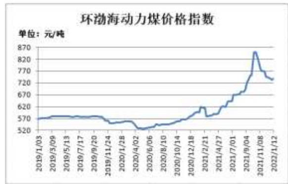
图4：环渤海动力煤价格指数

截止 1 月 12 日，环渤海动力煤价格指数报 738 元/吨，较上一期涨 5 元/吨。