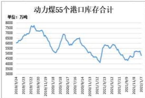
图7：动力煤55个港口库存

截至 1 月 7 日，动力煤 55 个港口库存合计 4823.7 万吨，较上一周减少 250.4 万吨。