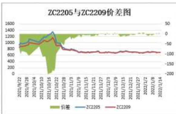
图5：郑煤期货跨期价差

截止 1 月 14 日，期货 ZC2205 与 ZC2209（远月-近月）价差为-0.2 元/吨，较前一周涨 7 元/吨。