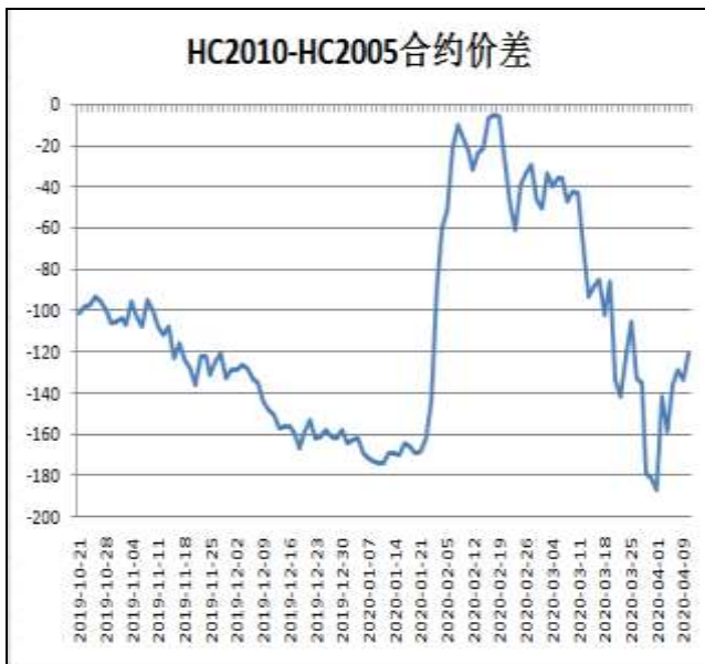
图6：螺纹与热卷跨品种套利

本周，HC2010合约走势强于HC2005合约，10日价差为-121元/吨，较上周五+38元/吨。