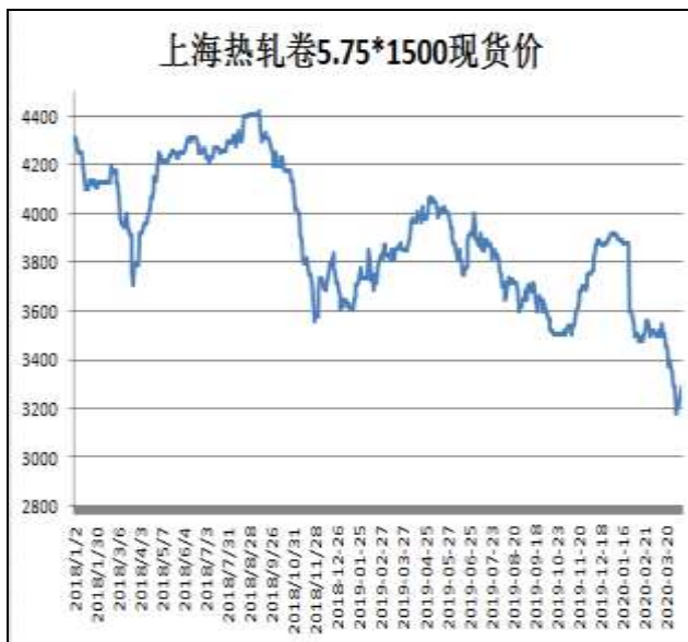
图1：热轧卷板现货价

4月10日，上海热轧卷板5.75mm Q235现货报价为3300元/吨，较上周五涨100元/吨。