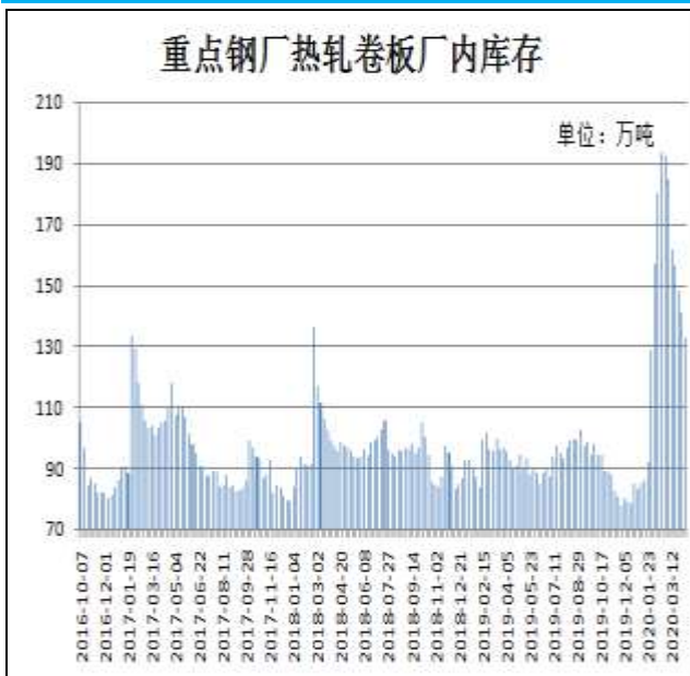
图9：样本钢厂热卷厂内库存

4月9日，据Mysteel监测的全国37家热轧板卷生产企业中钢厂厂内库存量为132.47万吨，较上周减少8.39万吨，较去年同期增加39.8万吨。