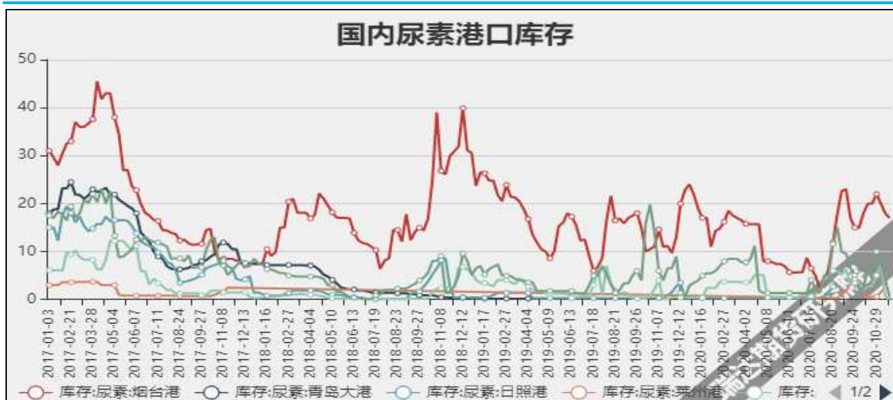
图9 国内尿素港口库存