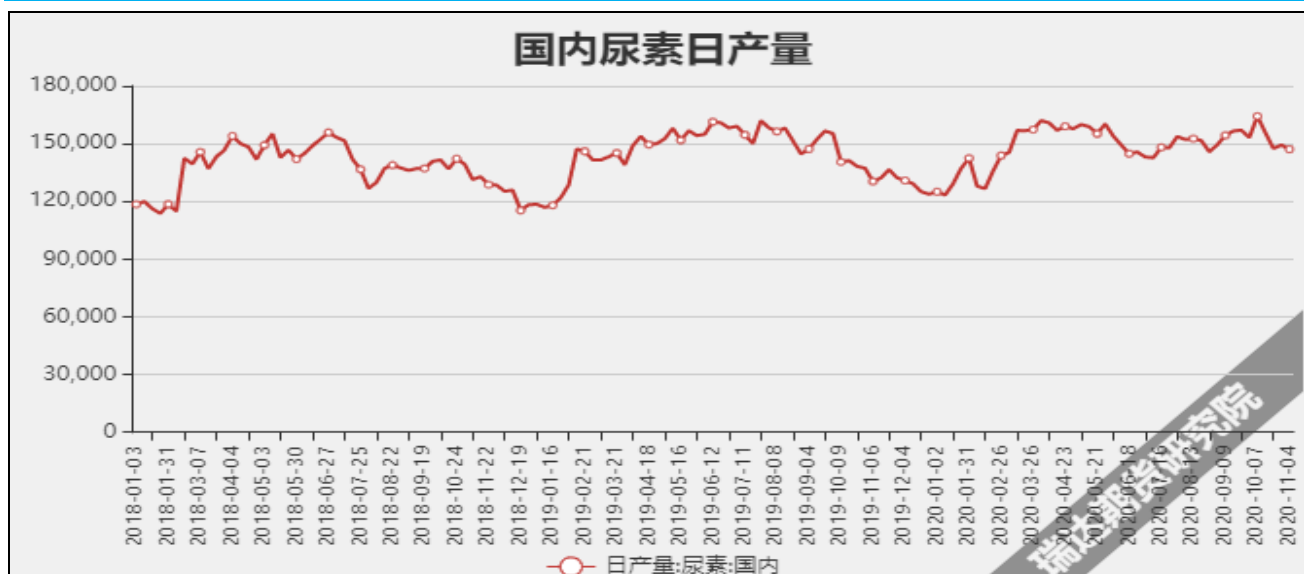
图7 国内尿素日产量