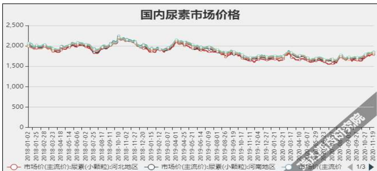
图3 国内尿素市场主流价

截至12月17日，NYMEX天然气收盘价2.65美元/百万英热单位，较上周+0.08美元/百万英热单位。