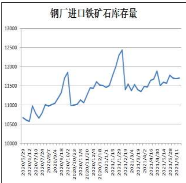
图10：钢厂铁矿石库存量

18日据Mysteel统计样本钢厂进口铁矿石库存总量11707.09万吨，环比增加15.99万吨；当前样本钢厂的进口矿日耗为300.63万吨，环比减少0.45万吨。