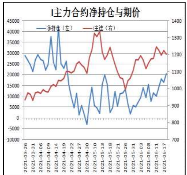
图14：铁矿主力合约前20名净持仓

I2109合约前20名净持仓情况，11日为净多10033手，18日为净多20442手，净多增加10409手，由于主流持仓多单增幅大于空单。