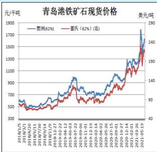
图1：铁矿石现货价格走势