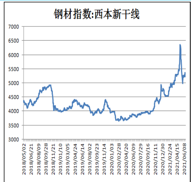
图2：西本新干线钢材价格指数