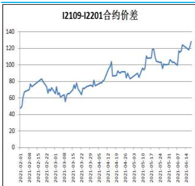
图5：铁矿石跨期套利

本周，I2109合约走势强于I2201合约，18日价差为128元/吨，周环比+4元/吨。