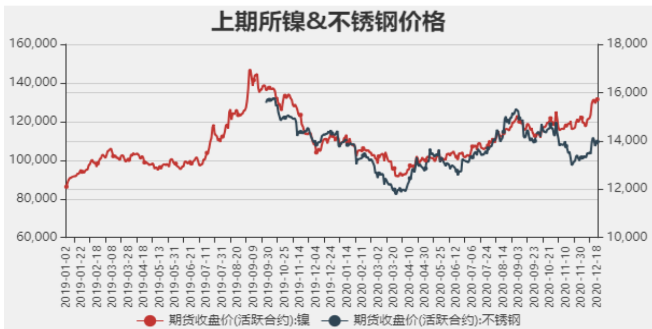
图2：国内镍现货价格

截止至2020年12月18日，沪镍期货价格为131530元/吨，不锈钢期货价格为13965元/吨。