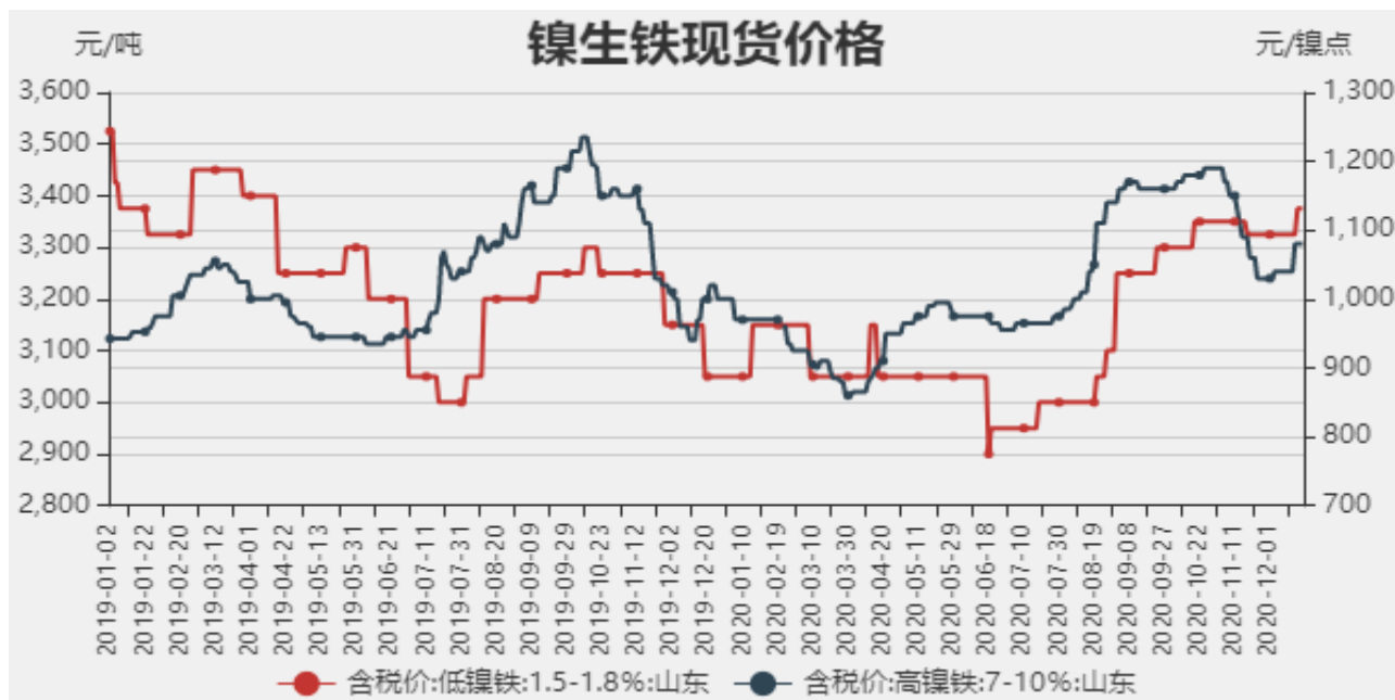
图1：镍生铁现货价格

截止至2020年12月18日，以山东地区为例，低镍铁（FeNi1.5-1.8）价格为3375元/吨，较上周上涨50元/吨，高镍生铁（FeNi7-10）价格为1080元/镍点，较上周上涨40元/镍点。