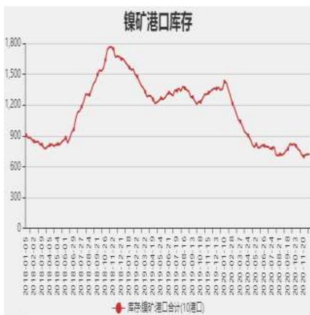
图3：国内镍矿港口库存