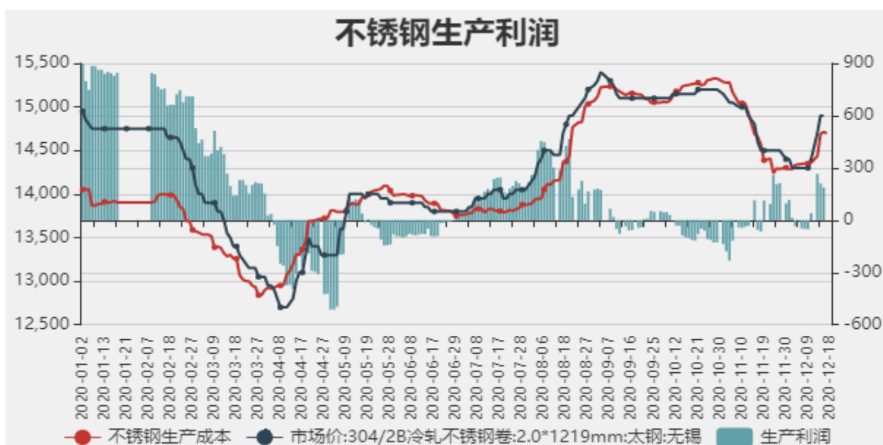
图10：不锈钢生产利润