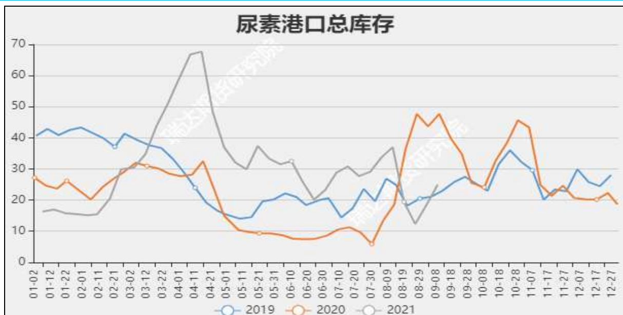
图9 国内尿素港口库存