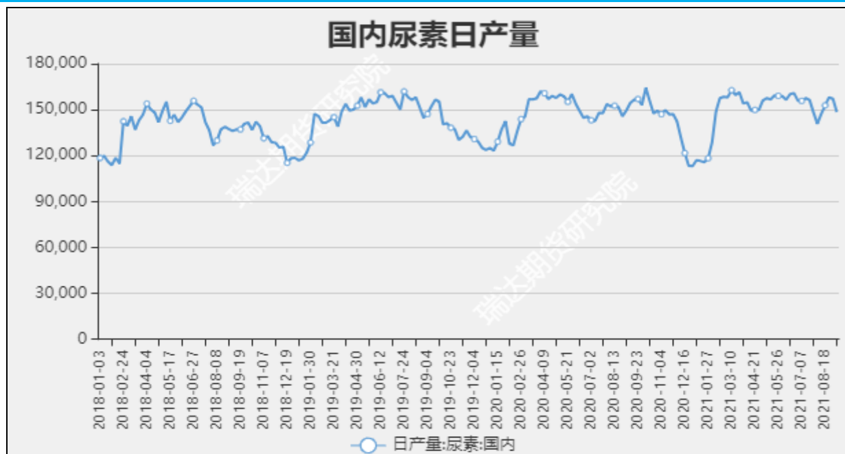
图7 国内尿素日产量