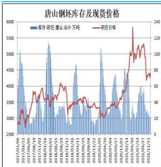
图11：唐山钢坯库存量

1月13日，唐山钢坯库存量为14.67万吨，较上周减少3.97万吨，钢坯现货报价4430万吨。