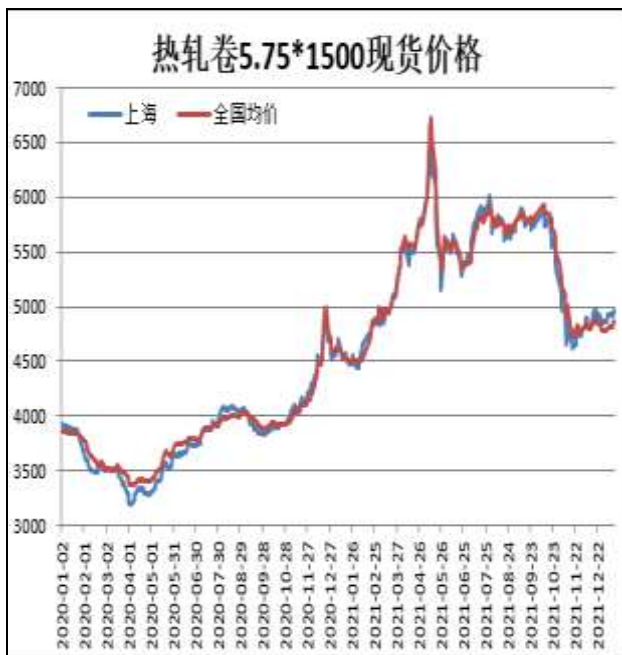
图1：热轧卷板现货价

1月14日，上海热轧卷板5.75mm Q235现货报价为4940元/吨，周环比+10元/吨；全国均价为4864元/吨，周环比+47元/吨。