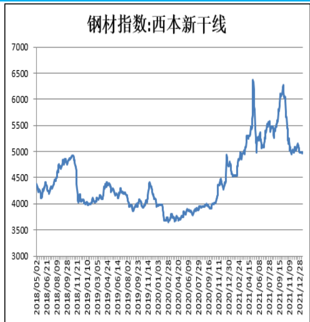
图2：西本新干线钢材价格指数

1月14日，上海热轧卷板5.75mm Q235现货报价为4940元/吨，周环比+10元/吨；全国均价为4864元/吨，周环比+47元/吨。