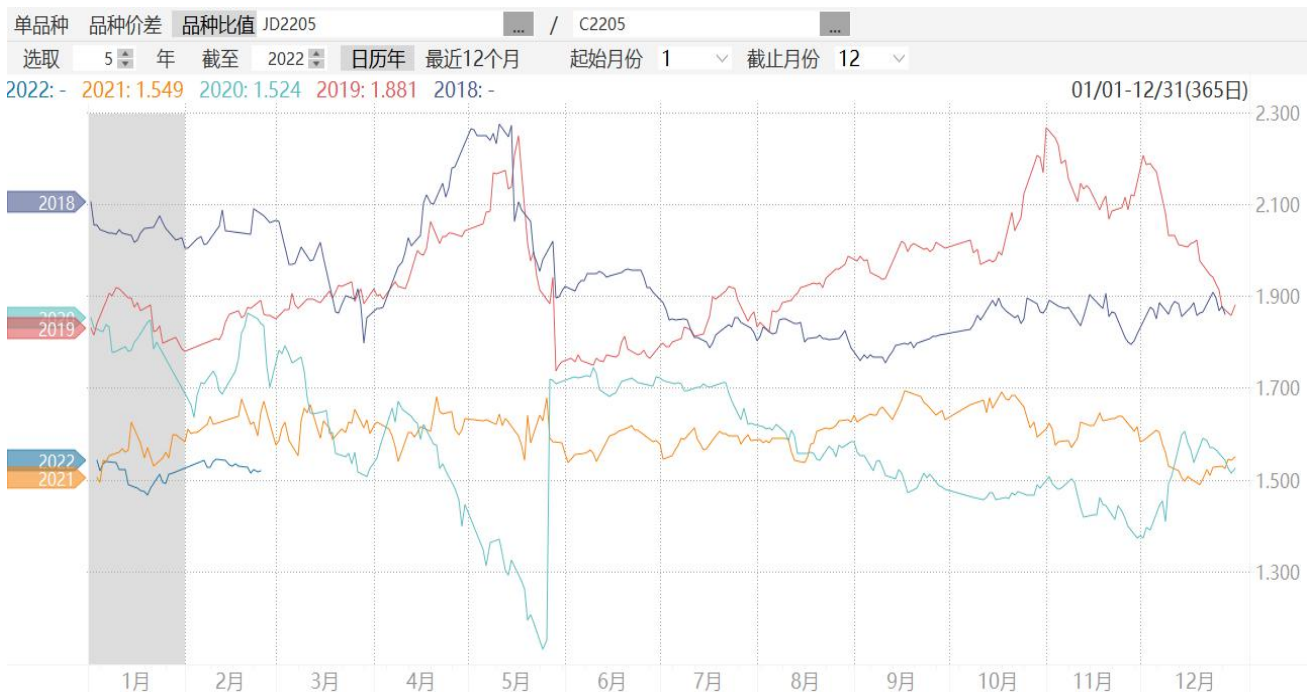
图9：鸡蛋2205合约与玉米2205合约期价比值走势图