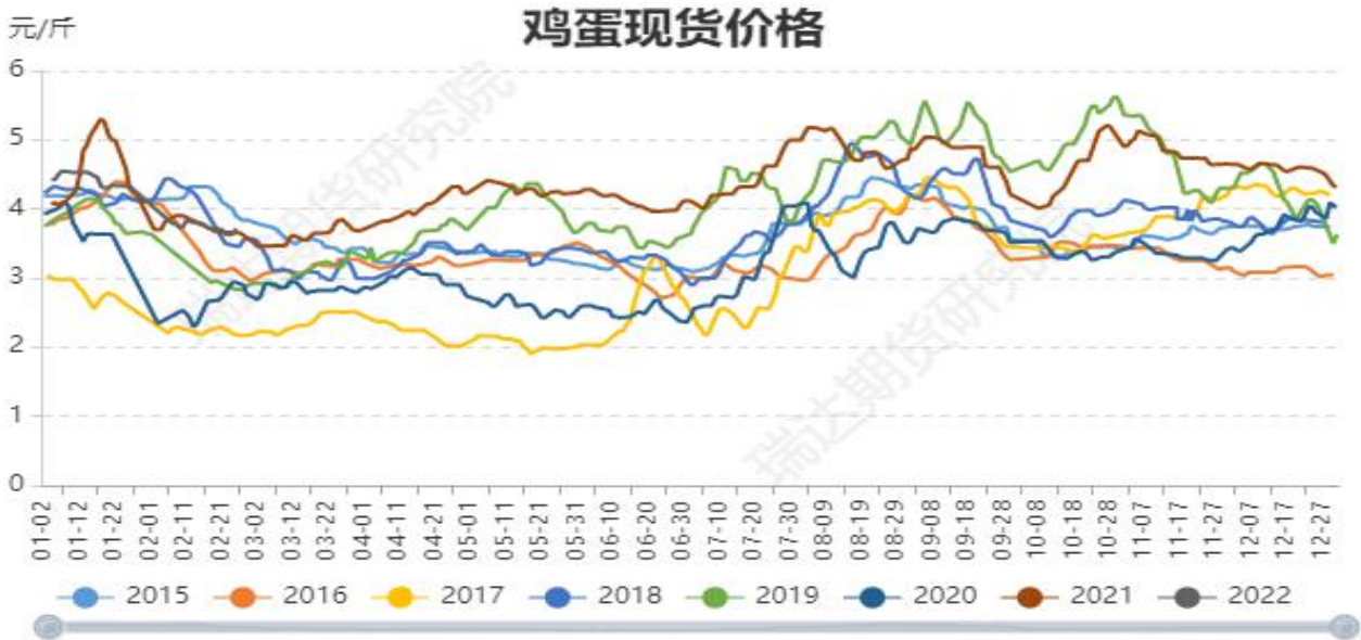
图4： 全国鸡蛋现货均价季节性走势图