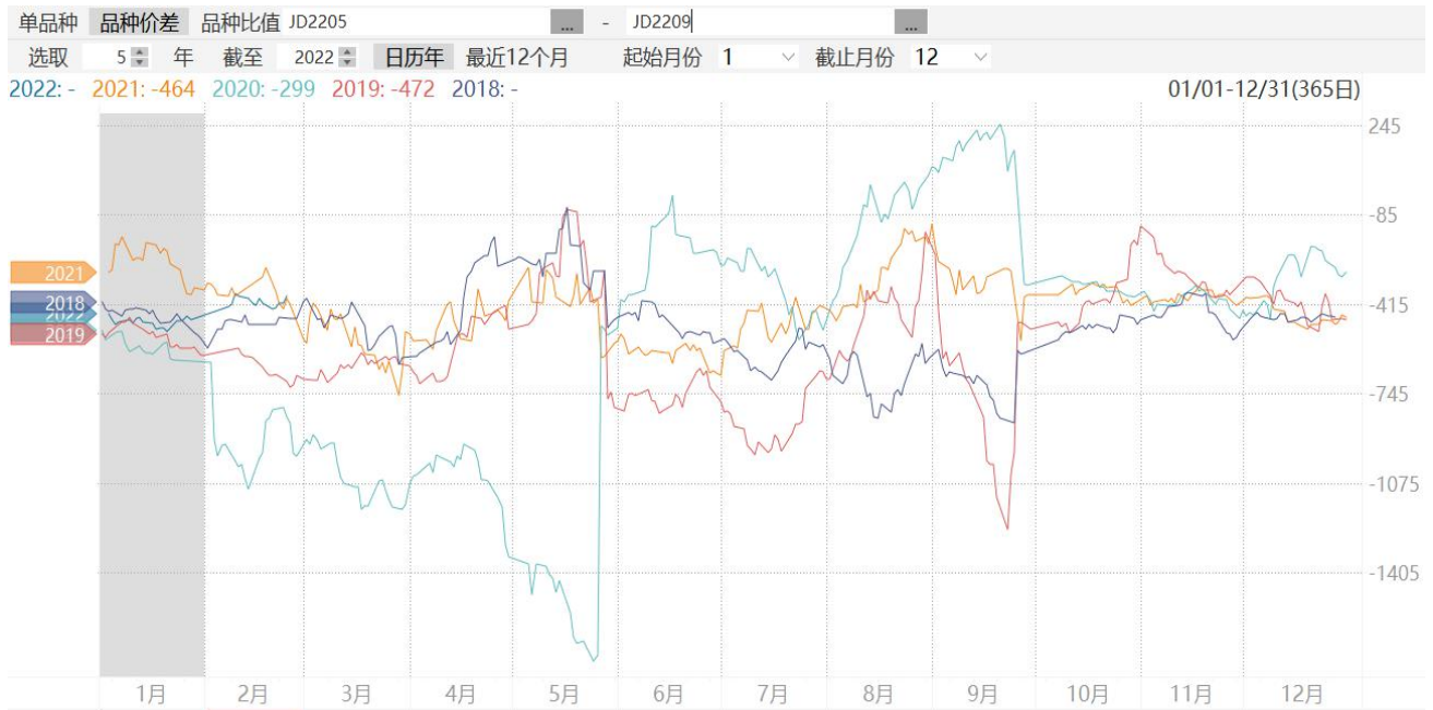
图8：鸡蛋2205合约与2209合约期价价差走势图