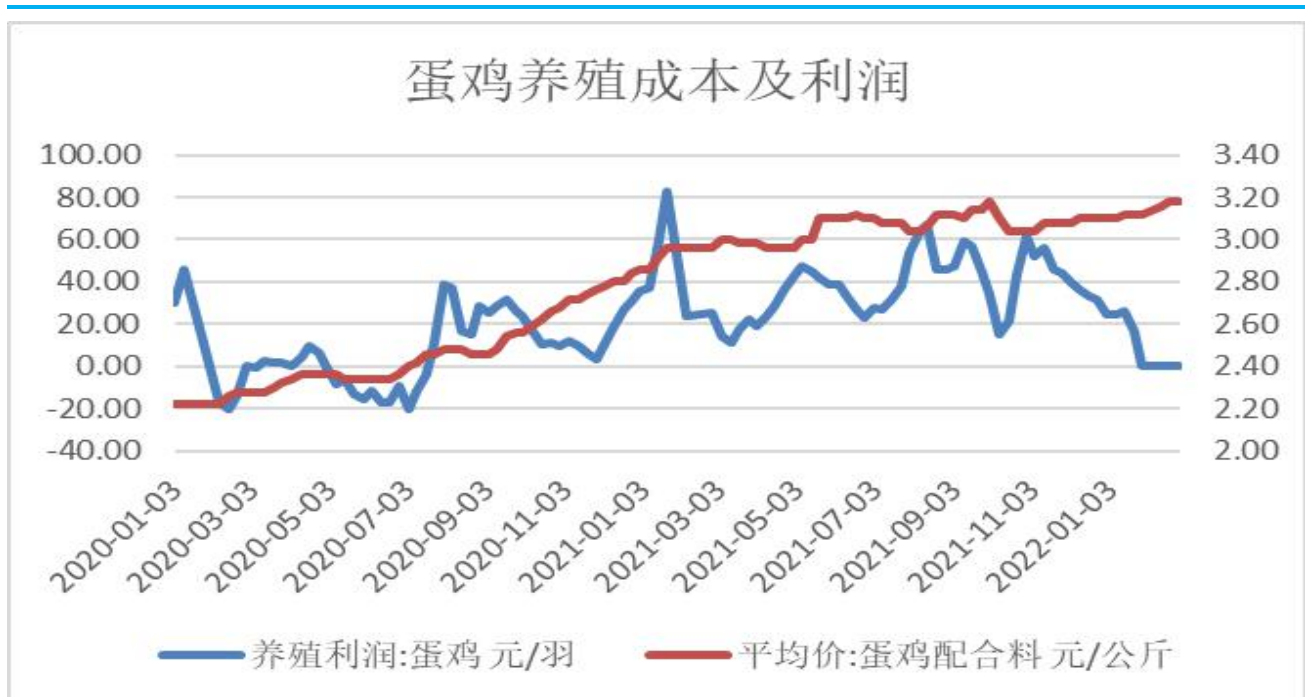
图3：蛋鸡养殖利润变化图

3、截止2月25日，蛋鸡养殖利润报-0.30元/羽，较上周-0.07元/羽；蛋鸡配合料价格报3.18元/公斤。