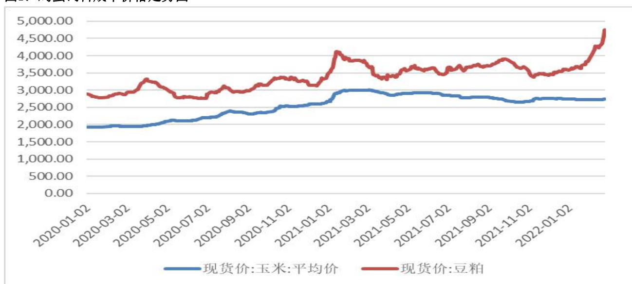
图1：鸡蛋饲料成本价格走势图

1、截至2月25日，蛋鸡饲料玉米现货2742.16元/吨，周环比+13.73元/吨，豆粕成交均价4758.29元/吨，环比+455.43元/吨。