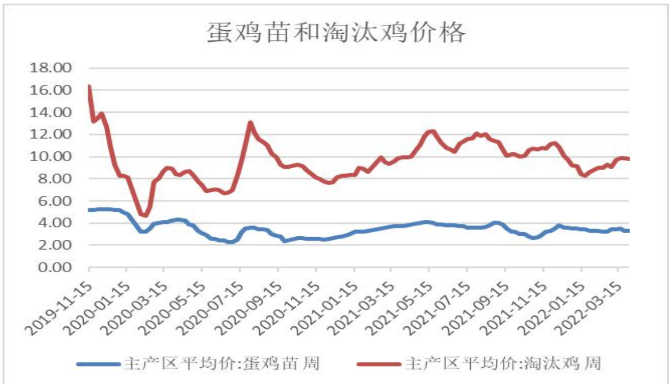
图2：淘汰鸡和蛋鸡苗主产区均价图

2、截至4月1日，蛋鸡苗3.30元/羽，周度-0.00元/羽，淘汰鸡9.80公斤，周度-0.06元/公斤。