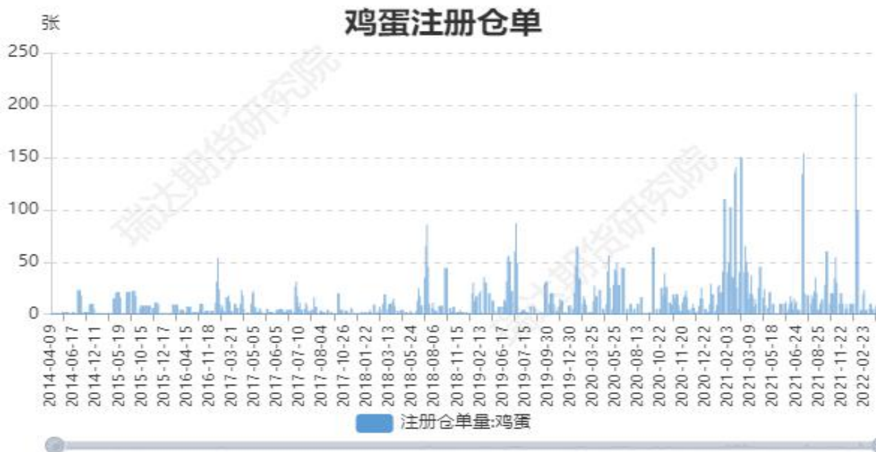
图5：大商所鸡蛋期货注册仓单量