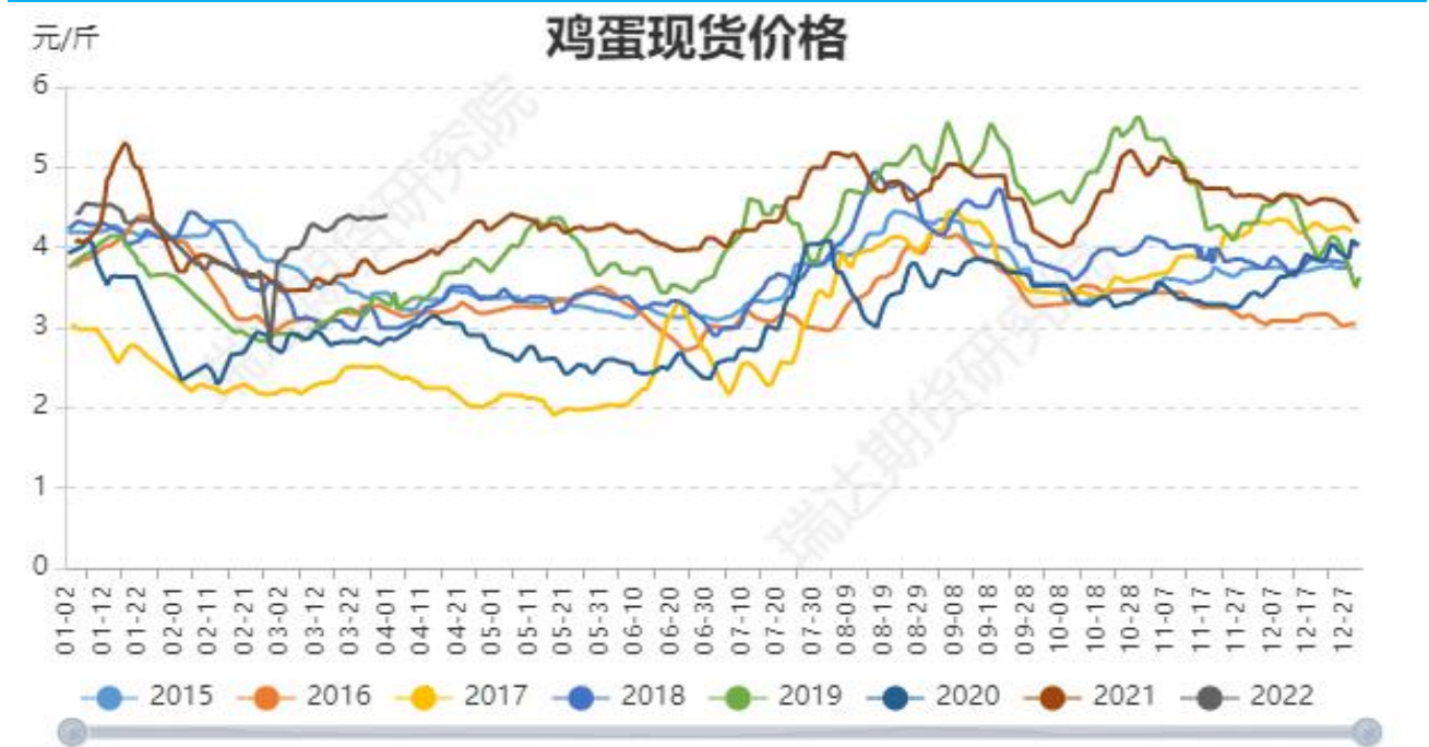
图4：全国鸡蛋现货均价季节性走势图