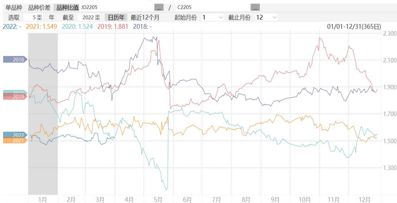
图9：鸡蛋2205合约与玉米2205合约期价比值走势图