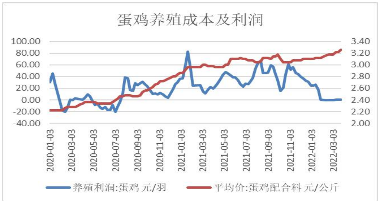
图3：蛋鸡养殖利润变化图

3、截止4月1日，蛋鸡养殖利润报+0.14元/羽，较上周+0.00元/羽；蛋鸡配合料价格报3.26元/公斤。