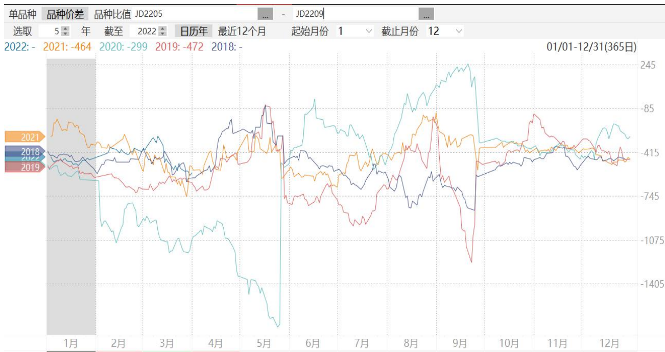
图8：鸡蛋2205合约与2209合约期价价差走势图

8、截至周五，鸡蛋2205合约与2209合约价差报-574元/500千克,处于同期较高水平。