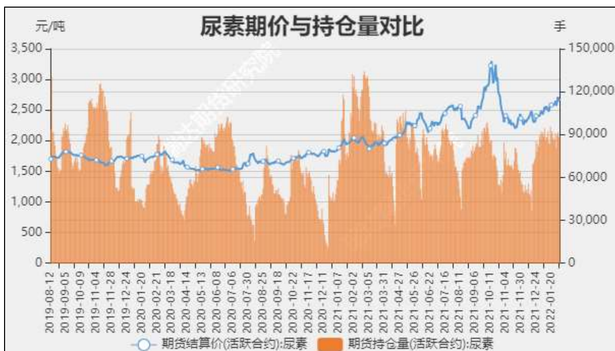
图6 尿素期货持仓量