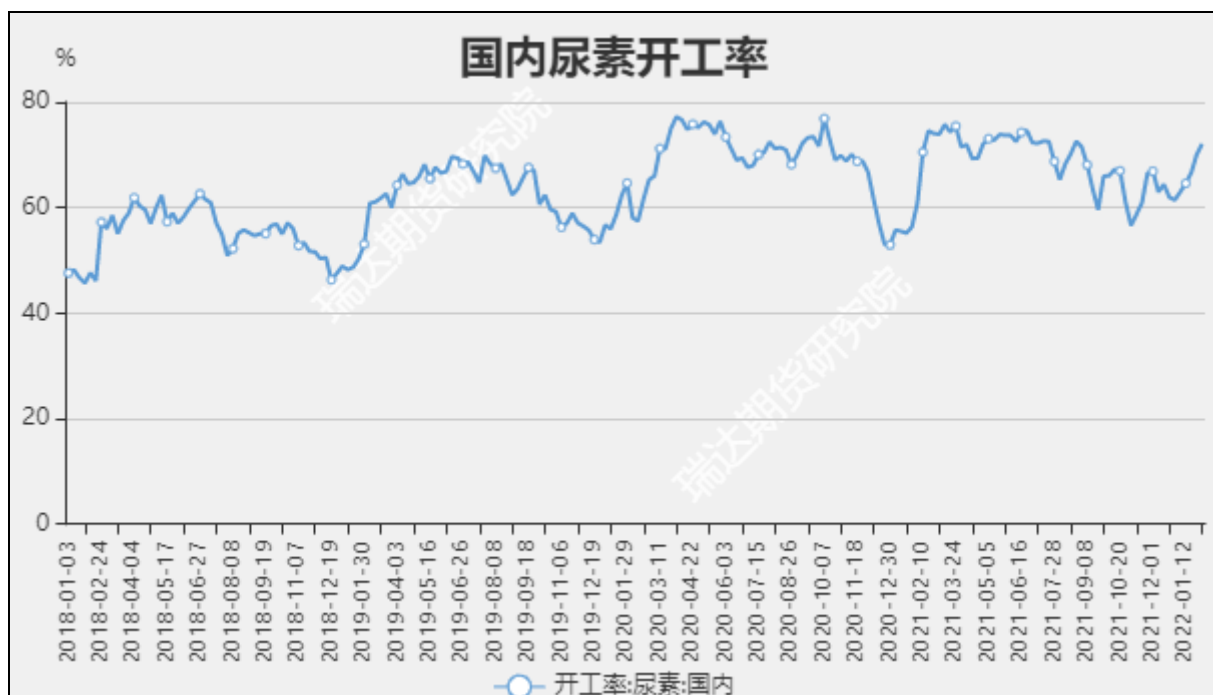
图8 国内尿素开工率