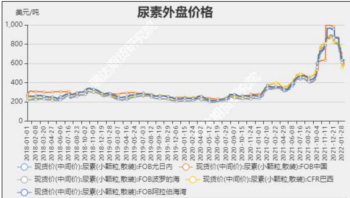
图4 尿素外盘现货价