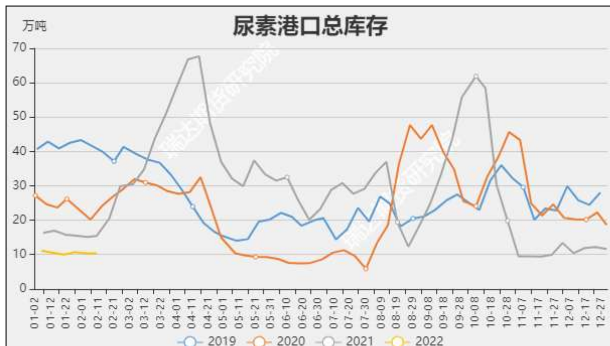
图9 国内尿素港口库存