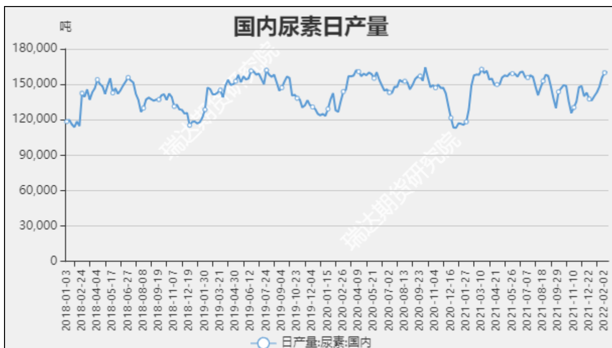
图7 国内尿素日产量