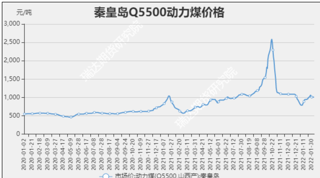
图1 秦皇岛动力煤市场价