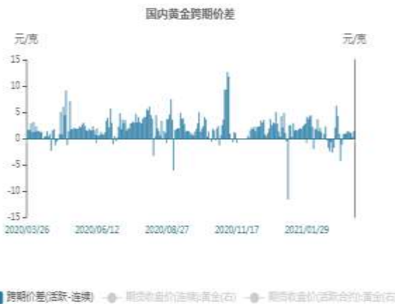
图9：国内黄金跨期价差走势图