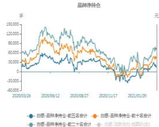
图2：沪银期货净持仓走势图