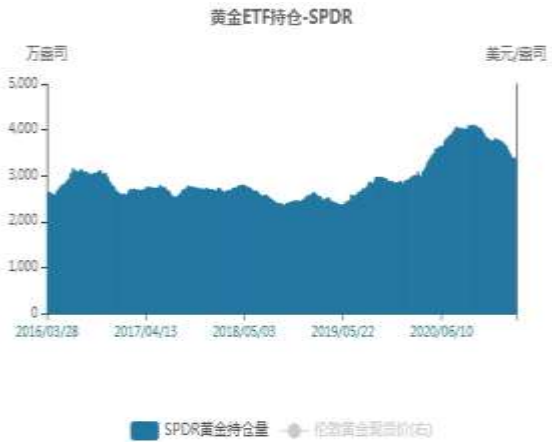
图5：黄金ETF持仓走势图