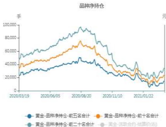
图1：沪金期货净持仓走势图