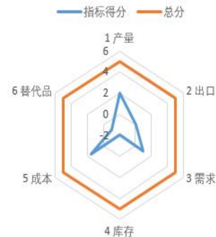
苹果影响因素分析