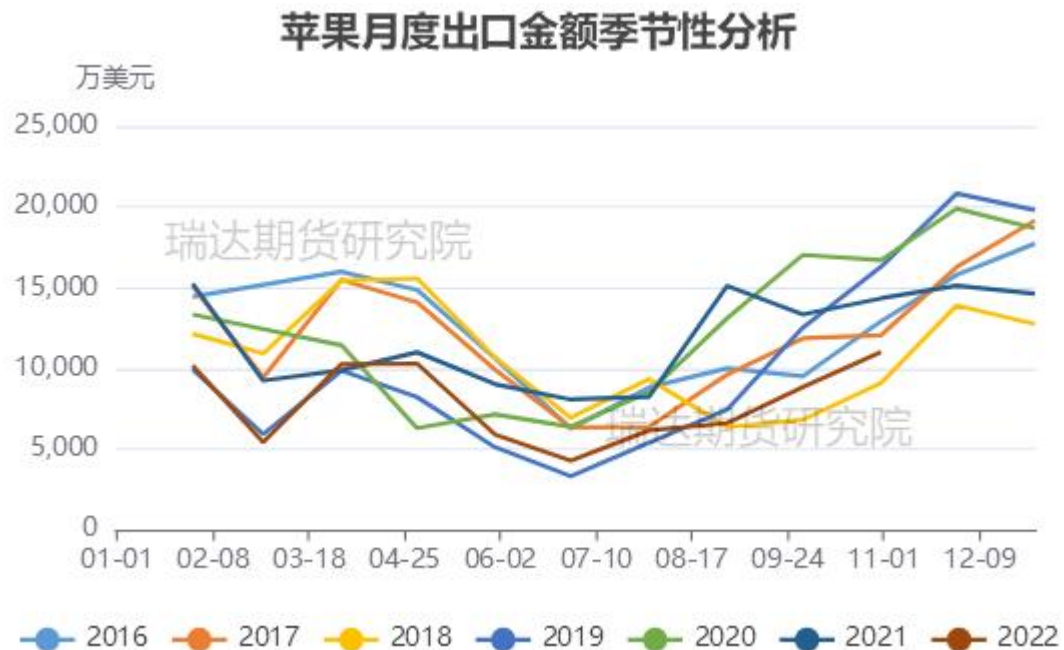
图、苹果出口金额季节性走势