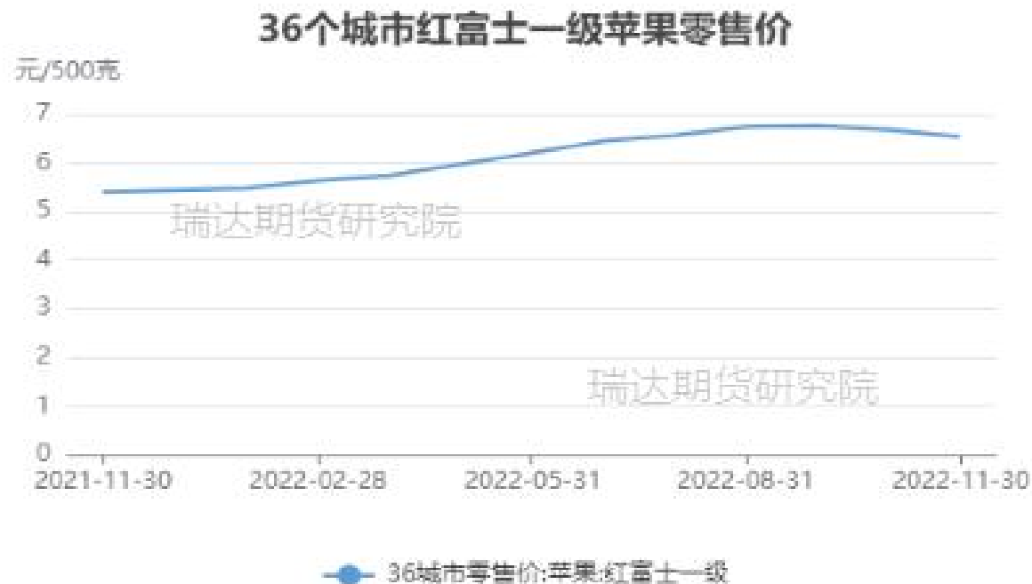
图、36个城市富士苹果零售价格走势