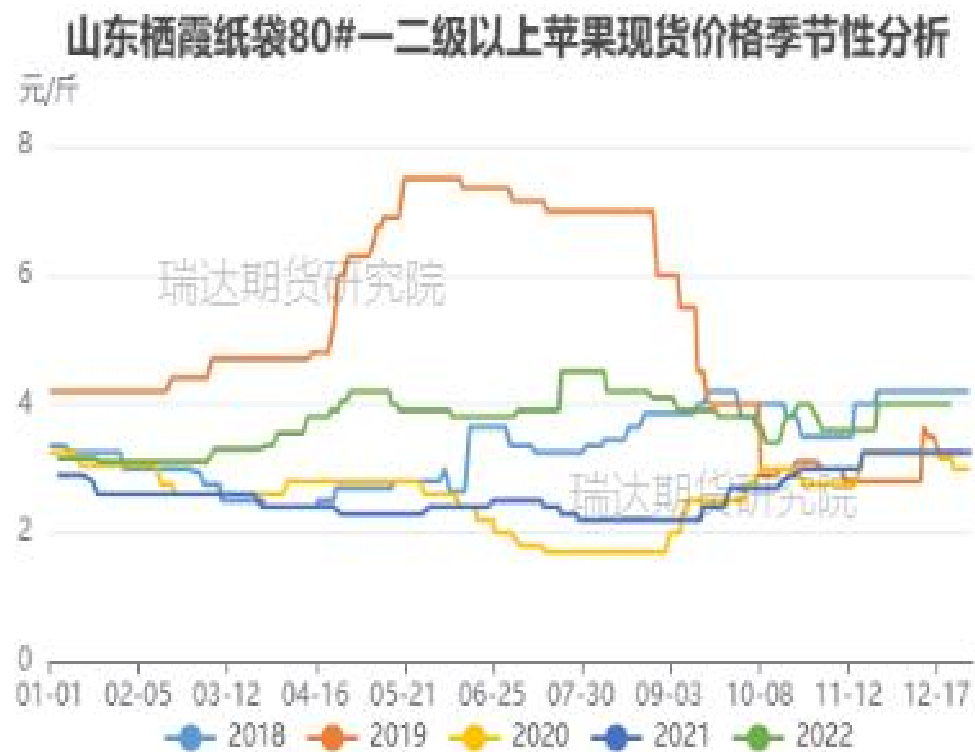
图、山东栖霞80#一二级苹果现货价格季节性走势