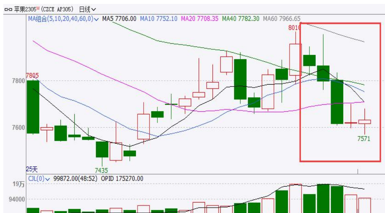
图、苹果主力合约价格走势