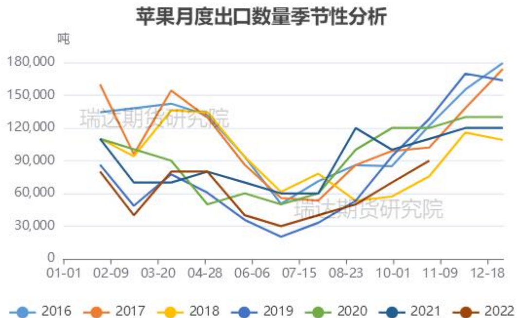
图、苹果出口量季节性情况