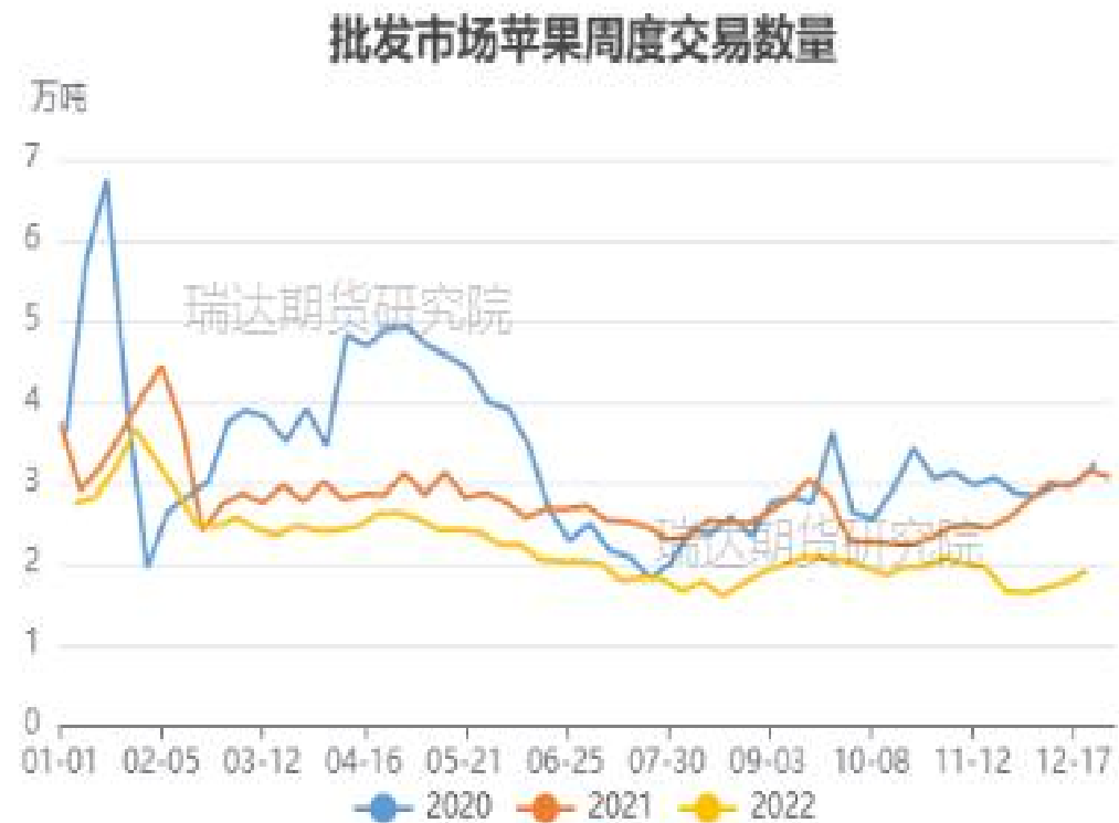
图、苹果批发市场走货情况