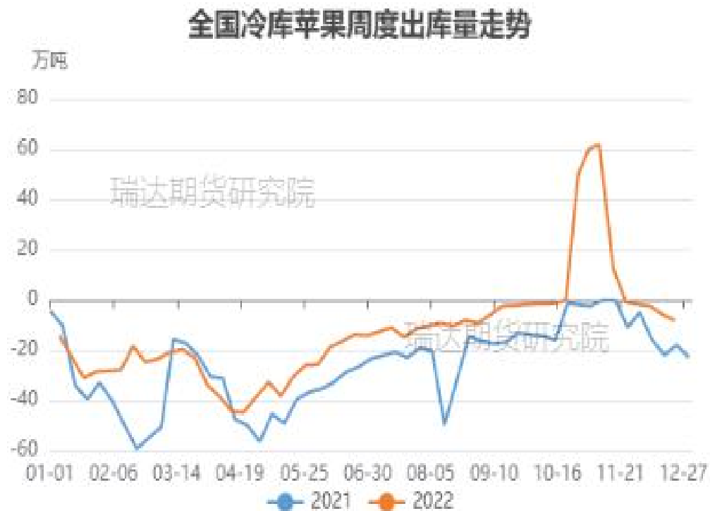
图、全国苹果冷库出库走势