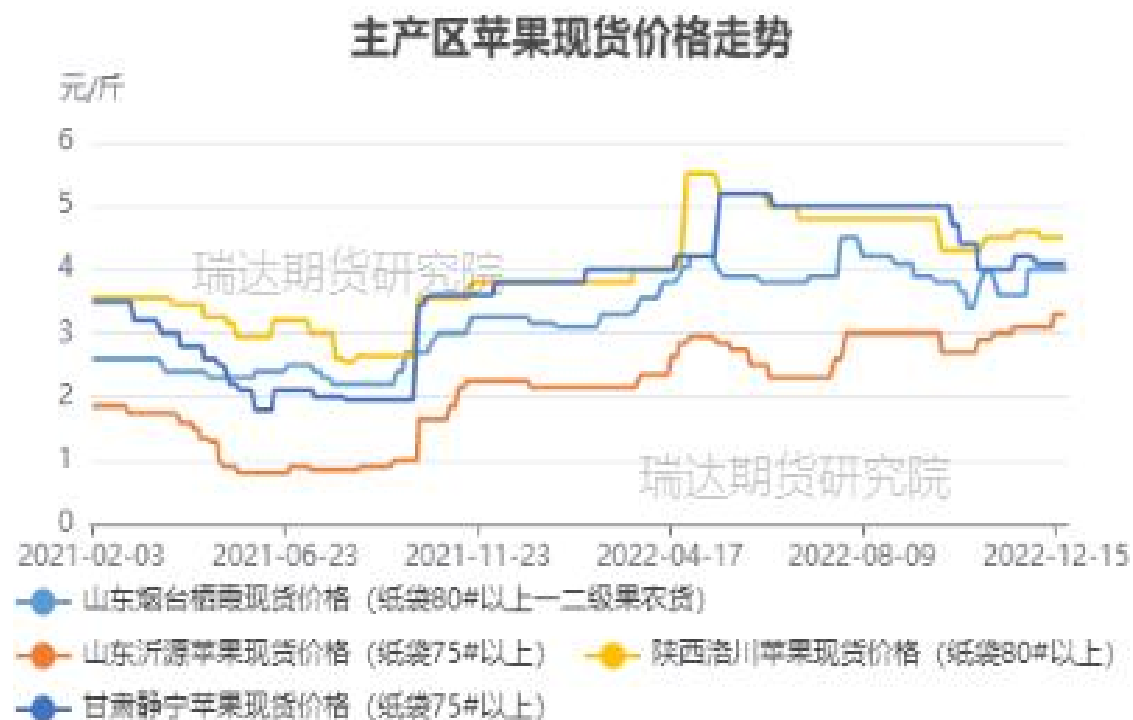
图、主产区苹果现货价格走势