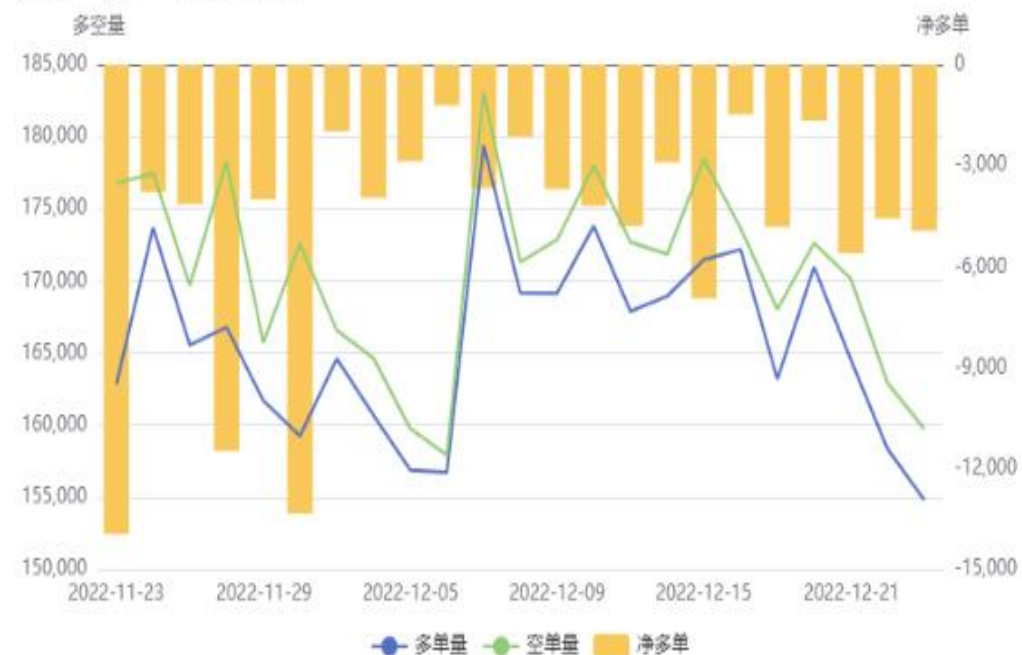
苹果(AP)前20持仓量变化