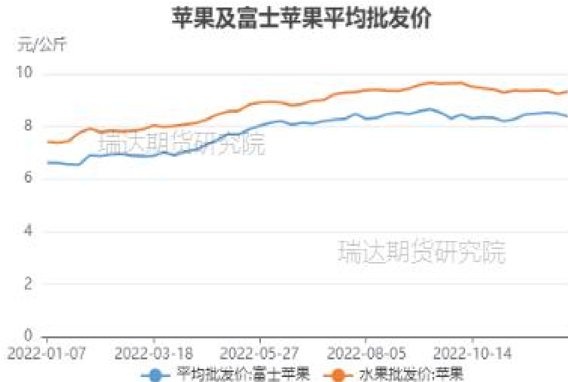
图、全品种苹果及富士苹果批发价格