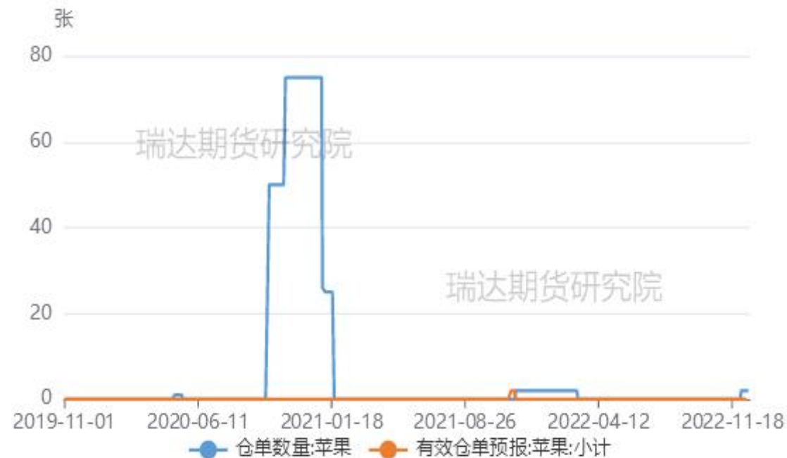
郑商所苹果仓单及有效预报