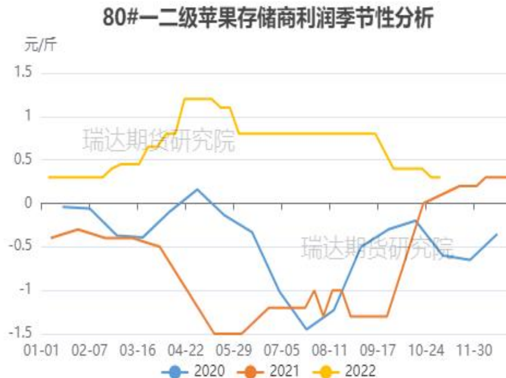
图、80#一二级富士存储商利润走势