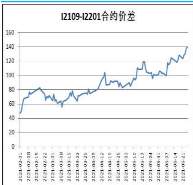
图5：铁矿石跨期套利

本周，I2109合约走势强于I2201合约，25日价差为139元/吨，周环比+11元/吨。