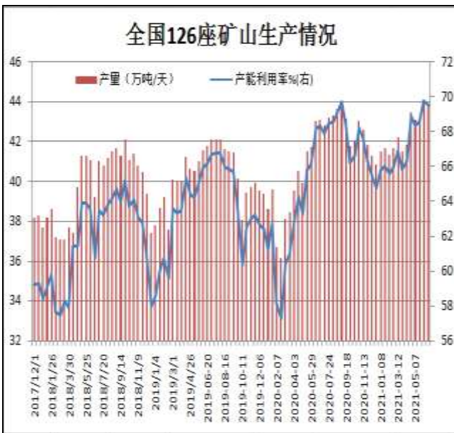
图13: 全国126座矿山产能利用率

据Mysteel统计，截止6月18日全国126矿山样本产能利用率为69.52%，环比上期调研降0.27%；库存71.28万吨，减少6.17万吨。