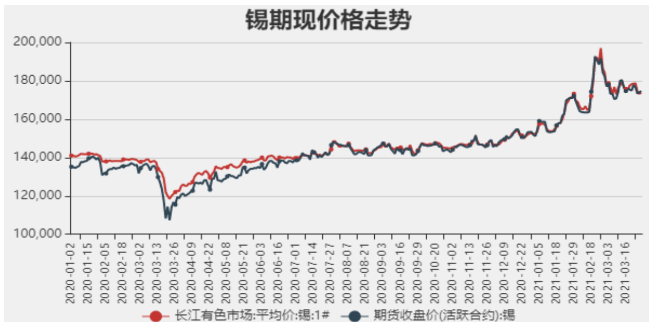
图1：国内锡现货价格

截止至2021年3月26日，长江有色金属市场1#锡平均价为173750元/吨，沪锡期货价格为174660元/吨。