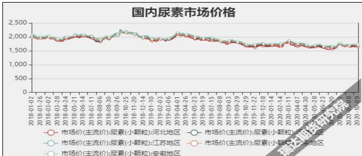
图3 国内尿素市场主流价

截至10月8日, NYMEX天然气收盘价2.63美元/百万英热单位, 较上周+0.45美元/百万英热单位。