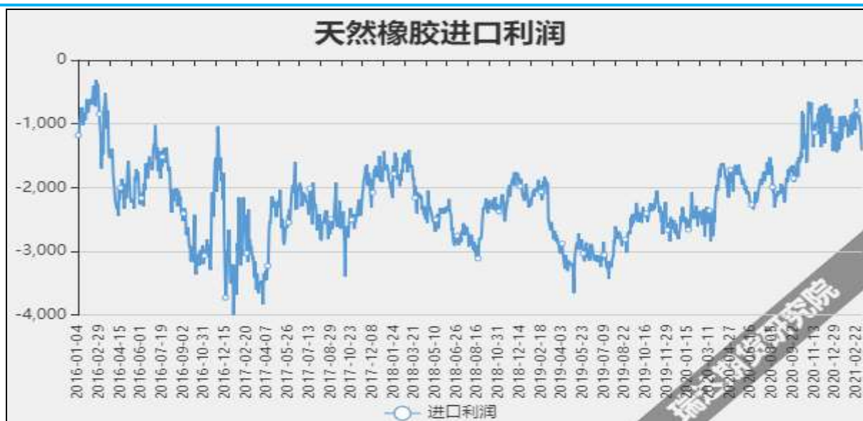
图14 天然橡胶进口利润

截至3月25日，烟片胶加工利润197.77美元/吨，较上周+15美元/吨；标胶加工利润为24.02美元/吨，较上周-19美元/吨。