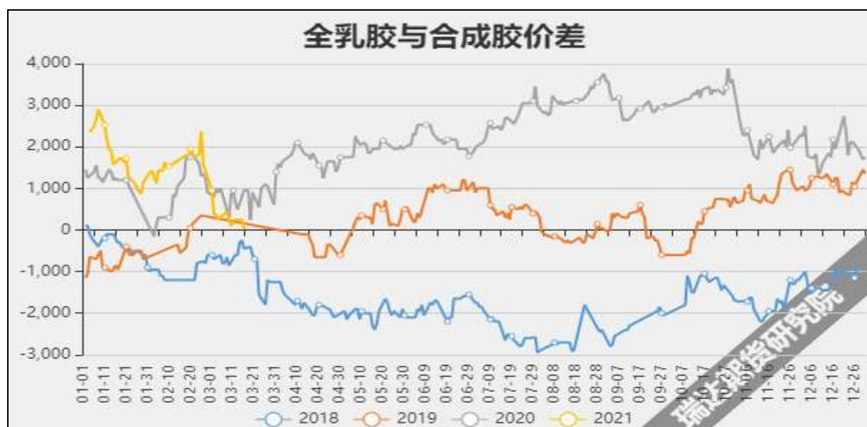
图10 全乳胶与合成胶价差

截至3月25日, 华东市场丁苯橡胶14400元/吨, 较上周+0元/吨; 华北市场顺丁橡胶报13620元/吨, 较上周+0元/吨。