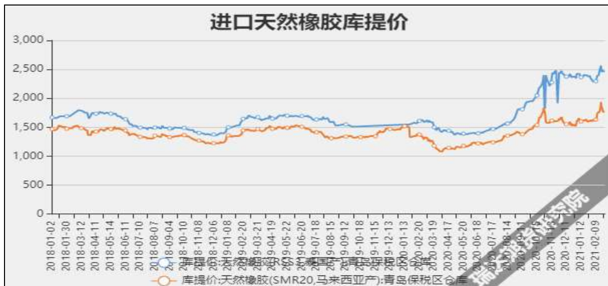
图3 进口天然橡胶库提价

截至3月26日，上海市场19年国营全乳胶报13475元/吨，较上周-625元/吨。