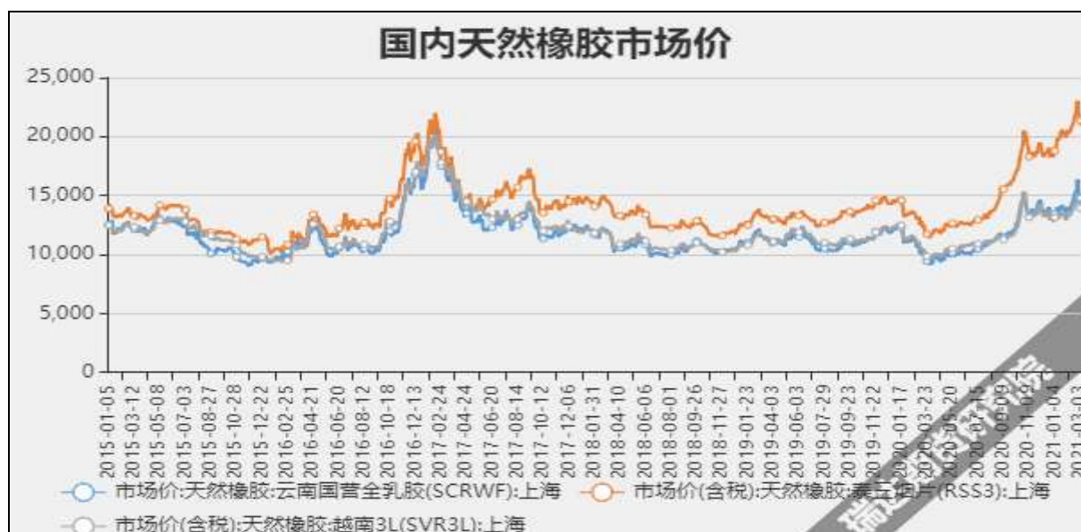
图2 国内天然橡胶市场价

截至3月26日当周，泰国合艾原料市场田间胶水63.5（-2）泰铢/公斤；杯胶44.5（-2.7）泰铢/公斤。