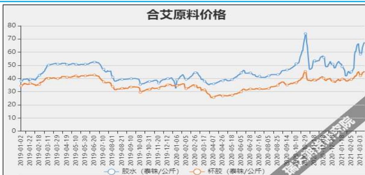
图1 国内天然橡胶市场价