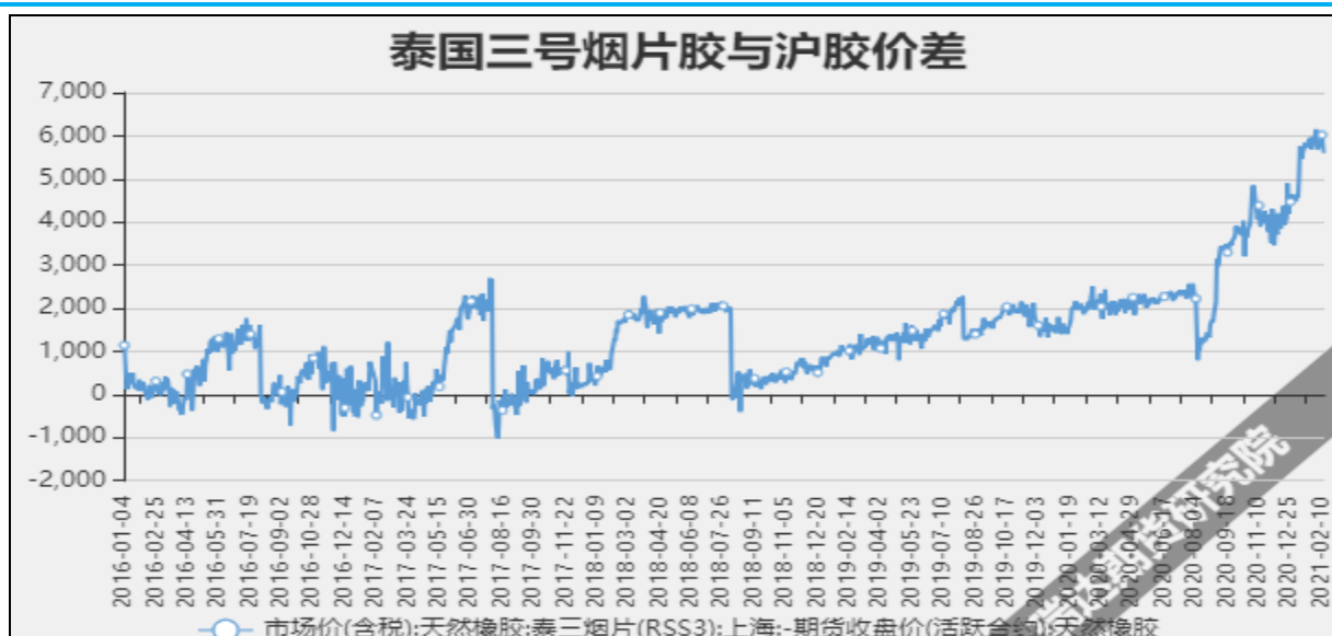
图8 泰国3号烟片与沪胶价差