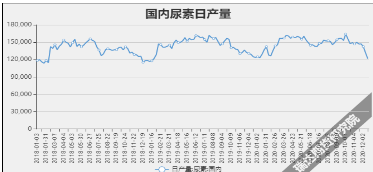
图7 国内尿素日产量