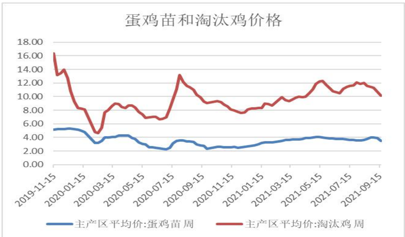
图2：淘汰鸡和蛋鸡苗主产区均价图

2、截至9月17日，蛋鸡苗3.50元/羽，周度-0.40元/羽，淘汰鸡10.10公斤，周度-0.58元/公斤。