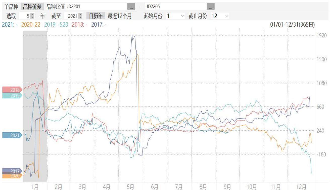
图8：鸡蛋2201合约与2205合约期价价差走势图