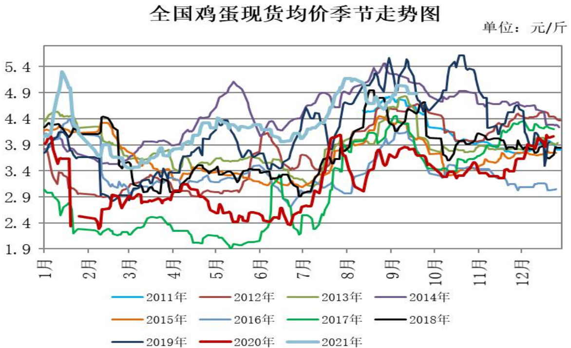
图4：全国鸡蛋现货均价季节性走势图

4、截至周五，鸡蛋现货价格报4888元/500千克，周比-126元/500千克。