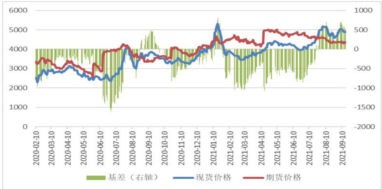
图7：鸡蛋2201合约期价与全国鸡蛋均价基差走势图