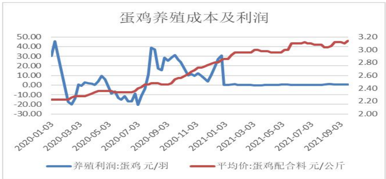
图3：蛋鸡养殖利润变化图

3、截止9月17日，蛋鸡养殖利润报+0.64元/羽，较上周-0.15元/羽；蛋鸡配合料价格报3.14元/公斤。