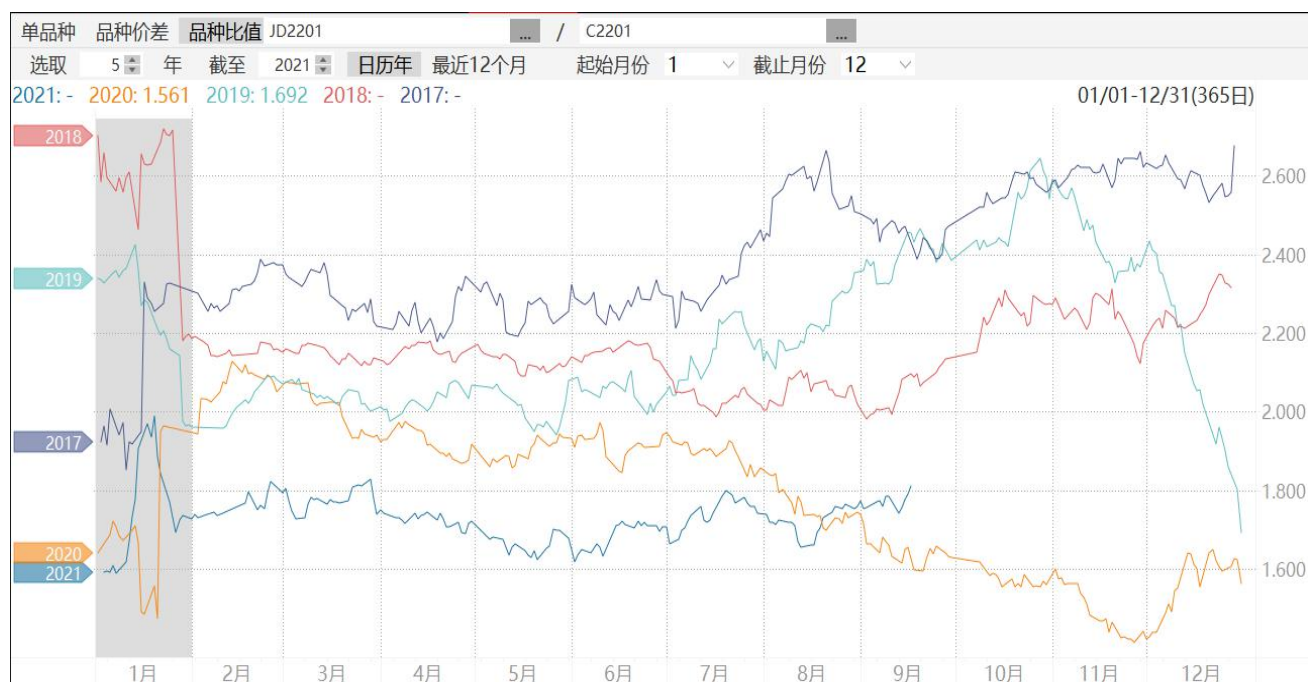
图9：鸡蛋2201合约与玉米2201合约期价比值走势图

9、截至周五，鸡蛋2201合约与玉米2201合约期价比值为1.810,处于同期较低水平。