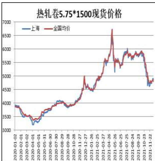
图1：热轧卷板现货价

12月10日，上海热轧卷板5.75mm Q235现货报价为4820元/吨，周环比+20元/吨；全国均价为4798元/吨，周环比-8元/吨。