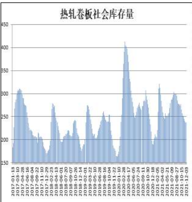
图10：全国33城热卷社会库存

12月9日，据Mysteel监测的全国33个主要城市社会库存为239.98万吨，较上周增加2.89万吨，较去年同期增加42.47万吨。