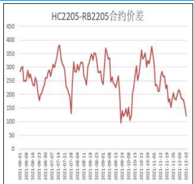
图6：热卷与螺纹跨品种套利

本周，HC2205合约走势弱于RB2205合约，10日价差为121元/吨，周环比-91元/吨。