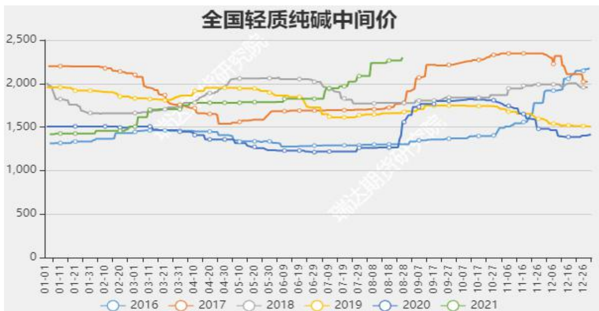
图4: 全国轻质纯碱中间价