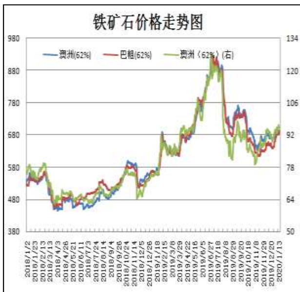
图1：本周铁矿石现货价格小幅波动