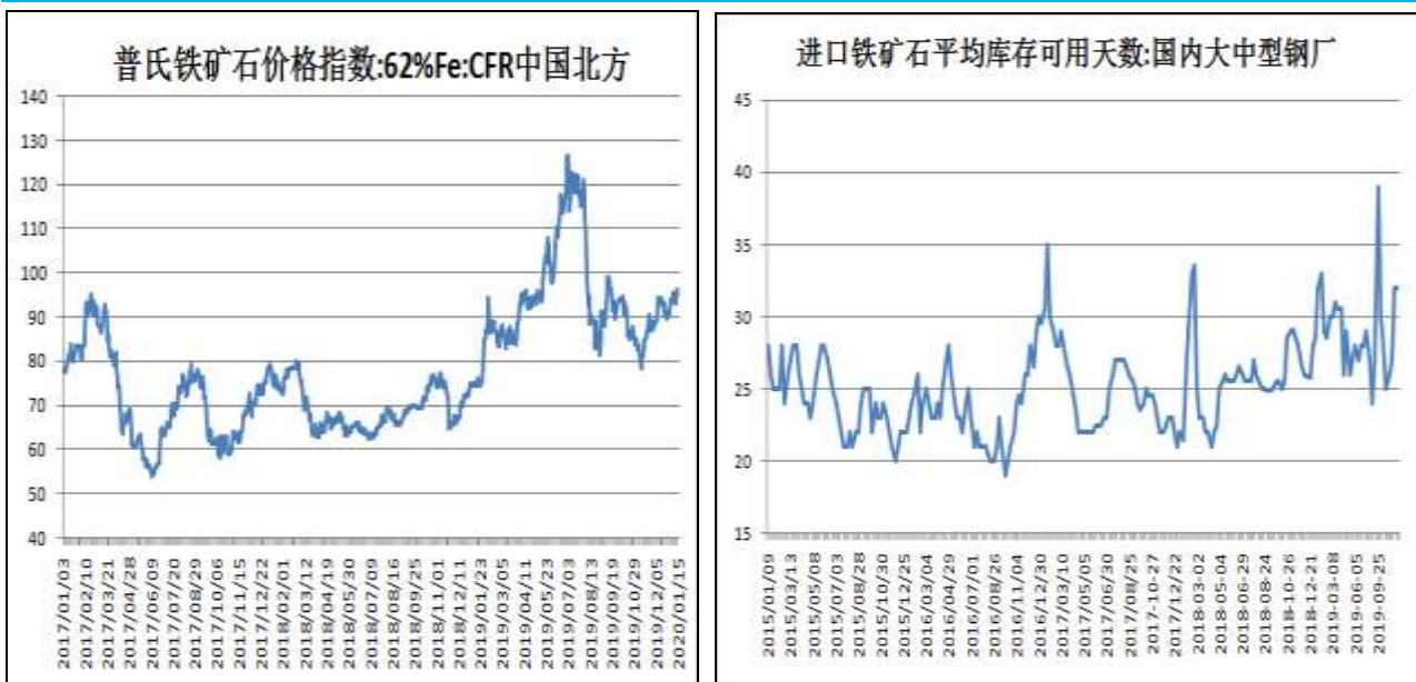
图10：钢厂铁矿石可用天数回升