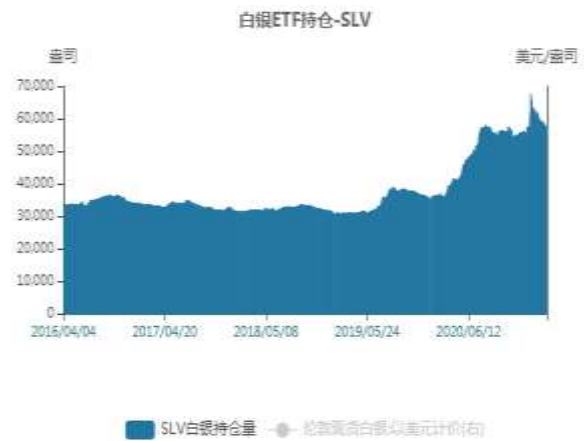
图6：白银ETF持仓量走势图