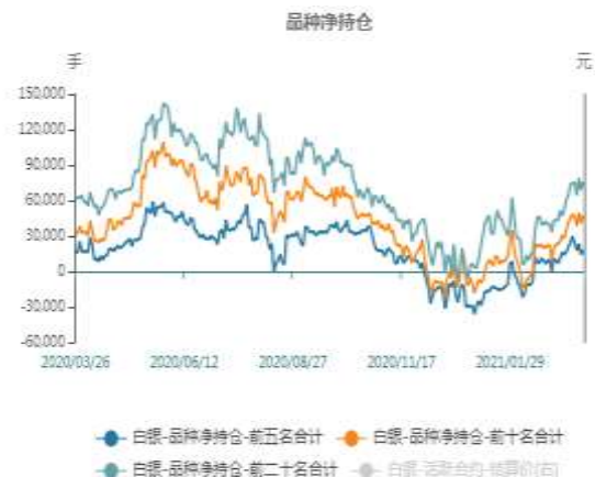
图2：沪银期货净持仓走势图