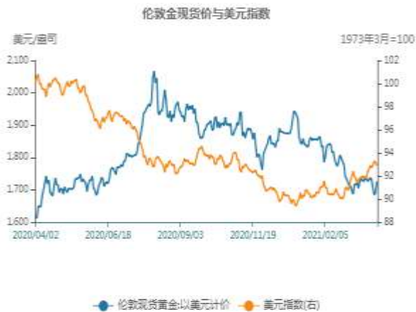
图13: 黄金与美元指数相关性走势图