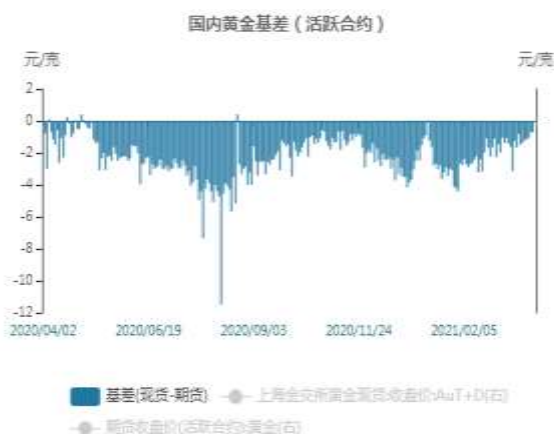
图7：国内黄金基差贴水走势图