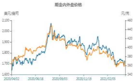
图11: 期金内外盘价格走势图

● 期货收盘价(活跃合约):COMEX黄金 ● 期货收盘价(活跃合约):黄金(右)