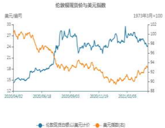
图14: 白银与美元指数相关性走势图