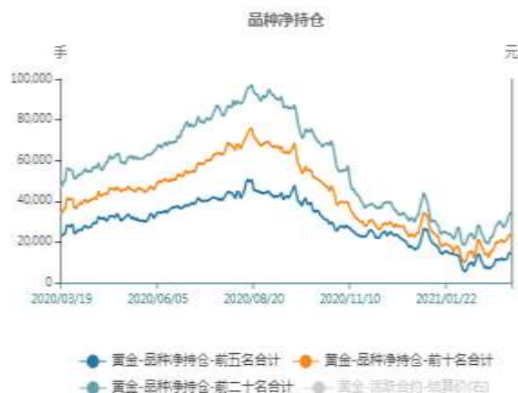
图1：沪金期货净持仓走势图