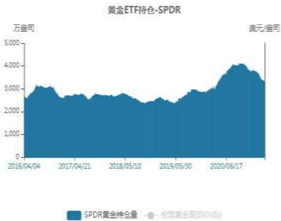
图5：黄金ETF持仓走势图

美国商品期货交易委员会（CFTC）：截至4月1日当周，COMEX黄金期货投机性净多头持仓由180196降至174067手，COMEX白银期货投机性净多头持仓由33609降至31079手。