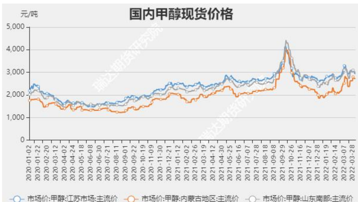
图3 甲醇现货市场主流价

截至4月7日，NYMEX天然气收盘价6.39美元/百万英热单位，较上周+0.76美元/百万英热单位。