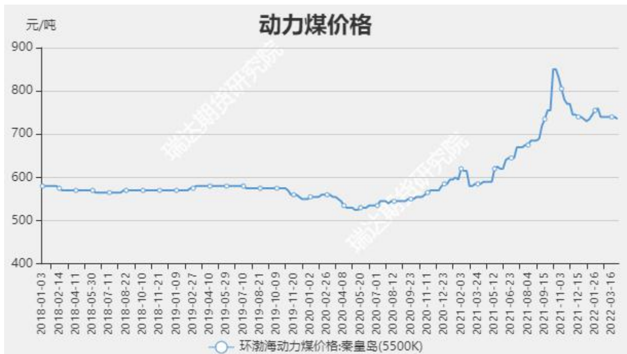
图1 环渤海动力煤价格:秦皇岛(5500K)