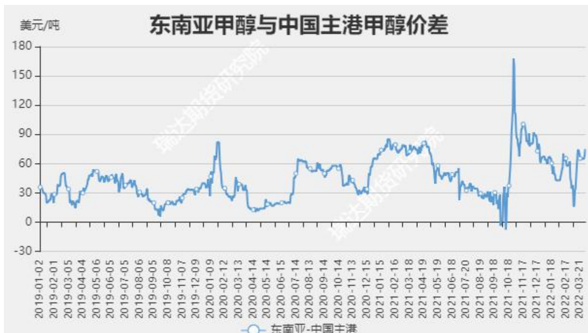
图6 甲醇东南亚与中国主港价差