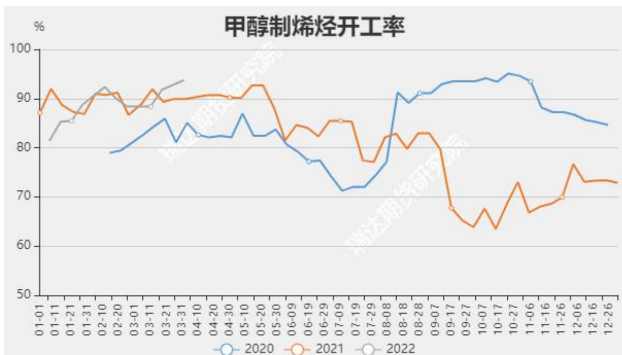
图13 甲醇制烯烃开工率

截止4月6日当周，华东港口甲醇库存60.07万吨，较上周+1.83万吨；华南港口甲醇库存14.29吨，较上周-1.55万吨。