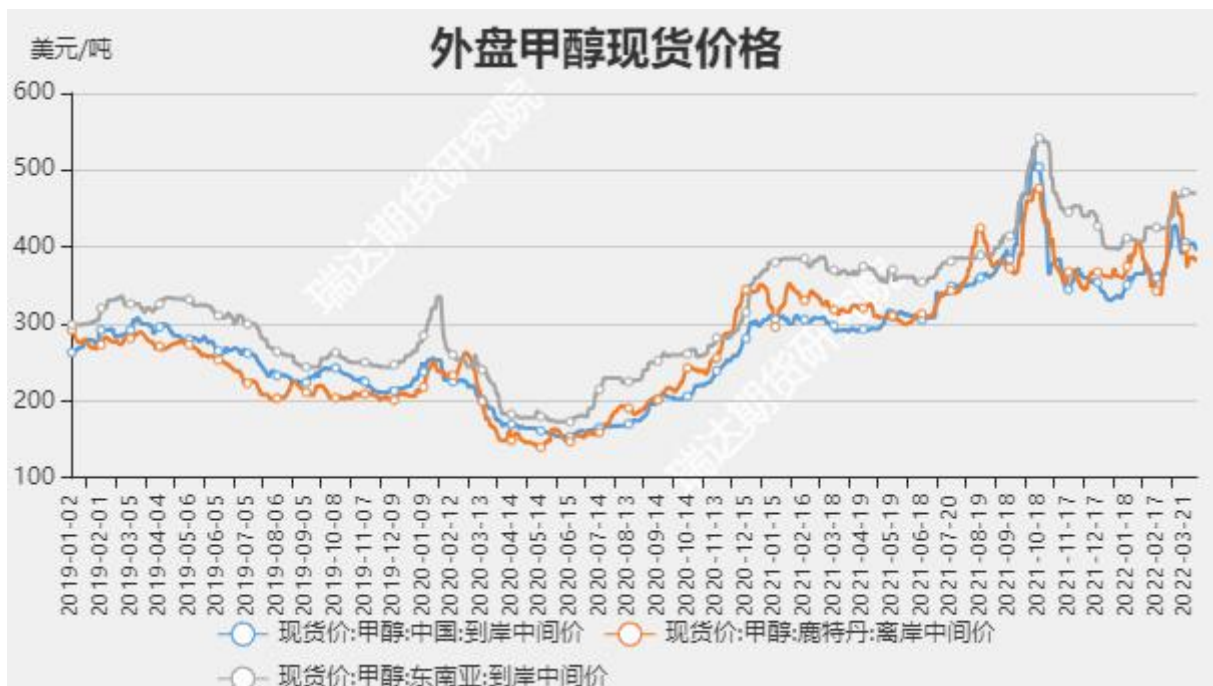
图5 外盘甲醇现货价格