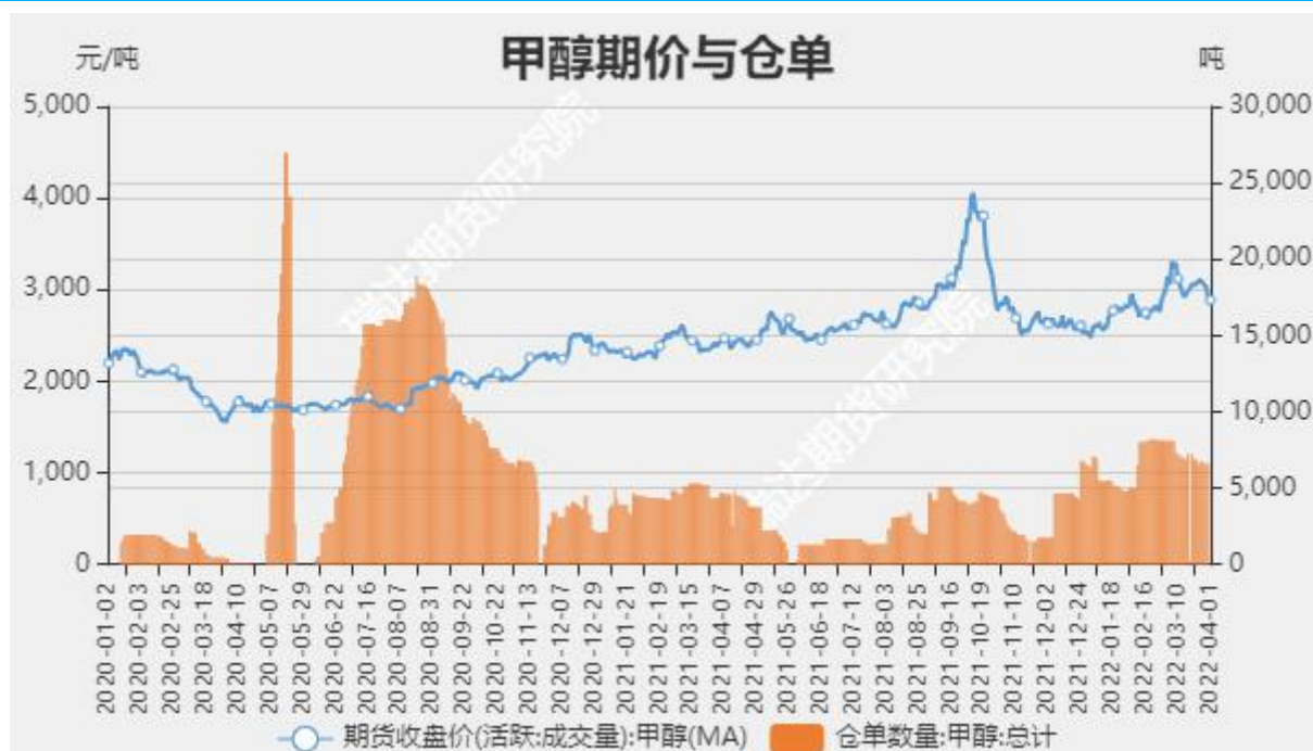
图9 甲醇期价与仓单数量