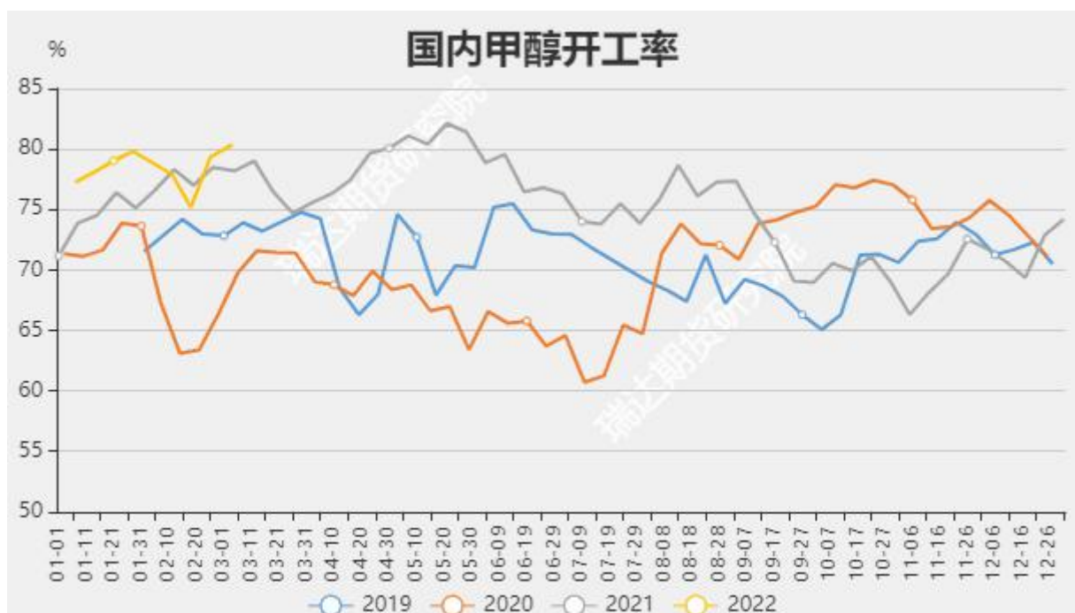
图10 国内甲醇开工率