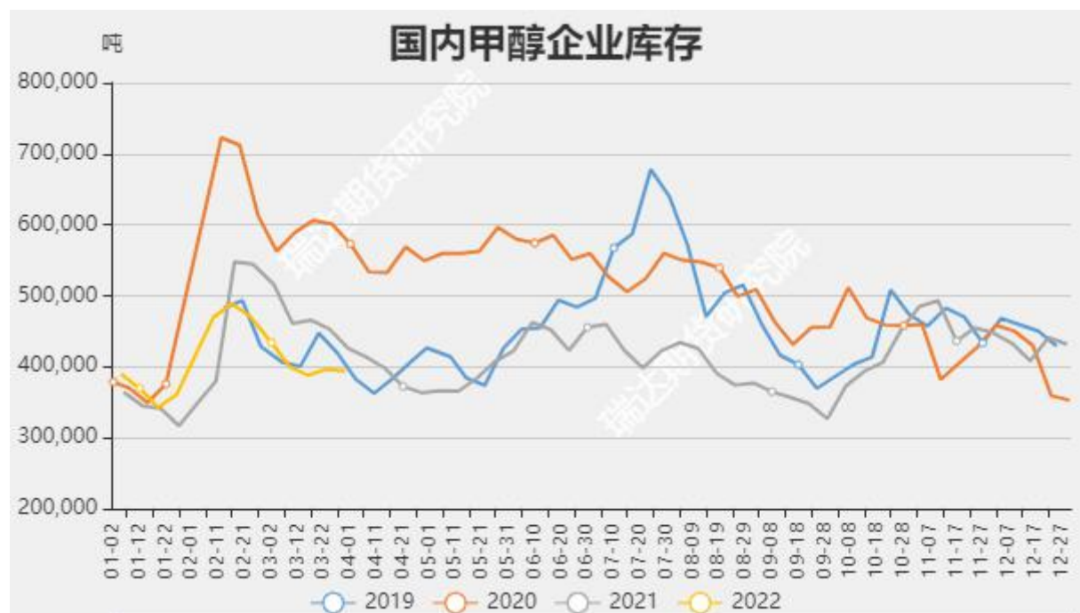
图11 国内甲醇企业库存