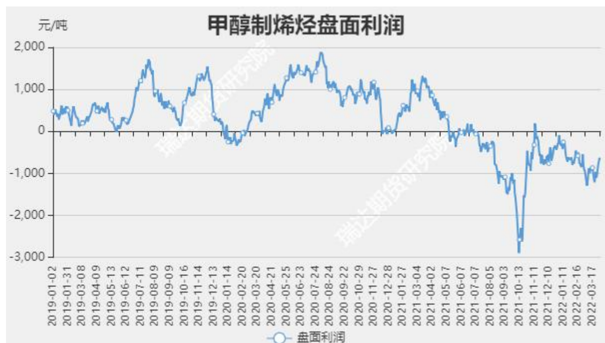
图15 甲醇制烯烃盘面利润