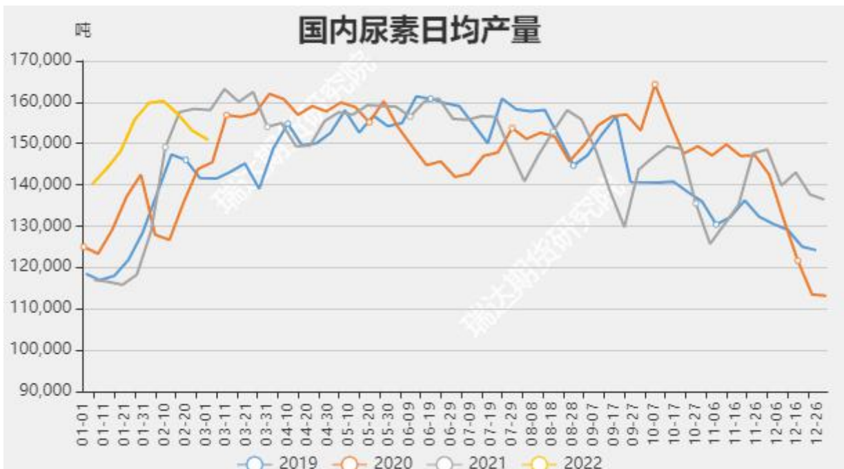
图7 国内尿素日产量