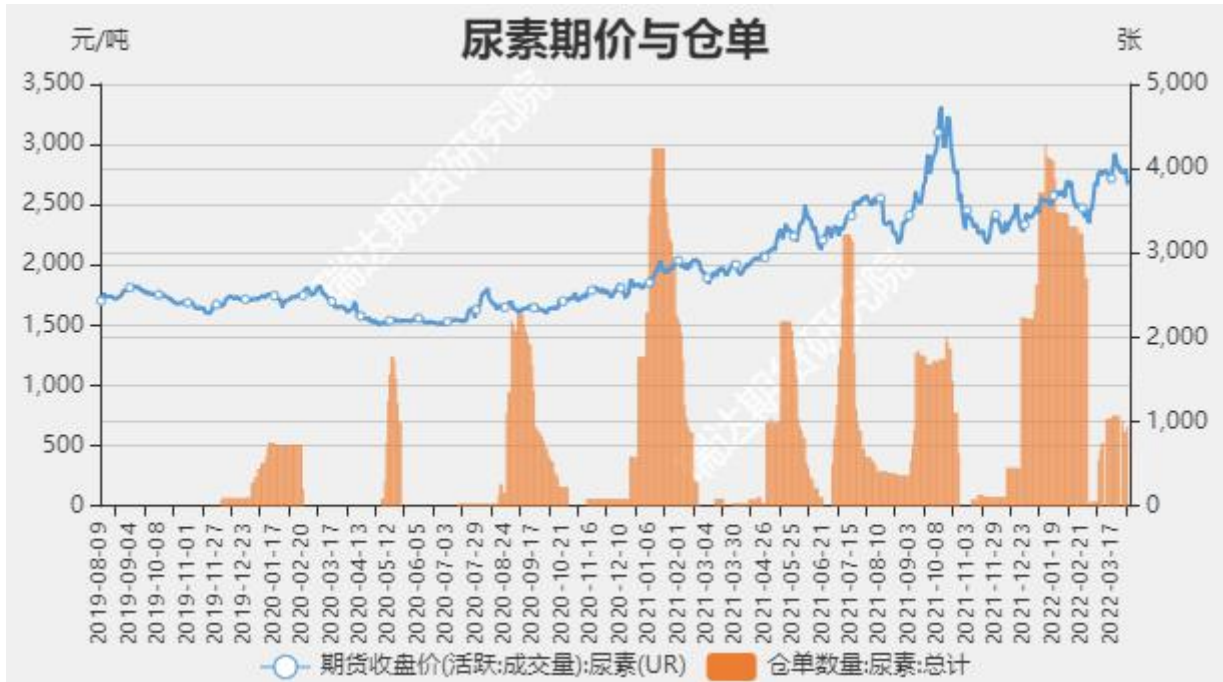
图6 尿素期价与仓单走势