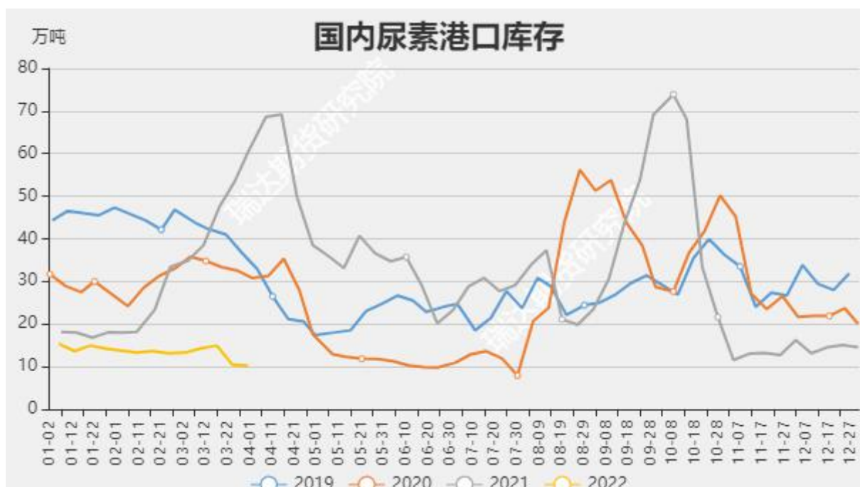
图9 国内尿素港口库存