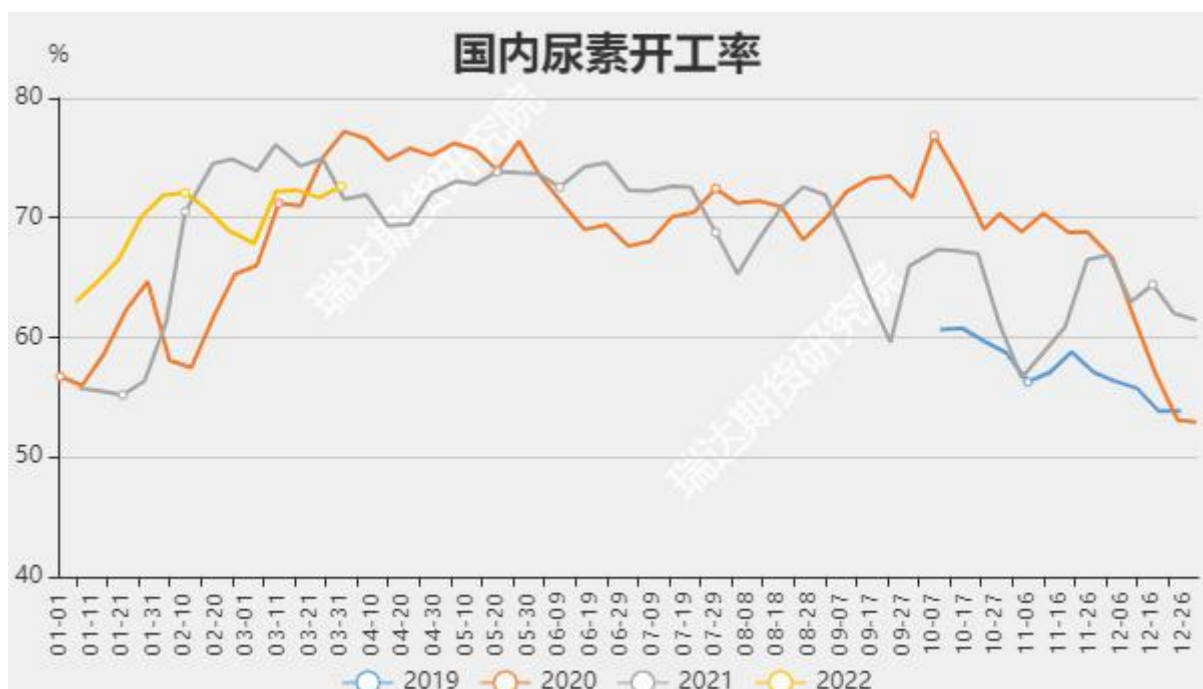
图8 国内尿素开工率