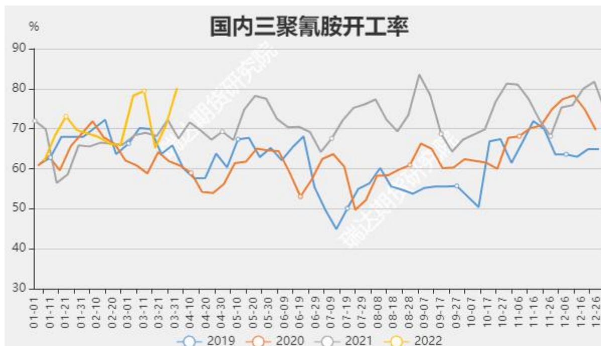
图12 三聚氰胺开工率