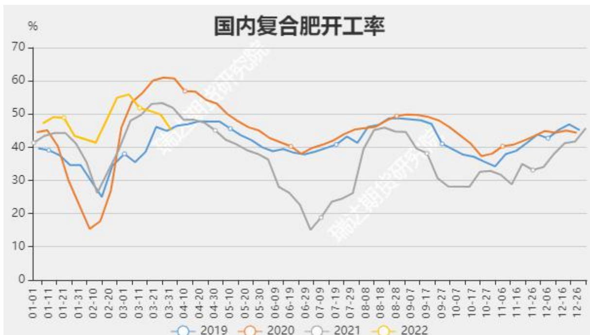
图11 复合肥装置开工率