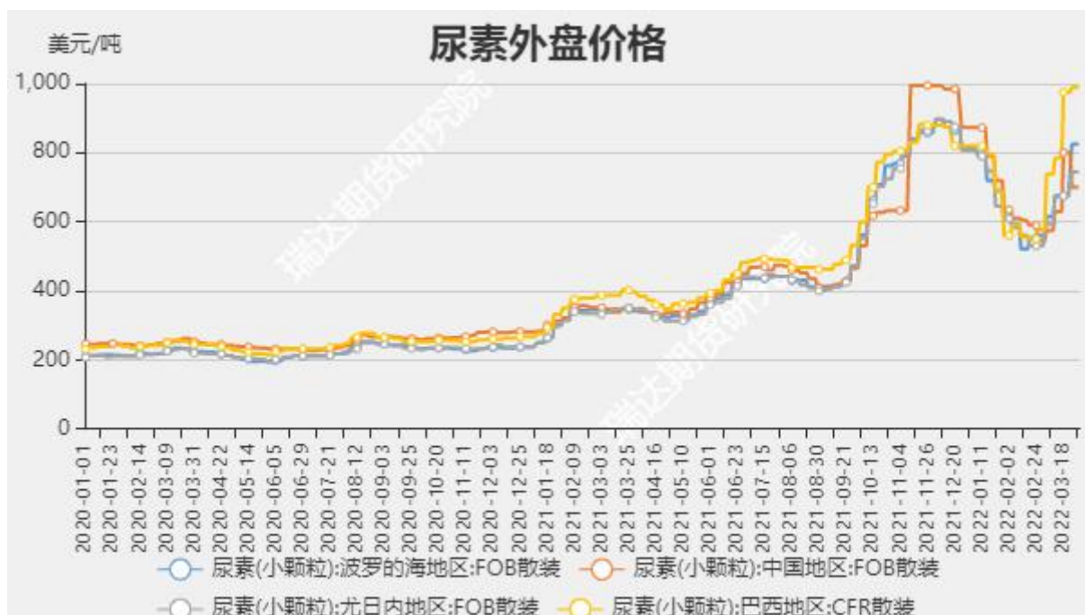
图4 尿素外盘现货价