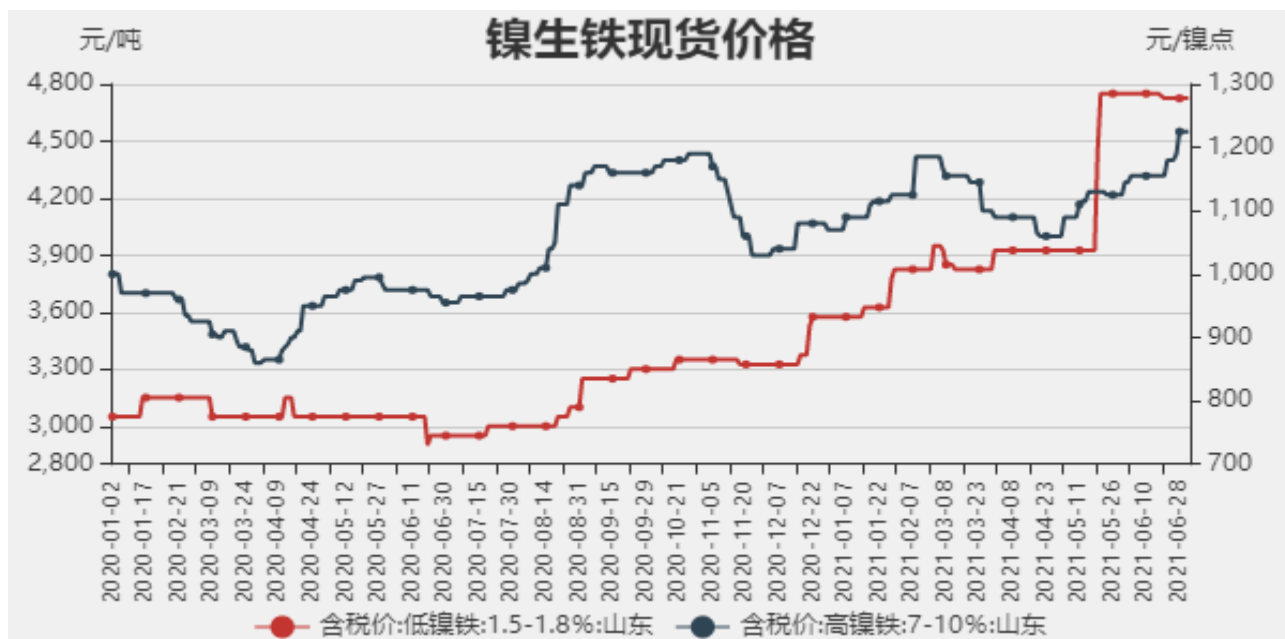
图1：镍生铁现货价格

截止至2021年7月2日，以山东地区为例，低镍铁(FeNi1.5-1.8)价格为4725元/吨，高镍生铁(FeNi7-10)价格为1225元/镍点。