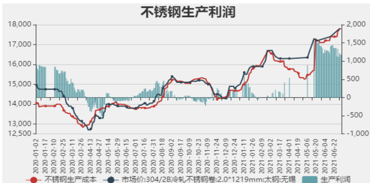
图9：不锈钢生产利润