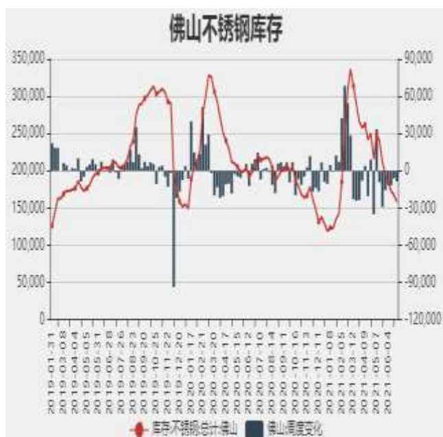
图5：佛山不锈钢月度库存