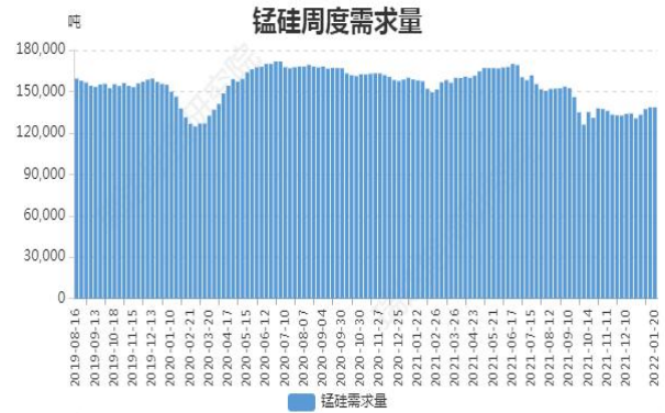
图16: 锰硅周度需求量

截止1月20日, 全国锰硅需求量(周需求): 138478 吨, 环比上周增 0.93%。