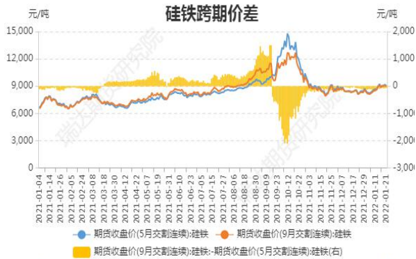
图5：硅铁期货跨期价差

截止1月21日，期货SF2205与SF2209（远月-近月）价差为-60元/吨，较前一周涨38元/吨。