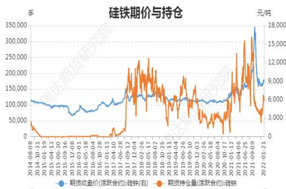
图3：硅铁期价与持仓

截止1月21日，硅铁期货主力合约收盘价 9018 元/吨，较前一周跌 220 元/吨；硅铁期货主力合约持仓量 113088 手，较前一周减 18764 手。