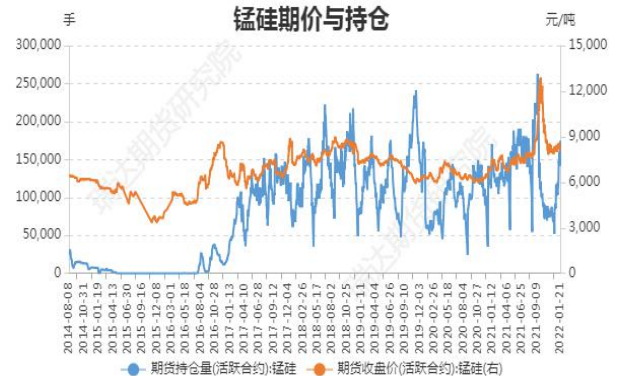
图4：锰硅期价与持仓

截止1月21日，锰硅期货主力合约收盘价 8050 元/吨，较前一周跌 536 元/吨；锰硅期货主力合约持仓 174891 手，较前一周增 29245 手。