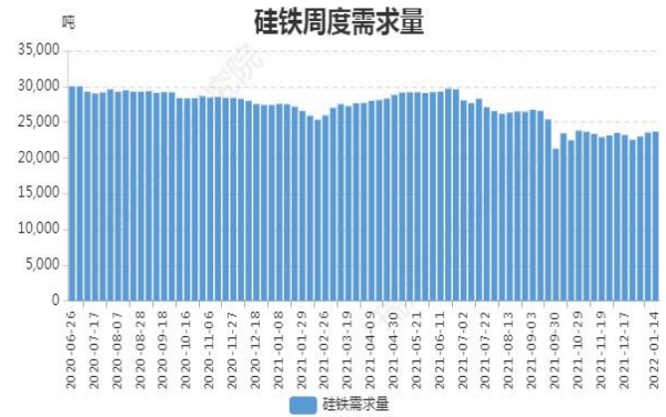
图14: 硅铁周度需求量

截至1月14日, 全国硅铁需求量(周需求): 23679 吨, 环比上周增 0.55%。