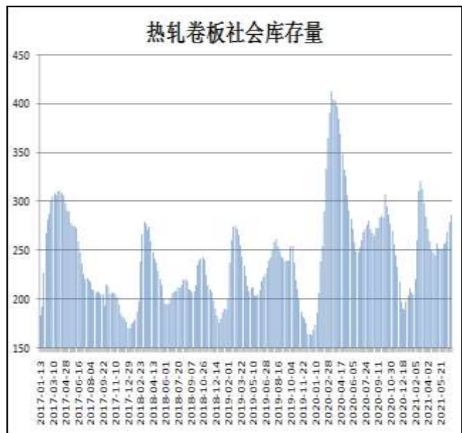
图10：全国33城热卷社会库存

7月1日，据Mysteel监测的全国33个主要城市社会库存为286.11万吨，较上周增加7.43万吨，较去年同期增加33.55万吨。