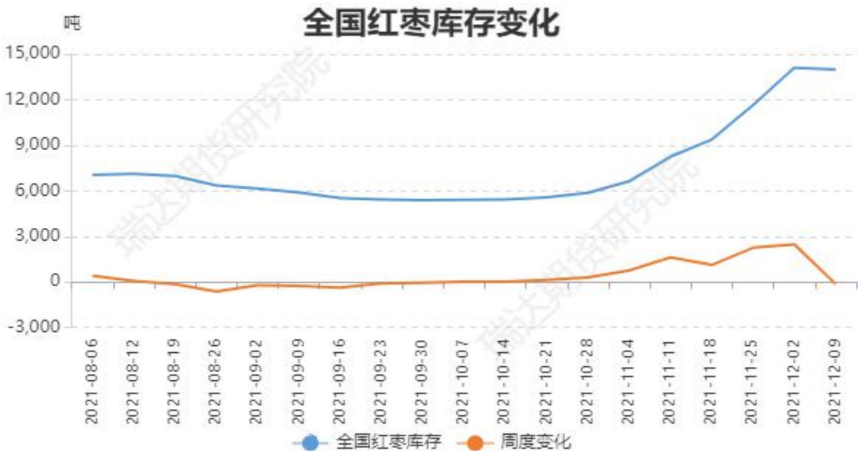
图4：红枣主要样本库存走势