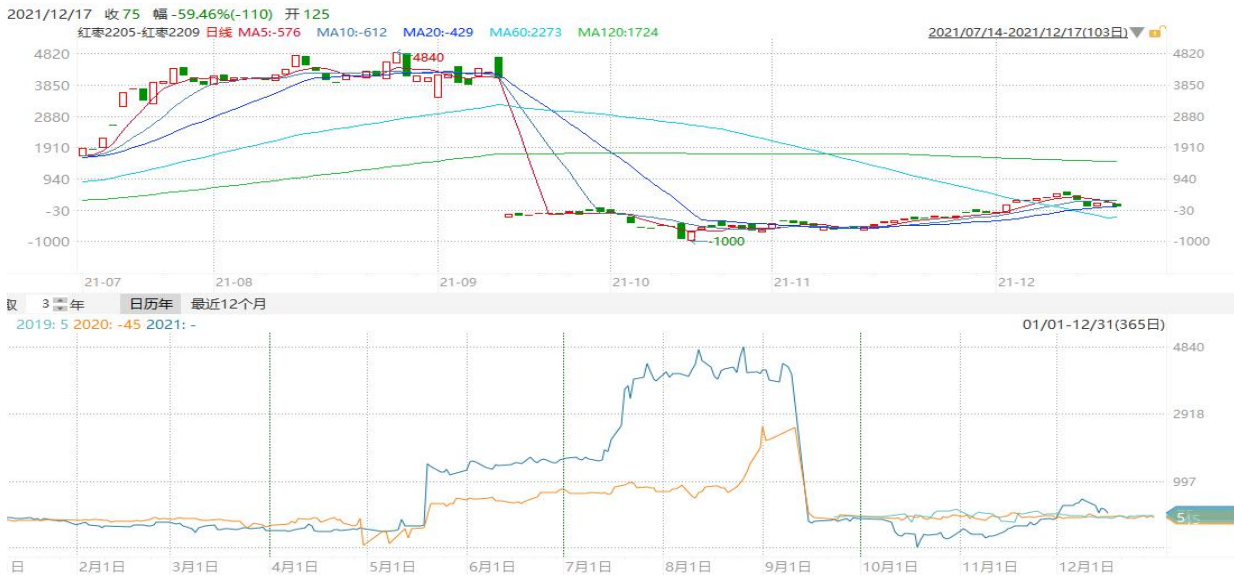
图7：郑商所红枣近远月价差走势