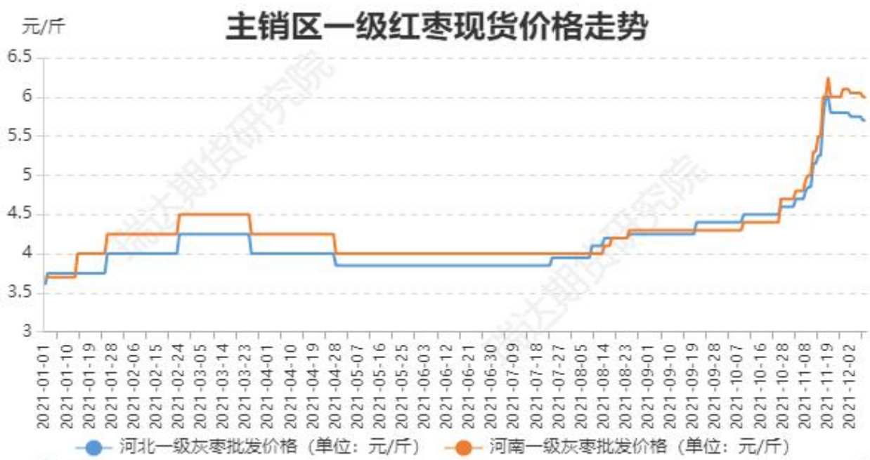
图1：主销区一级灰枣价格走势