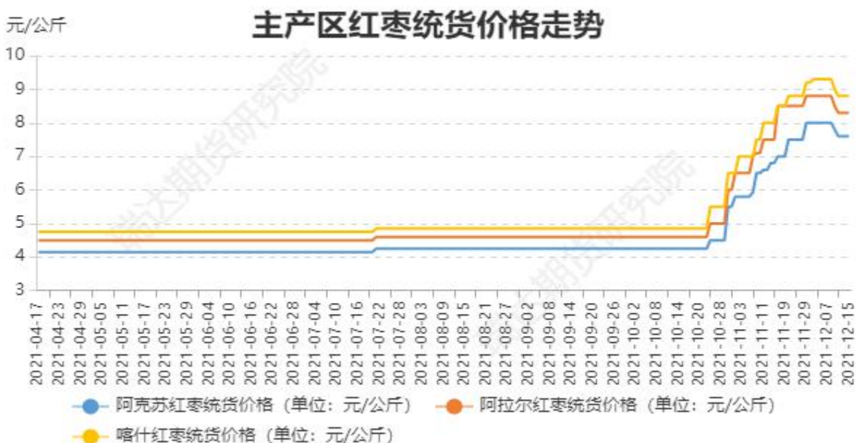
图3：主产区红枣统货价格价格走势