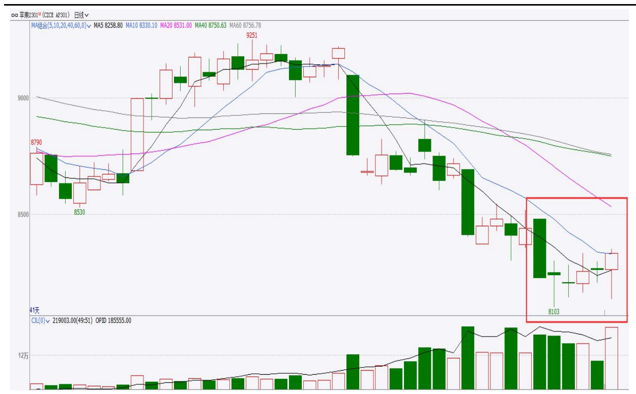
图、苹果主力2301合约价格走势