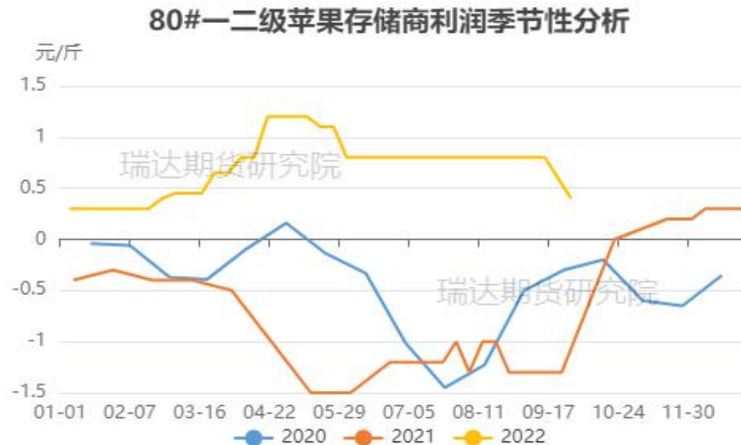
图、80#一二级富士存储商利润走势