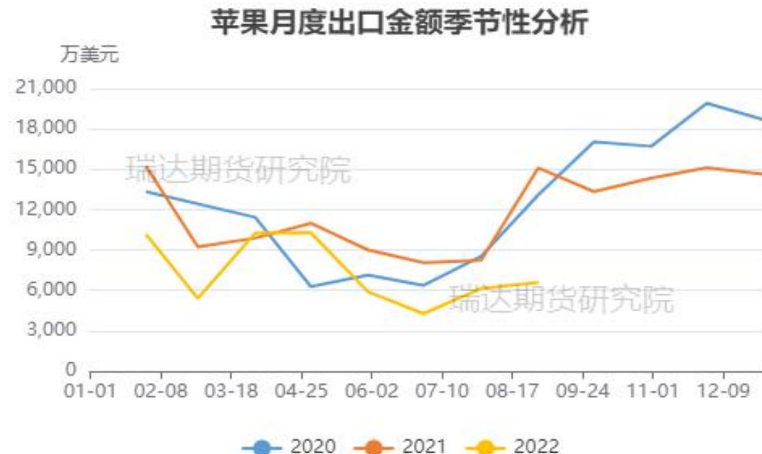
图、苹果出口金额季节性走势