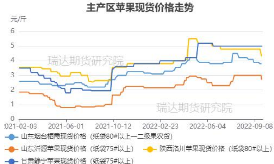
图、主产区苹果现货价格走势