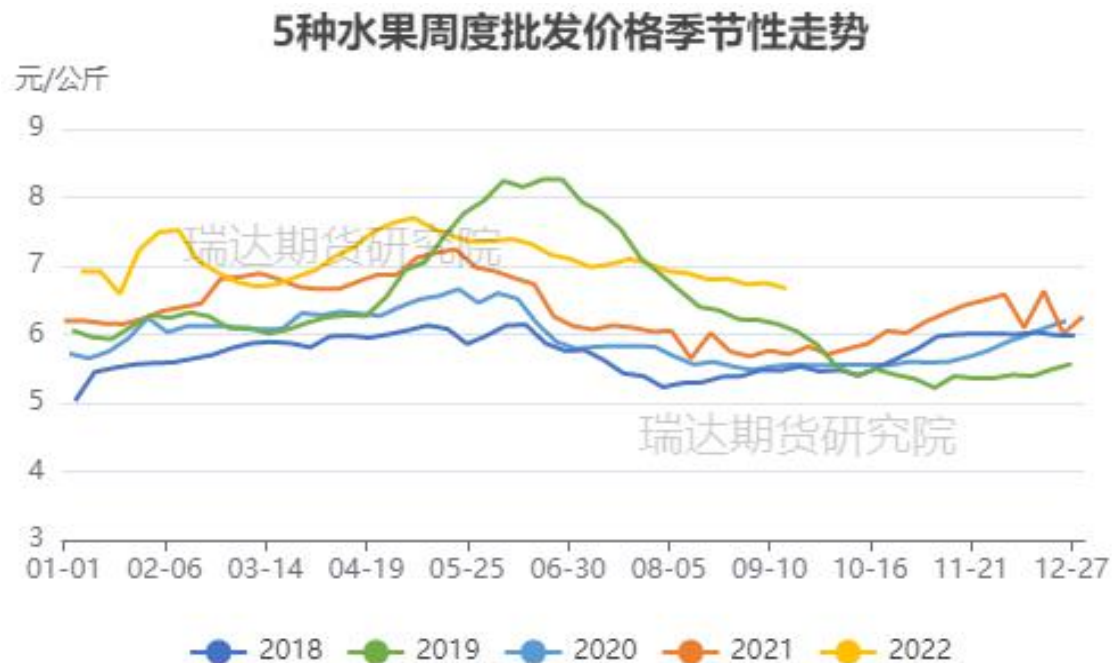
图、5种水果批发价格走势（富士、香蕉、葡萄、鸭梨和西瓜）