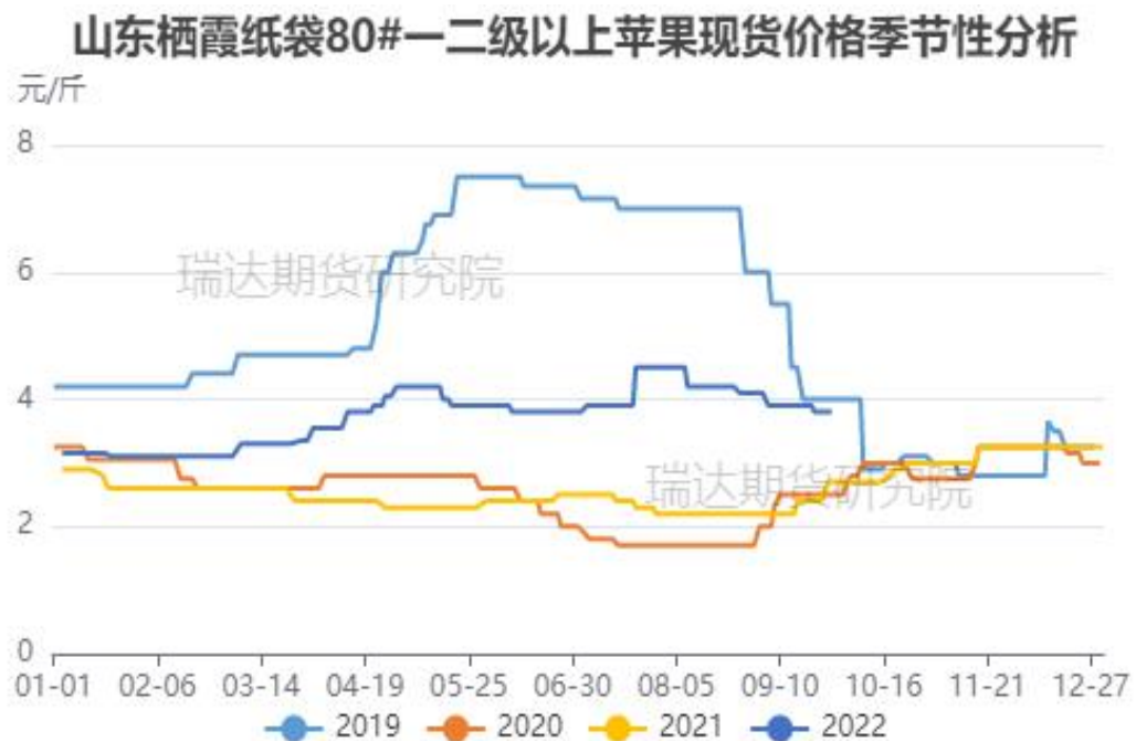
图、山东栖霞80#一二级苹果现货价格季节性走势