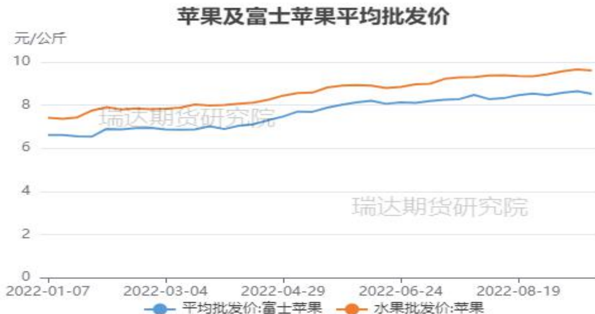
图、全品种苹果及富士苹果批发价格