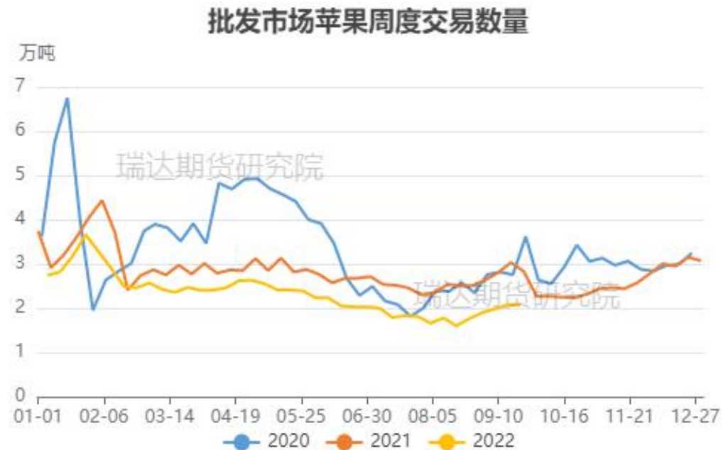
图、苹果批发市场走货情况