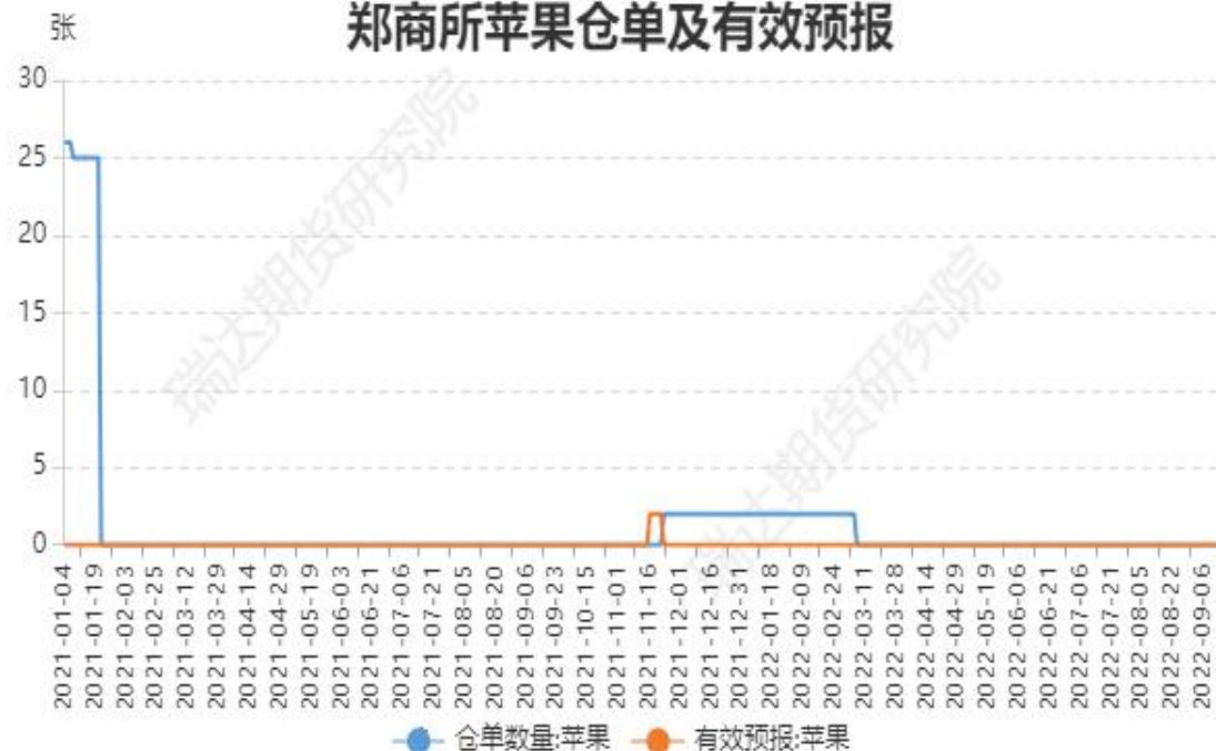
郑商所苹果仓单及有效预报