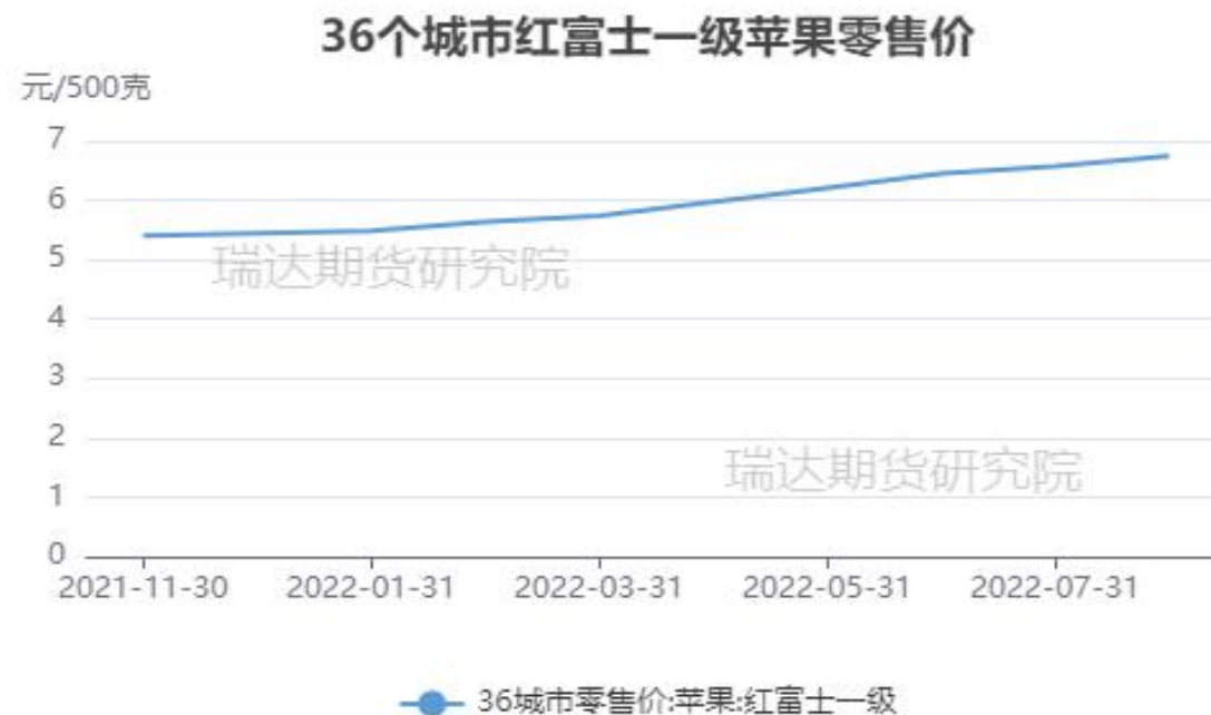
图、36个城市富士苹果零售价格走势