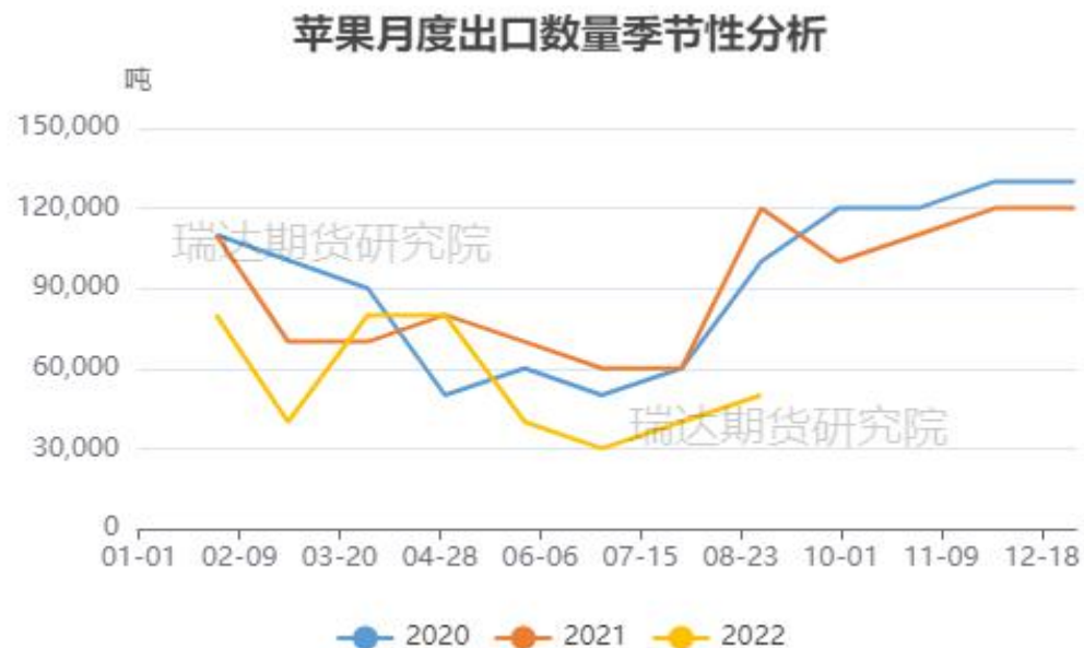
图、苹果出口量季节性情况