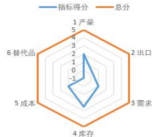
苹果影响因素分析