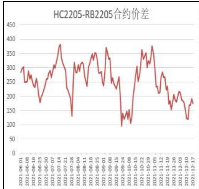
图6：热卷与螺纹跨品种套利

本周，HC2205合约走势强于RB2205合约，17日价差为175元/吨，周环比+54元/吨。