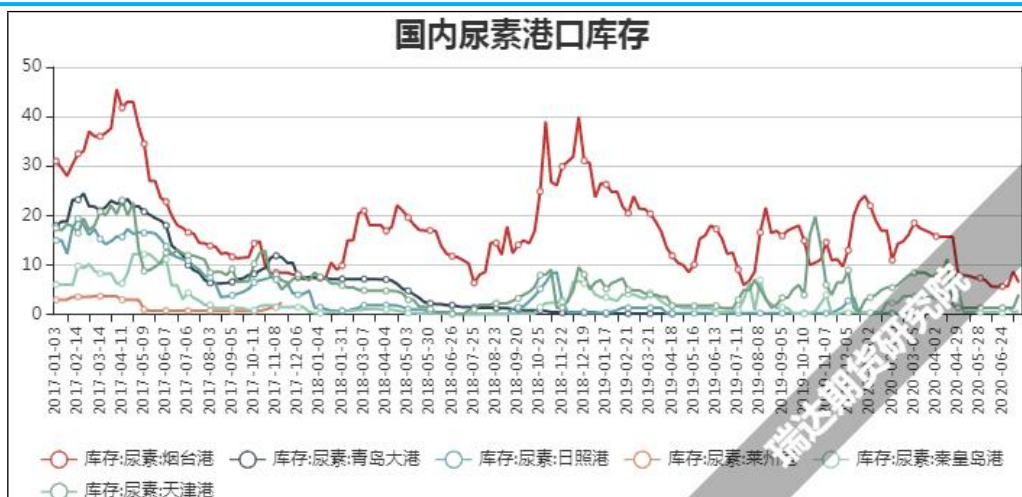
图9 国内尿素港口库存