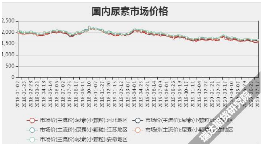
图3 国内尿素市场主流价

截至7月23日，NYMEX天然气收盘价1.78美元/百万英热单位，较上周+0.05美元/百万英热单位。