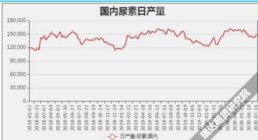
图7 国内尿素日产量