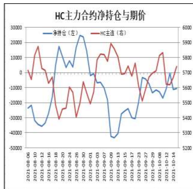
图12：热卷主力合约前20名净持仓

HC2201合约前20名净持仓情况，8日为净空12704手，15日为净空10533手，净空减少2171手，由于空单减幅略大于多单。