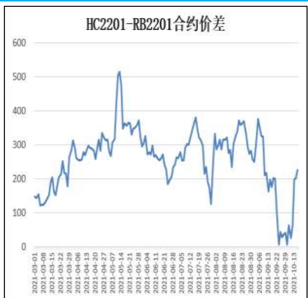
图6：热卷与螺纹跨品种套利

本周，HC2201合约走势强于RB2201合约，15日价差为225元/吨，周环比+162元/吨。建议价差100附近多卷空螺，300-350区间则空卷多螺。