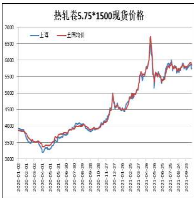
图1：热轧卷板现货价

10月15日，上海热轧卷板5.75mm Q235现货报价为5780元/吨，周环比-80元/吨；全国均价为5858元/吨，周环比-56元/吨。