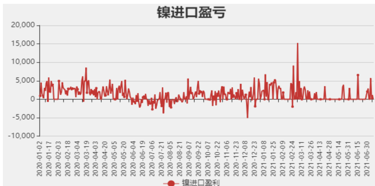
图4：镍进口盈亏分析