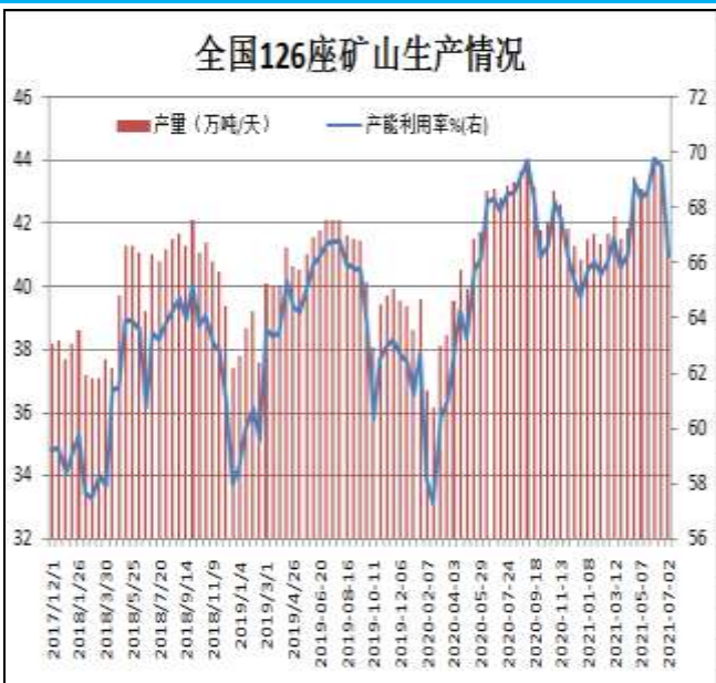
图13: 全国126座矿山产能利用率

据Mysteel统计，截止7月2日全国126座矿山样本产能利用率为66.3%，环比上期调研降3.22%；库存68.8万吨，减少2.5万吨。