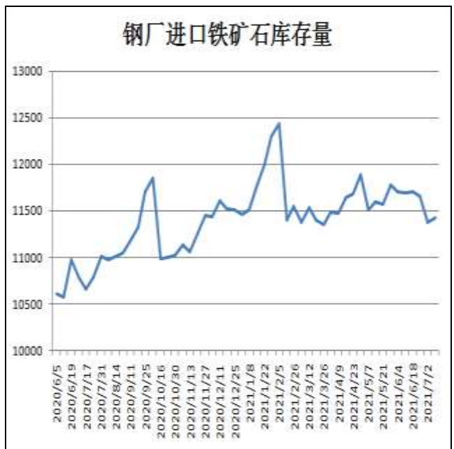
图10：钢厂铁矿石库存量

9日据Mysteel统计样本钢厂进口铁矿石库存总量11427.88万吨，环比增加46.89万吨；当前样本钢厂的进口矿日耗为280.38万吨，环比增加16.89万吨，库存消费比40.76，环比减少2.43。