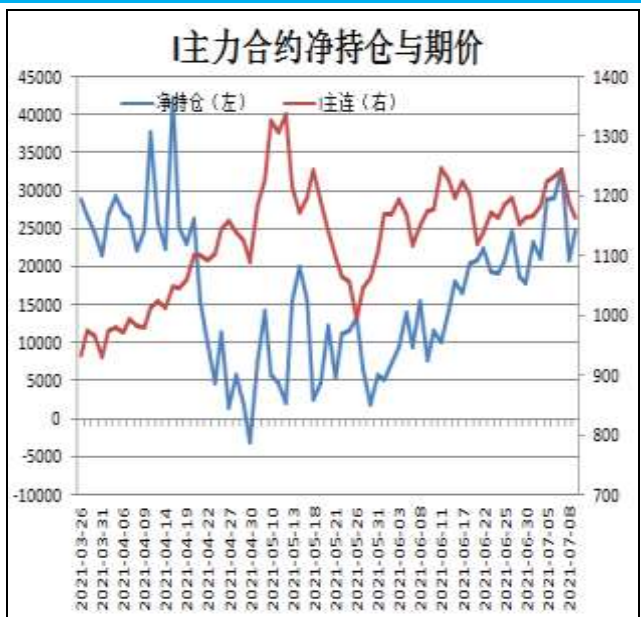
图14: 铁矿主力合约前20名净持仓

I2109合约前20名净持仓情况，2日为净多21017手，9日为净多24803手，净多增加3786手，由于主流持仓空单减幅略大于多单。