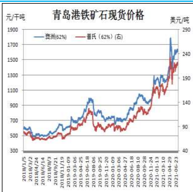
图1：铁矿石现货价格走势