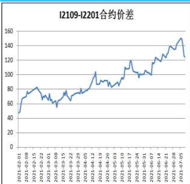
图5：铁矿石跨期套利

本周，I2109合约走势弱于I2201合约，9日价差为124元/吨，周环比-19.5元/吨。