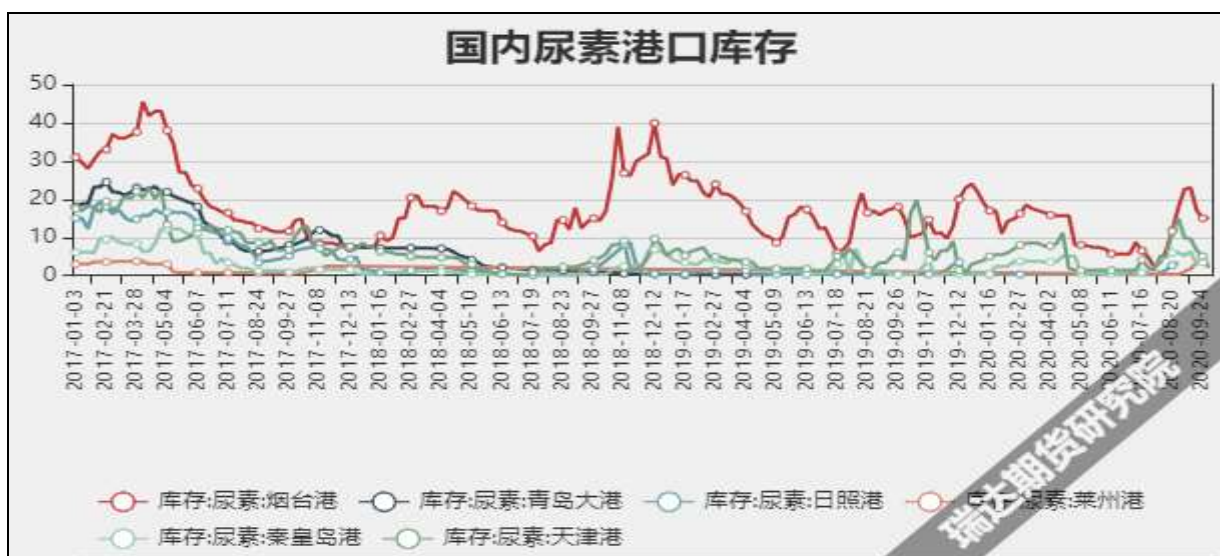
图9 国内尿素港口库存