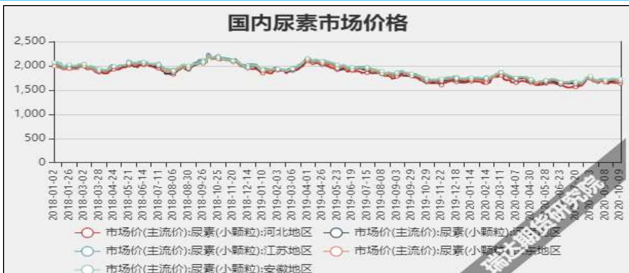
图3 国内尿素市场主流价

截至10月29日，NYMEX天然气收盘价3.32美元/百万英热单位，较上周+0.34美元/百万英热单位。