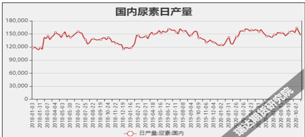
图7 国内尿素日产量