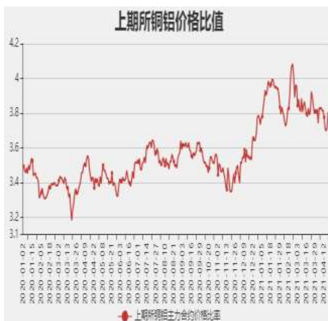
图9：沪铜和沪铝主力合约价格比率