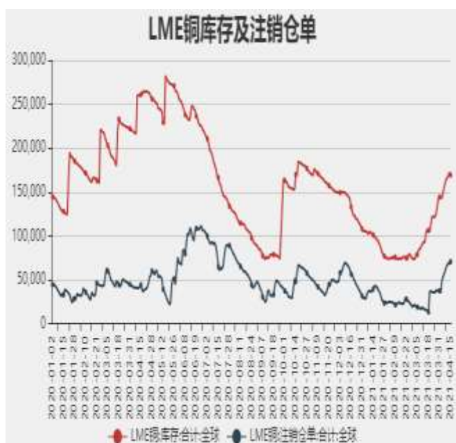
图7：LME铜库存及注销仓单