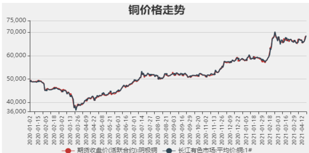
图1：铜期现价格走势

截止至2021年4月16日，长江有色市场1#电解铜平均价为68540元/吨；电解铜期货价格为68580元/吨。