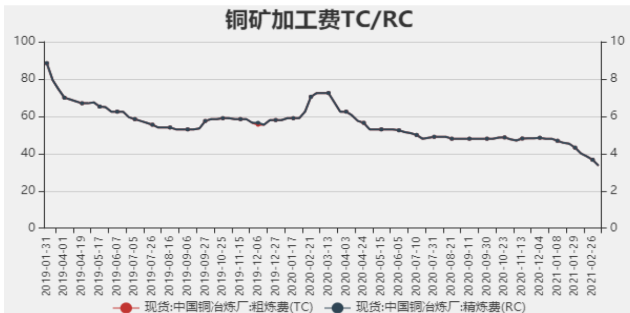
图2：中国铜冶炼加工费

2021年3月5日中国铜冶炼厂粗炼费（TC）为33.5美元/干吨，精炼费（RC）为3.35美分/磅，较上周下调3.2美元/干吨。