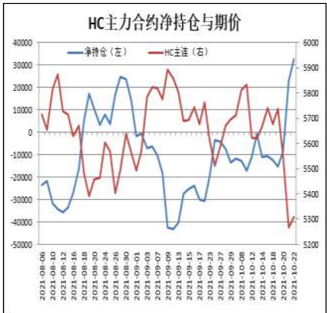
图12：热卷主力合约前20名净持仓

HC2201合约前20名净持仓情况，15日为净空10533手，22日为净多32677手，净多增加43210手，由于多单增幅大于空单。