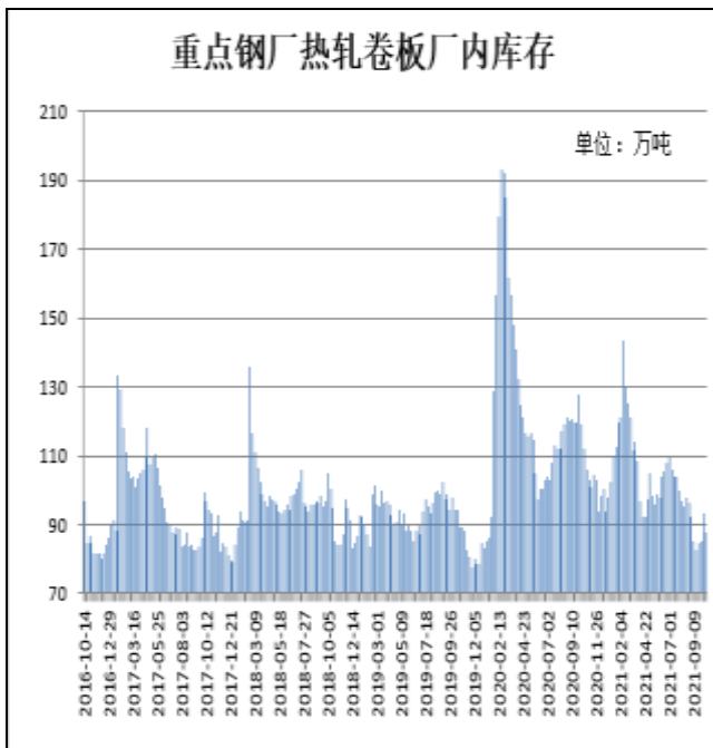
图9：样本钢厂热卷厂内库存

10月21日，据Mysteel监测的全国37家热轧板卷生产企业中热卷厂内库存量为86.74万吨，较上周减少1.14万吨，较去年同期减少25.21万吨。