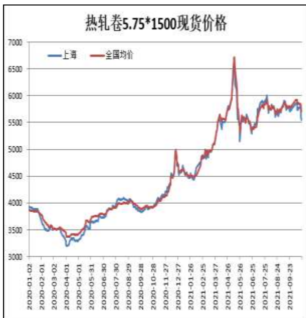
图1：热轧卷板现货价

10月22日，上海热轧卷板5.75mm Q235现货报价为5550元/吨，周环比-230元/吨；全国均价为5703元/吨，周环比-155元/吨。