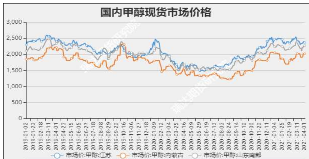
图3 甲醇现货市场主流价

截至4月15日，NYMEX天然气收盘价2.66美元/百万英热单位，较上周+0.14美元/百万英热单位。