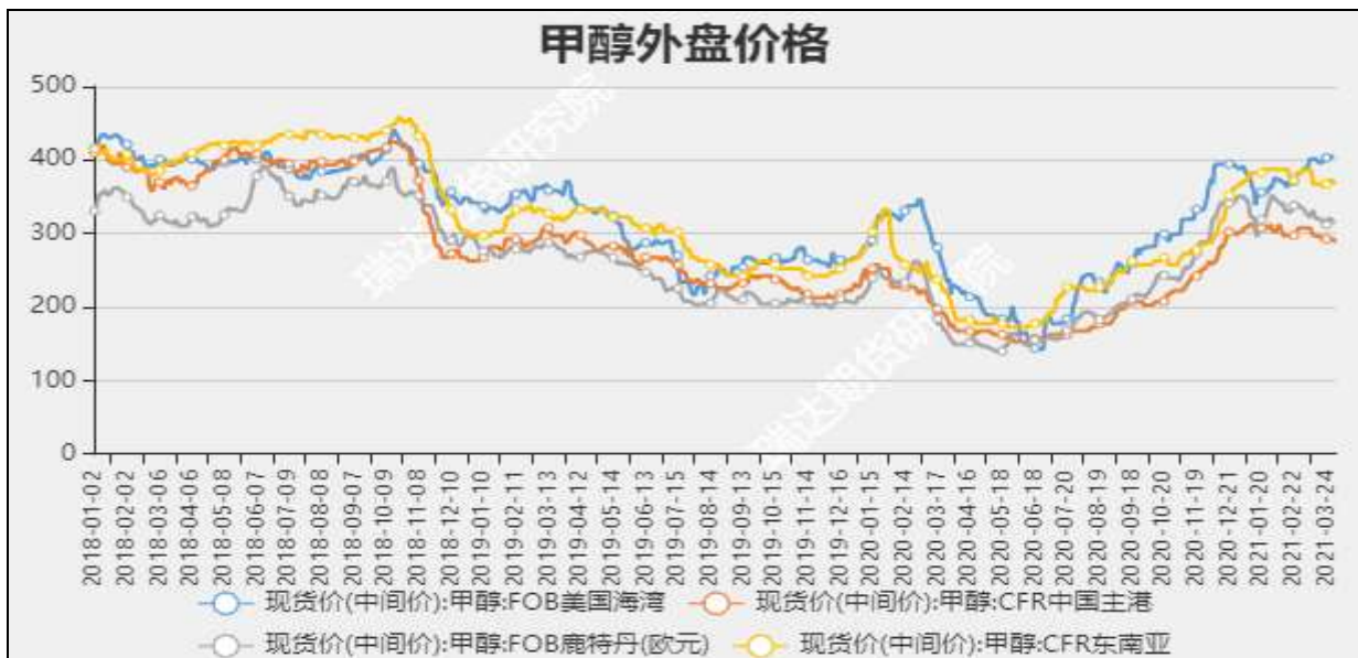
图5 外盘甲醇现货价格