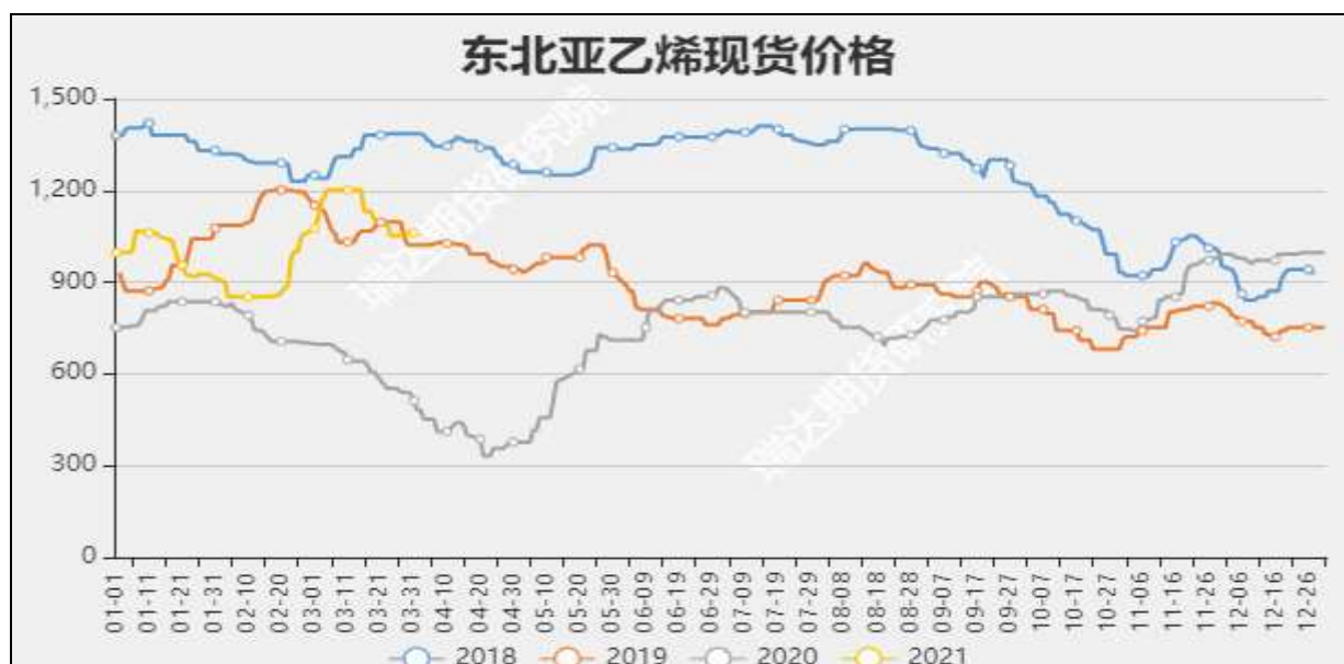
图13 东北亚乙烯现货价

截至4月14日当周，内陆地区部分甲醇代表性企业库存量39.81万吨，较上周-1.55万吨。